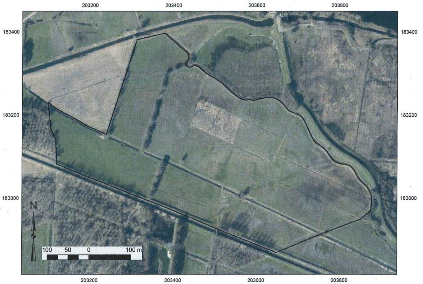
Orthofoto (winteropname 2015) met aanduiding van de te beschermen zone