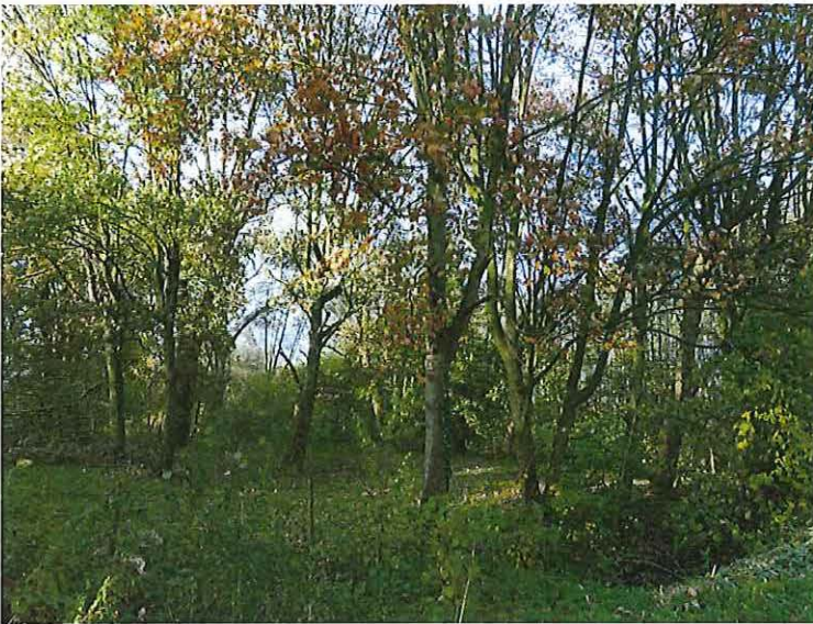
Foto 21: Gemengd bos in de voormalige zone met weekendverblijven.