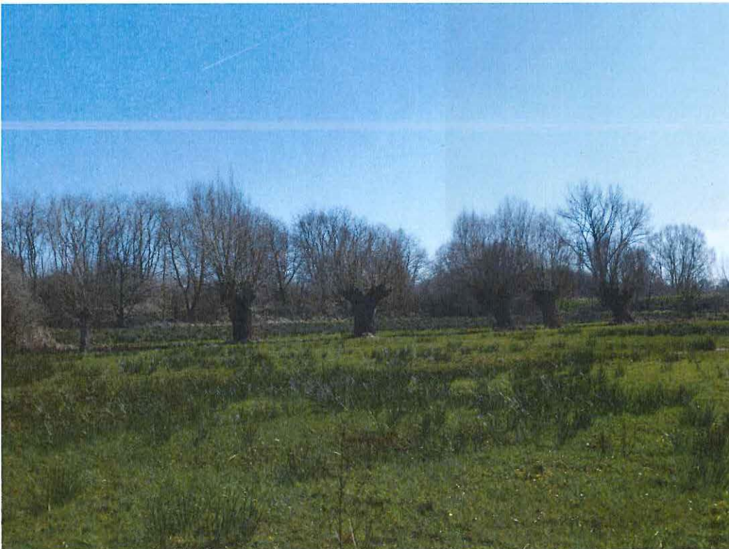
Foto 4: Knotwilgenrij langs voormalige perceelsgrens in de meersen.