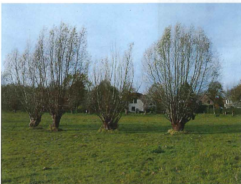
Foto 2: Knotwilgenrij op de voormalige perceelsgrens van een weiland op de Vliegpleinkouter.