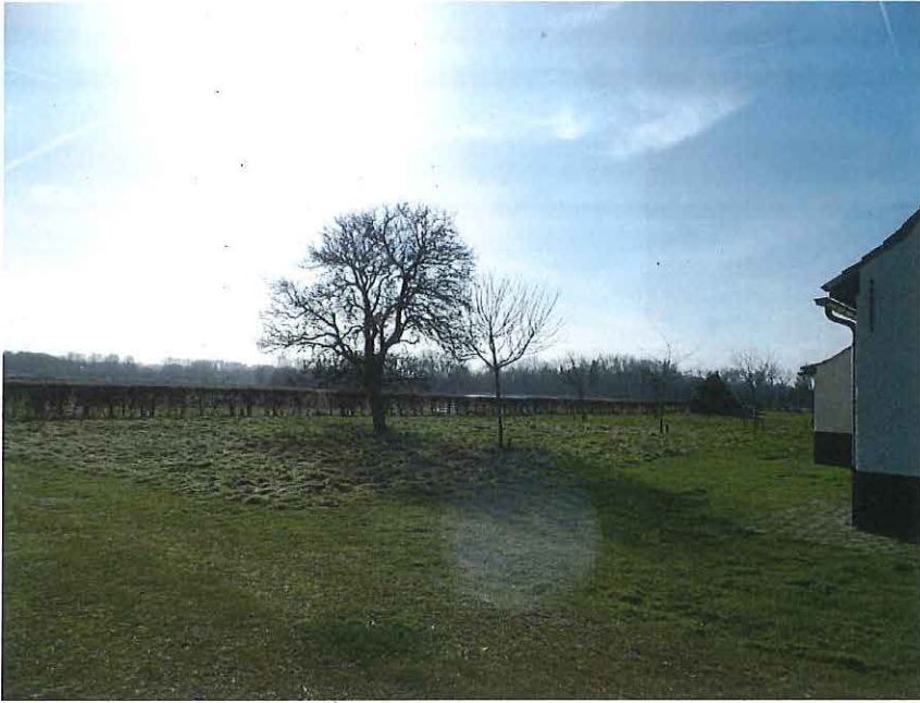
Foto 13: De Valkenhuishoeve: hoogstamboomgaard en mei- en sleedoornhaag.