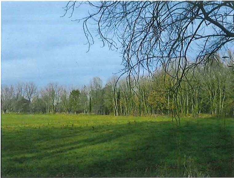
Foto 20: Zicht op de voormalige zone met weekendverblijven vanaf de Bunderweg.