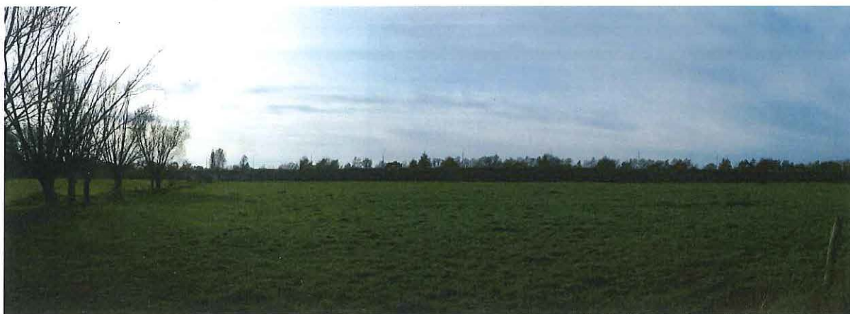
Foto 1: Panoramisch zicht op de Vliegpleinkouter vanaf de Driesdreef.