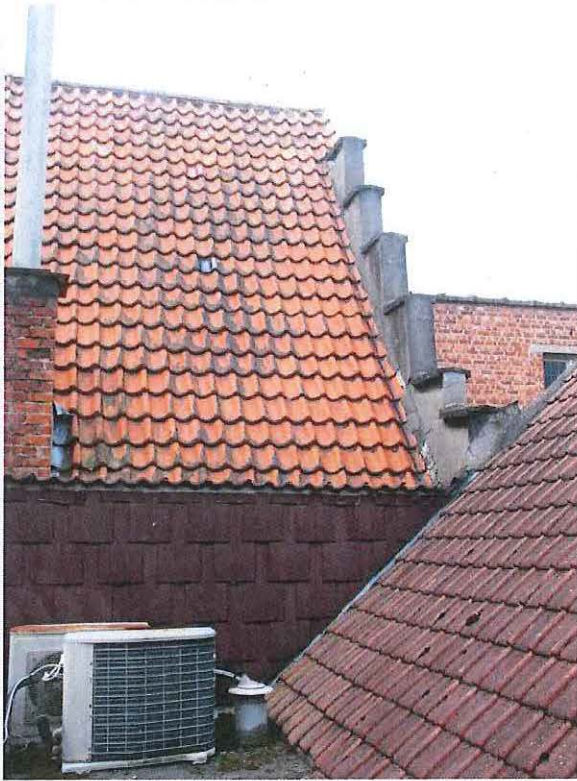
Foto 4: zicht op de oostelijke langsmuur en trapgevel van het huis De Croone.