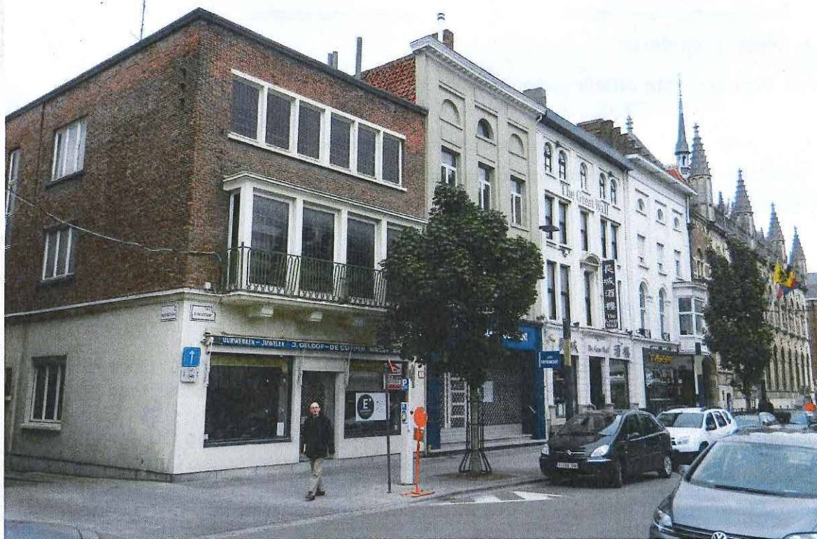
Foto 1: de noordelijke gevelrij van de Rijkssestraat. Van links naar rechts: Rijkssestraat 8, 6, 4, 2 en het stadhuis.