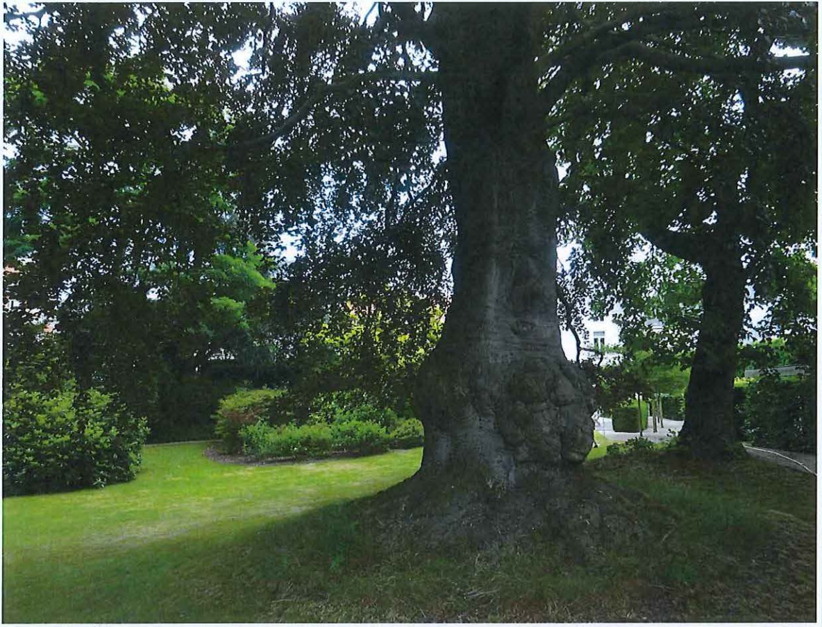
Foto 4: algemeen zicht op stadstuin met geënte bruine beuk en tulpenboom