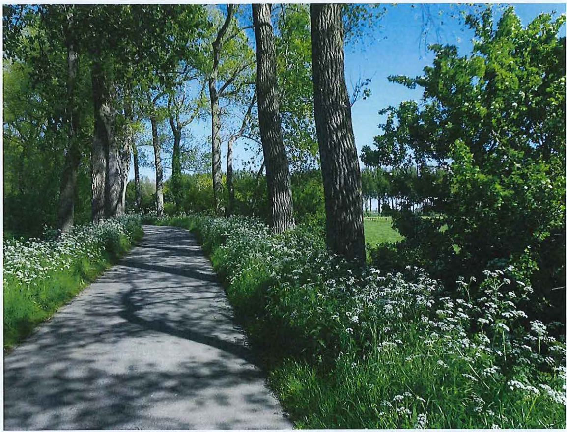
Foto 4: Opgaande populierenrijen en doornstruweel langsheen de Krinkeldijk