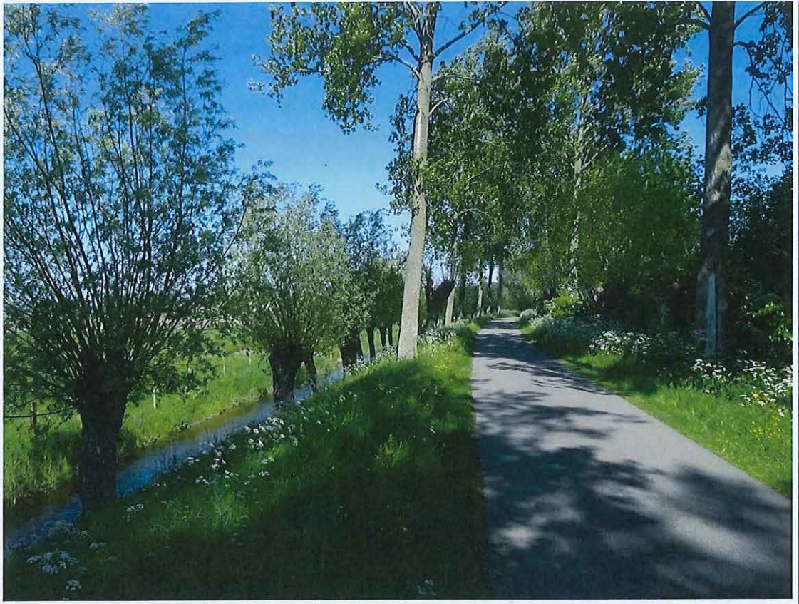
Foto 3: Knotbomen en opgaande populierenrijen langsheen de Krinkeldijk