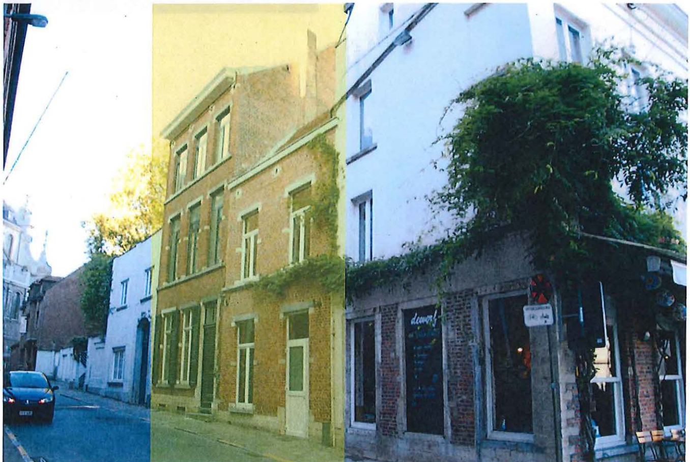
Foto 23: Sint-Michielsstraat 13-15: overgangszone (geel gemarkeerd) tussen het stadsgezicht Hogeschoolplein (rechts) en het als monument beschermde Sint Annacollege (links)