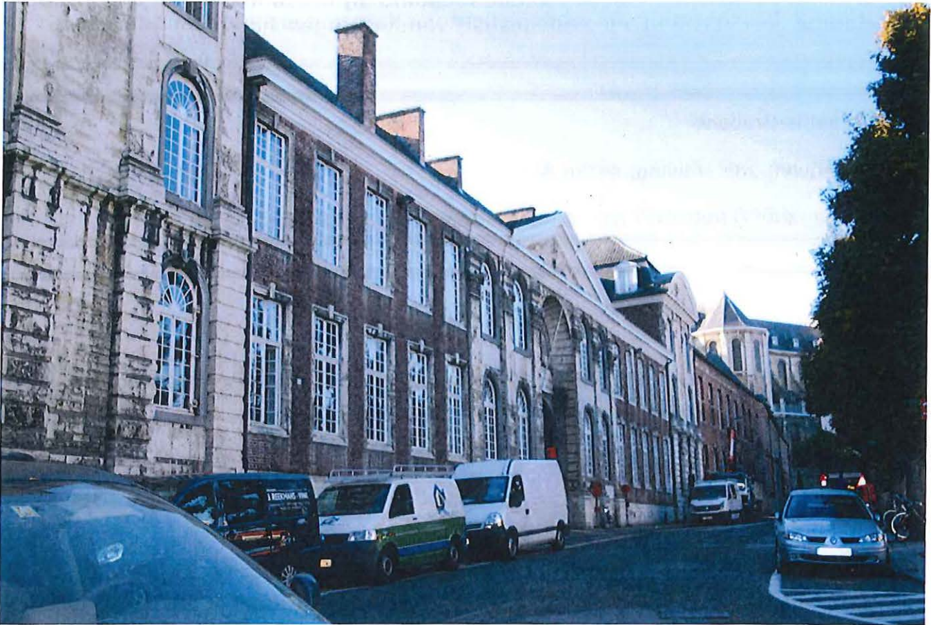
Foto 1: Hogeschoolplein, zicht op de zuidoostelijke pleinwand met het Paus- en Maria-Theresiacollege