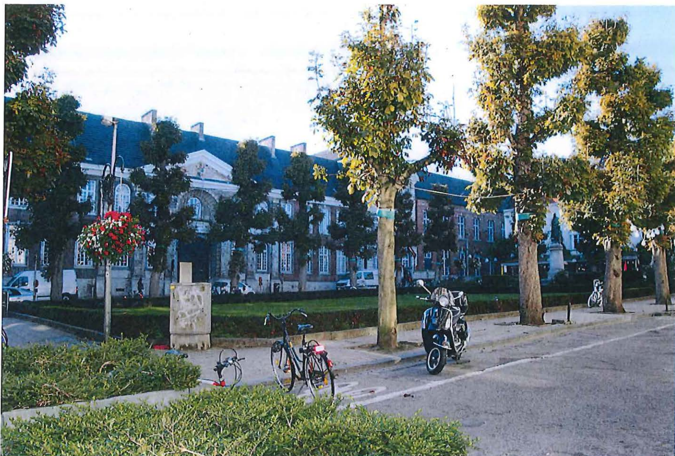
Foto 5: Hogeschoolplein, zicht op het centrale grasplein met omzomende bomenrij en standbeeld van André Dumont