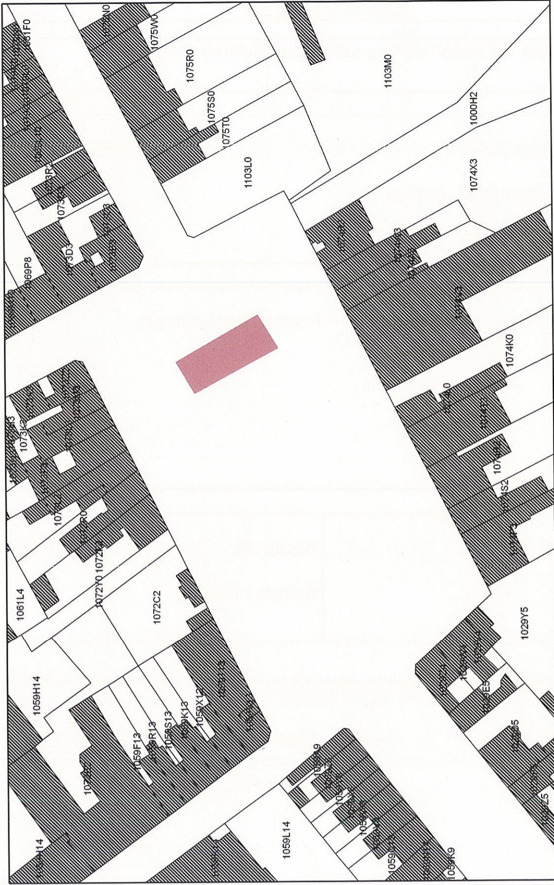
Afbakening ingetekend op plan met als achtergrond kadastrale kaart kadvec toestand 1/1/2005 0 12,5 25 50 Meters