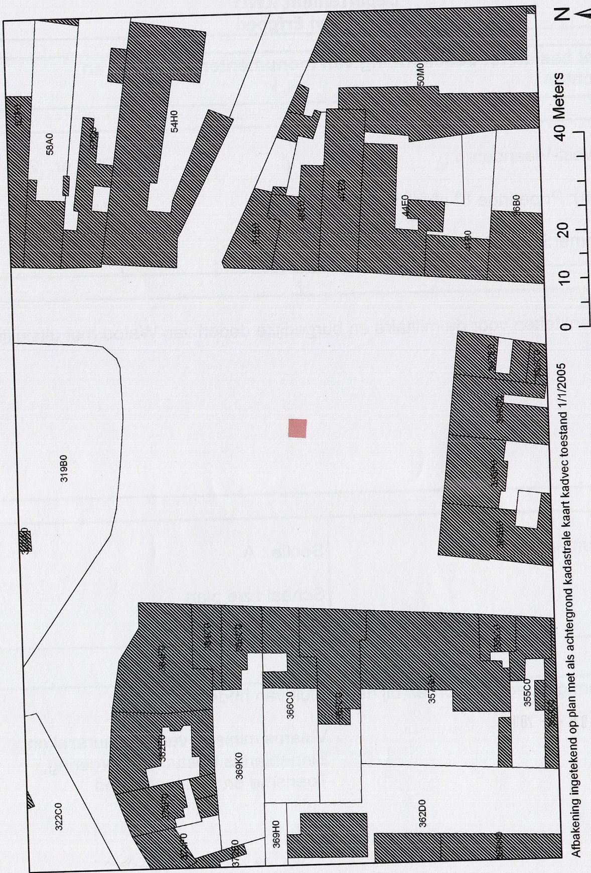
Afbakening ingetekend op plan met als achtergrond kadastrale kaart kadvec toestand 1/1/2005