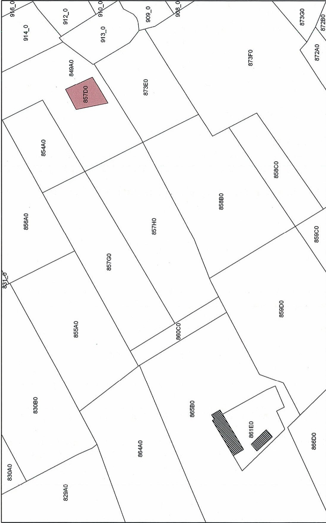
Afbakening ingetekend op plan met als achtergrond kadastrale kaart kadvec toestand 1/1/2005