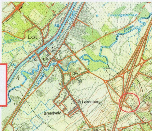
Situering (rood omcirkeld)

Afbakening van het beschermd monument (zie keerzijde)