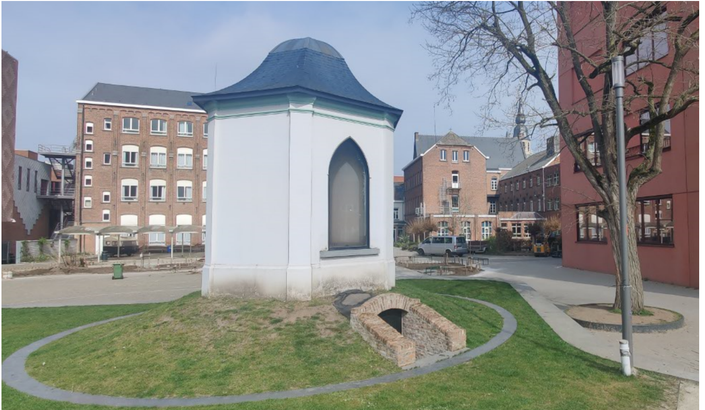
Foto 3: zicht op het tuinpaviljoen met kelder in de nieuw aangelegde tuin: ingang van de kelderruimte.