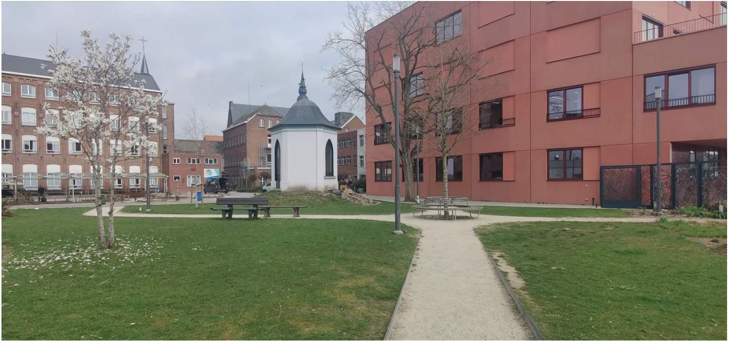
Foto 1: zicht op het tuinpaviljoen met kelder in de nieuw aangelegde tuin.