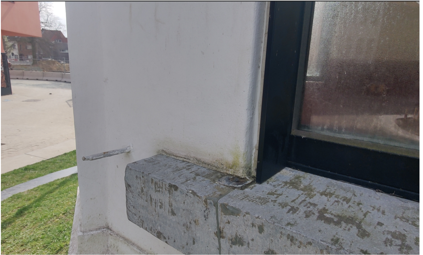
Foto 7: tuinpaviljoen: detail van lekdrempel venster: sporen van voormalige luiken.