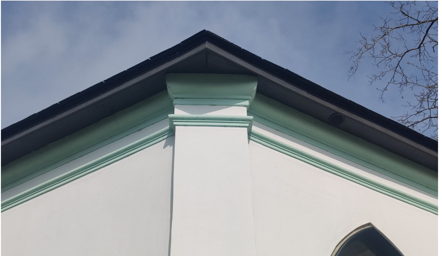
Foto 5: tuinpaviljoen: detail van bepleisterde buitengevel met pilastermotief en lijstwerk.