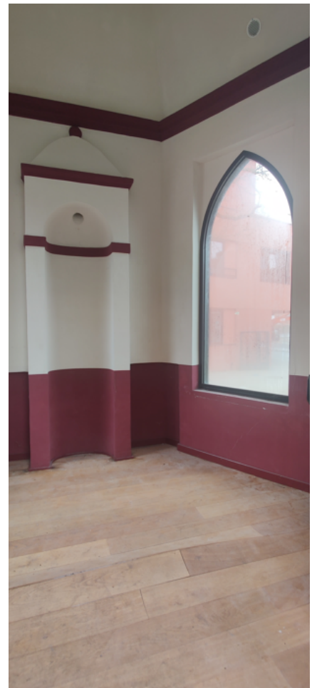
Foto 9-10-11: tuinpaviljoen: wit bepleisterd interieur met donkerrode accenten, centraal een uitspringende concave nis en houten vloer.