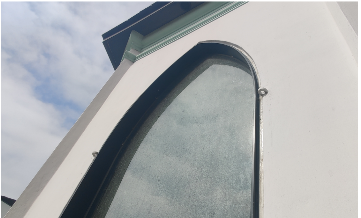
Foto 6: tuinpaviljoen: detail van bepleisterde buitengevel: venster met stalen schrijnwerk en nieuwe beglazing.