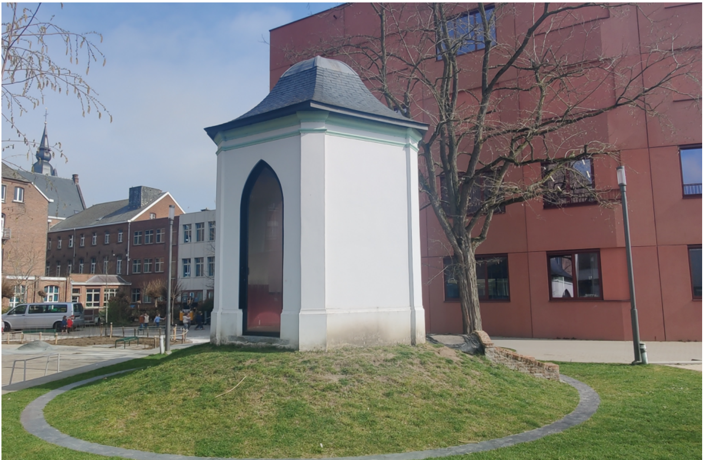
Foto 4: zicht op het tuinpaviljoen met kelder in de nieuw aangelegde tuin: ingang van het tuinpaviljoen.