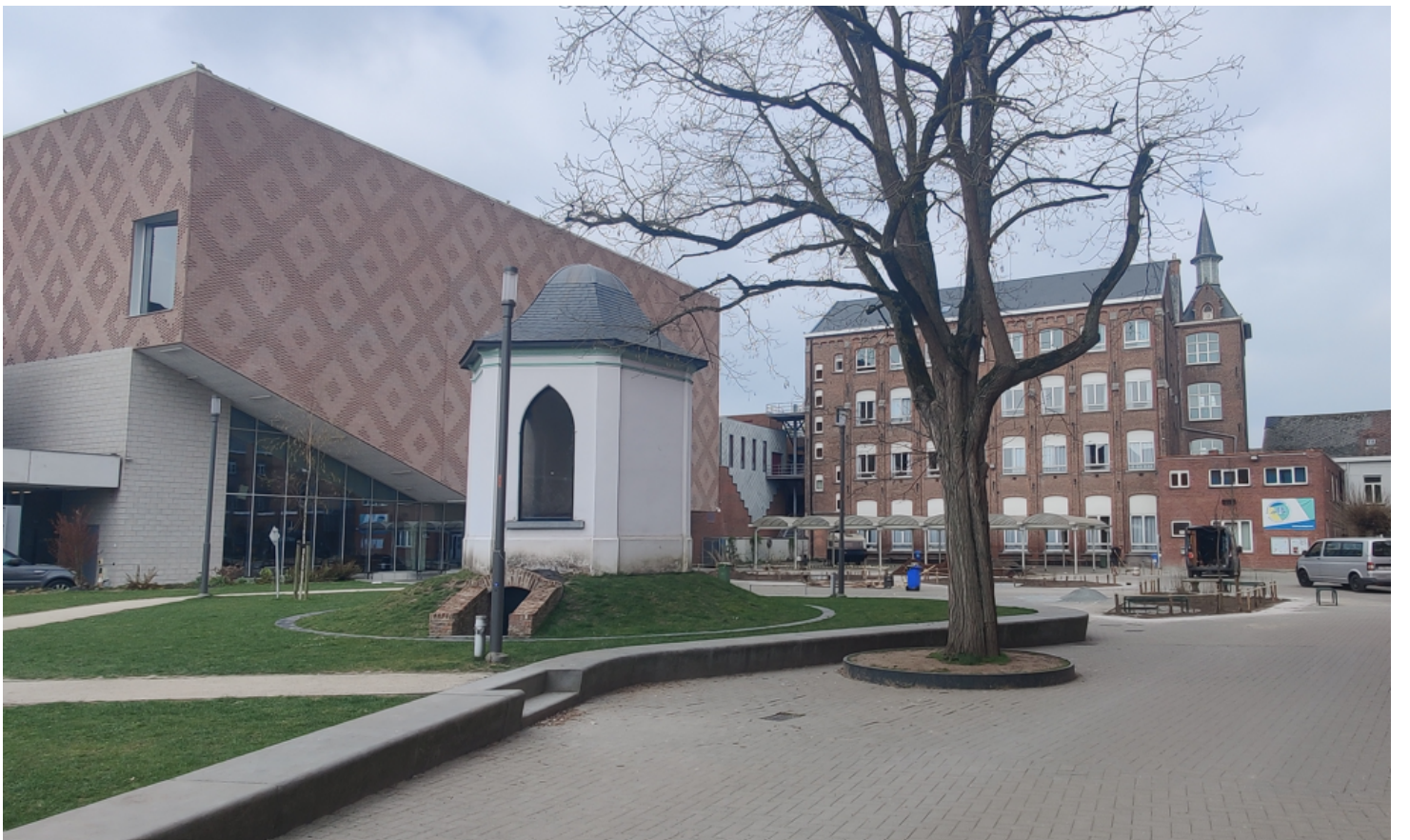
Foto 2: zicht op het tuinpaviljoen met kelder in de nieuw aangelegde tuin.