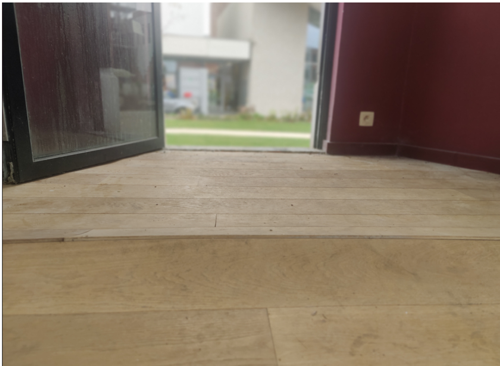
Foto 12-13-14: tuinpaviljoen: interieur: details van koepelgewelf, barsten in bepleistering en schade aan eiken vloer.