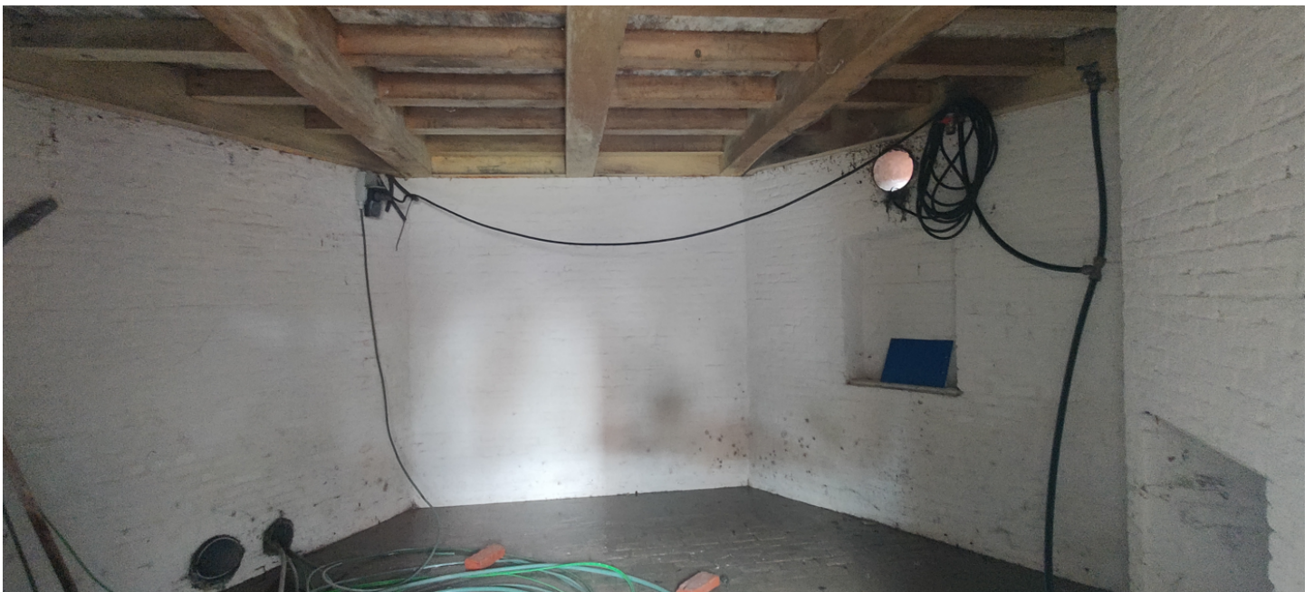
Foto 17: kelder met bakstenen wanden en dito vloer, haardelement en nis.