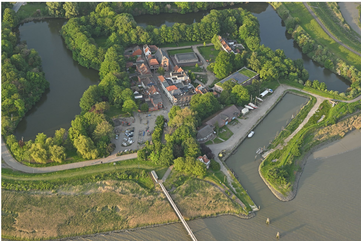
Figuur 4. Fotoregistratie van de fysieke toestand van het beschermd goed: Lillo-Fort met getijdehaven.

De bestaande feitelijke toestand is weergegeven op bijgevoegde foto's.