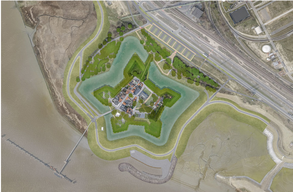
Figuur 8. Plan voor de nieuwe te realiseren toestand met herstel van vijfhoekig bastion en vestigingsstructuur, getijdehaven verplaatst naar buiten de vestigingsstructuur.