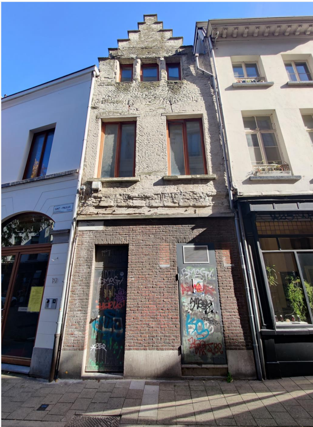
Foto 2: Straatgevel met beschermde bovengevel (voorgevel) en bedaking