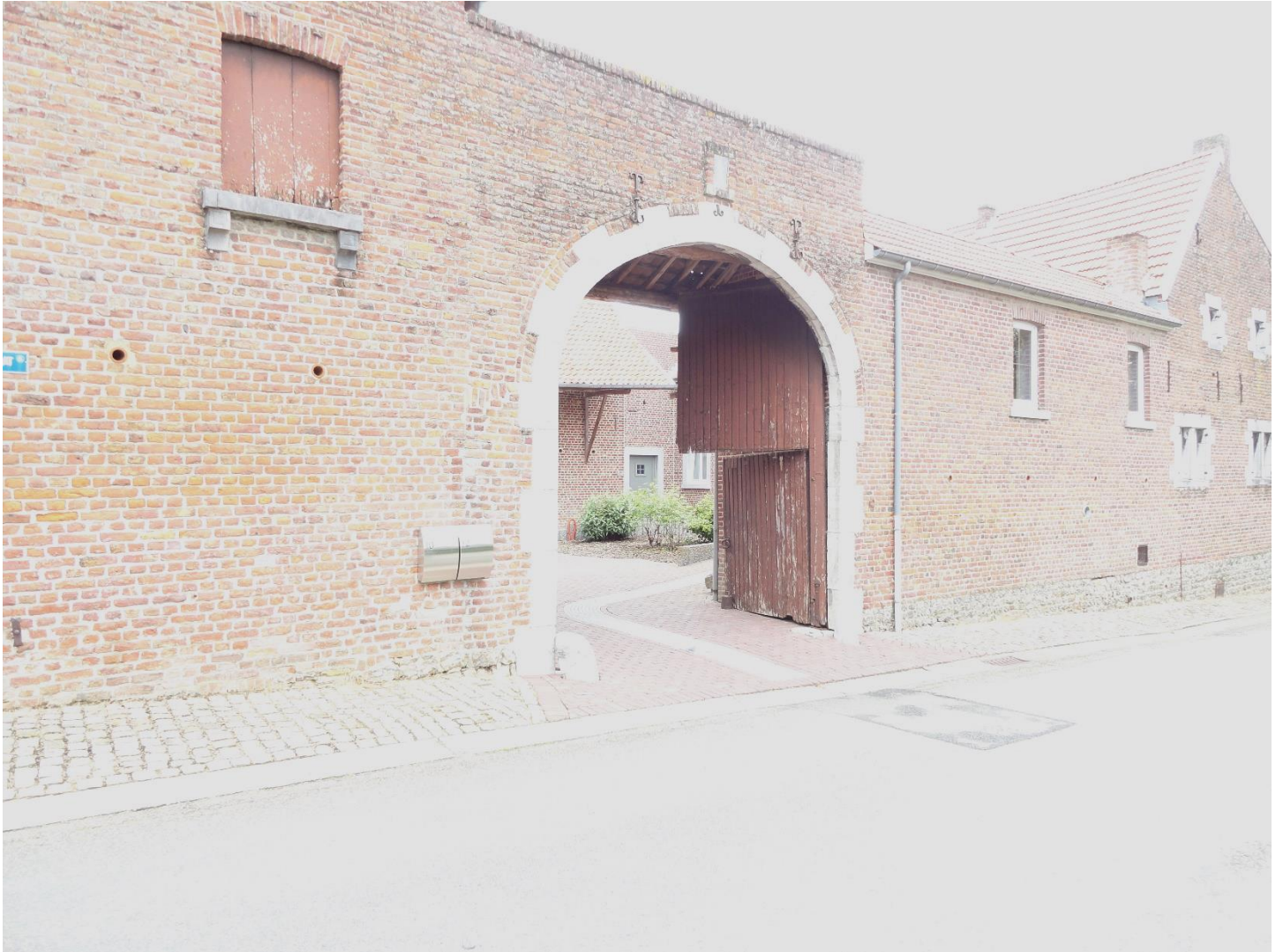
Foto 2: Proenhofstraat 10 en 12: de toegangspoort van de gesloten hoeve (11 mei 2023)