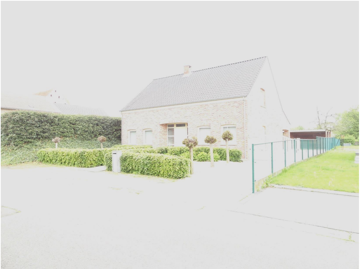
Foto 4: Proenhofstraat 26, het huis aan de oostzijde van de gesloten hoeve. Op de achtergrond is een deel van de gesloten hoeve te zien (11 mei 2023).