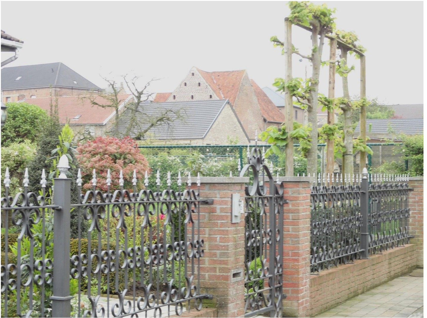
Foto 5: Here Janssteeg, zicht op de gesloten hoeve. Links is het dak van de gemeenteschool te zien (11 mei 2023).