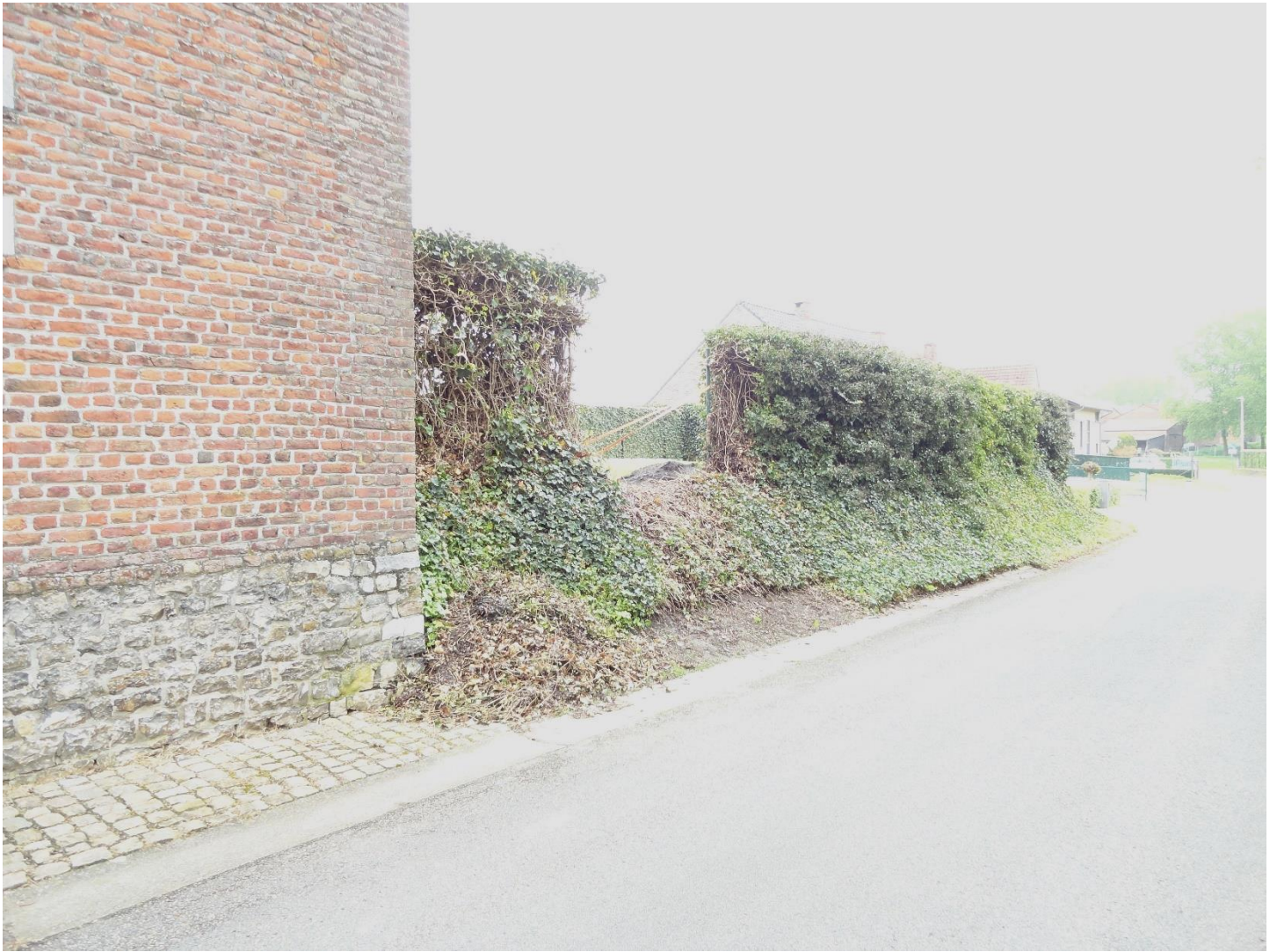
Foto 3: Proenhofstraat: het perceel rechts van de gesloten hoeve. In de klimophaag is een opening gemaakt om een toegangspoort te plaatsen (11 mei 2023)