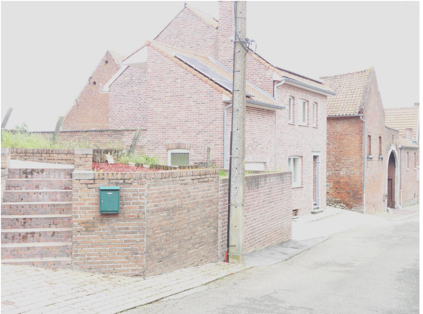
Foto 1: Proenhofstraat 8, het huis aan de westzijde van de gesloten hoeve (11 mei 2023)