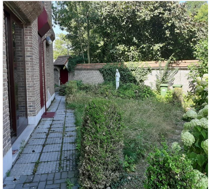
Foto 8: Achterliggend tuintje ter hoogte van Grauwe Torenwal 9 en deel van het binnengebied dat binnen de bescherming als monument blijft.