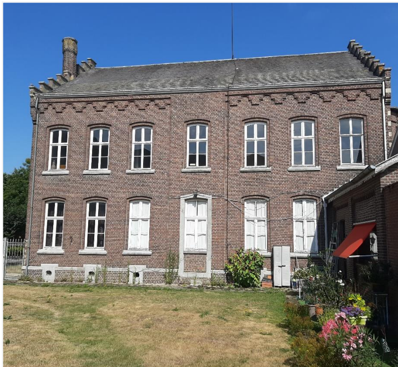
Foto 12: Binnengebied ten noorden van de nieuwbouw van 2015-2016 met grasveld en achtergevel van de Dekenij die binnen de afbakening van de bescherming als monument blijven. Via hekje aan linkerzijde van de dekenij heeft men toegang tot de rest van de als monument beschermde tuin (nu gekend als 'Hof van de Deken').