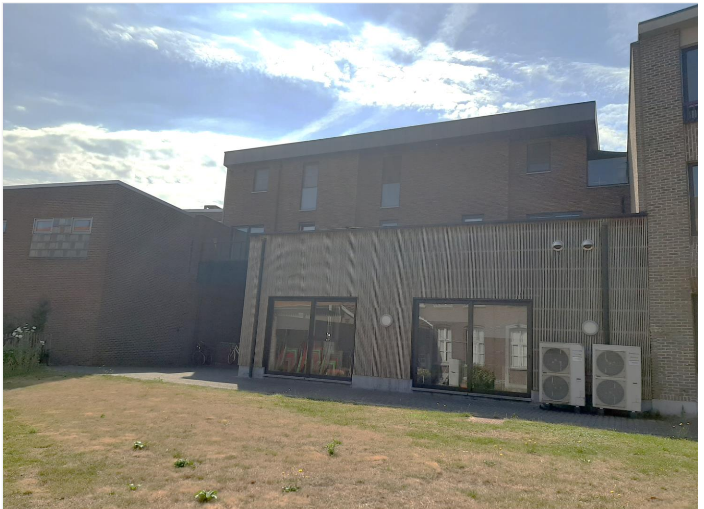
Foto 6: Achterzijde van de nieuwbouw die in 2015-2016 gerealiseerd werd op een deel van de vroegere tuin van het refugiehuis.