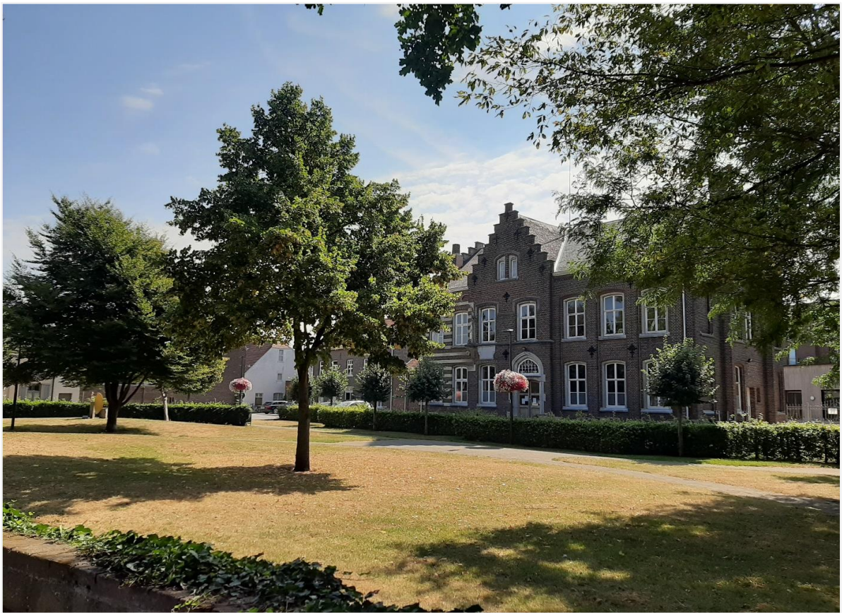
Foto 15: Voorgevel van de dekenij gelegen in de vroegere tuin van het refugiehuis van Postel, nu gekend als 'Hof van de Deken', in binnengebied ten noorden van de nieuwbouw van 2015-2016. Blijft beschermd als monument.