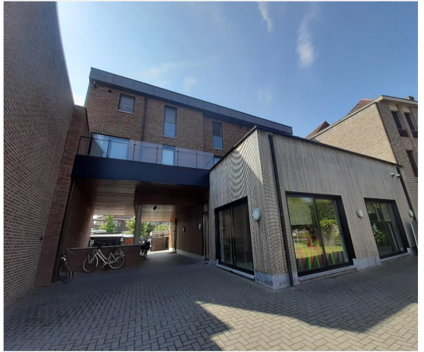
Foto 5: Achterzijde van de nieuwbouw die in 2015-2016 gerealiseerd werd op een deel van de vroegere tuin van het refugiehuis.