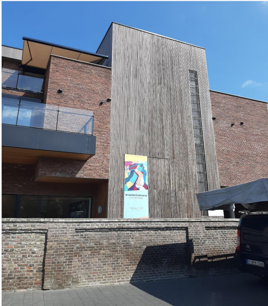
Foto 1: Voorzijde nieuwbouw die in 2015-2016 opgetrokken werd op een deel van de vroegere tuin van het refugiehuis. Een deel van de vroegere tuinmuur met lisenen werd geïncorporeerd in het ontwerp. Zijde Grauwe Torenwal 9A.