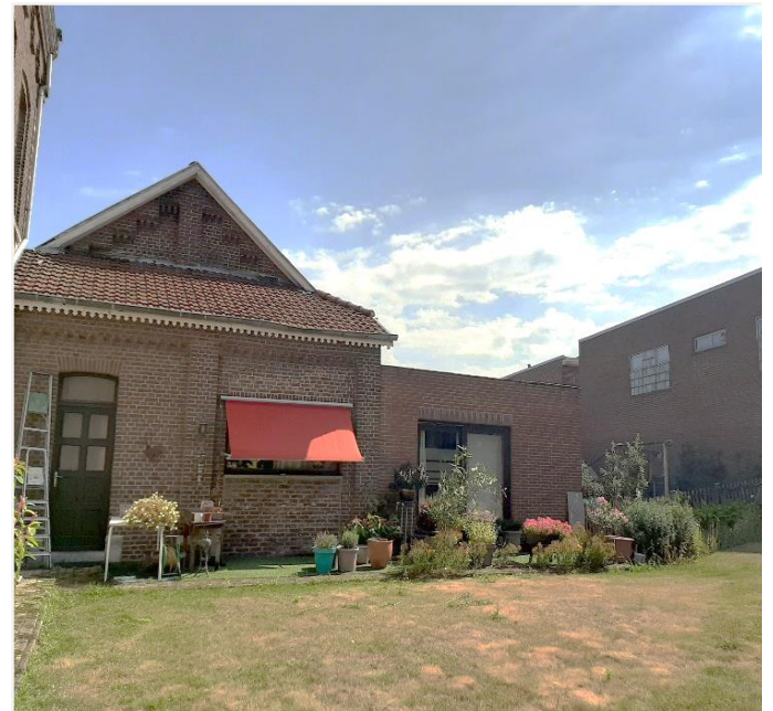
Foto 10: Binnengebied ten noorden van de nieuwbouw van 2015-2016 met grasveld en dekenij die binnen de afbakening van de bescherming als monument blijven.