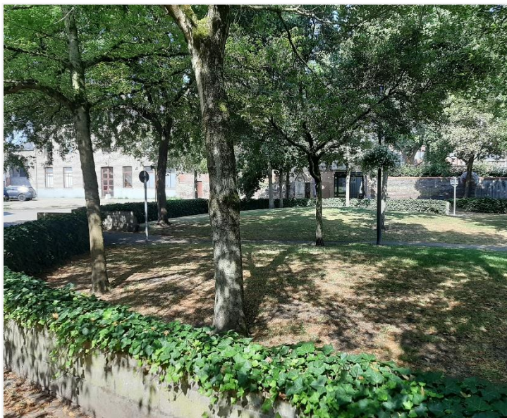
Foto 13: Vroegere tuin van het refugiehuis van Postel, nu gekend als 'Hof van de Deken', in binnengebied ten noorden van de nieuwbouw van 2015-2016. Blijft beschermd als monument.