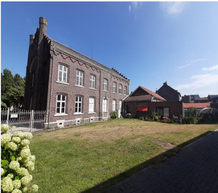
Foto 9: Binnengebied ten noorden van de nieuwbouw van 2015-2016 met grasveld en dekenij die binnen de afbakening van de bescherming als monument blijven.