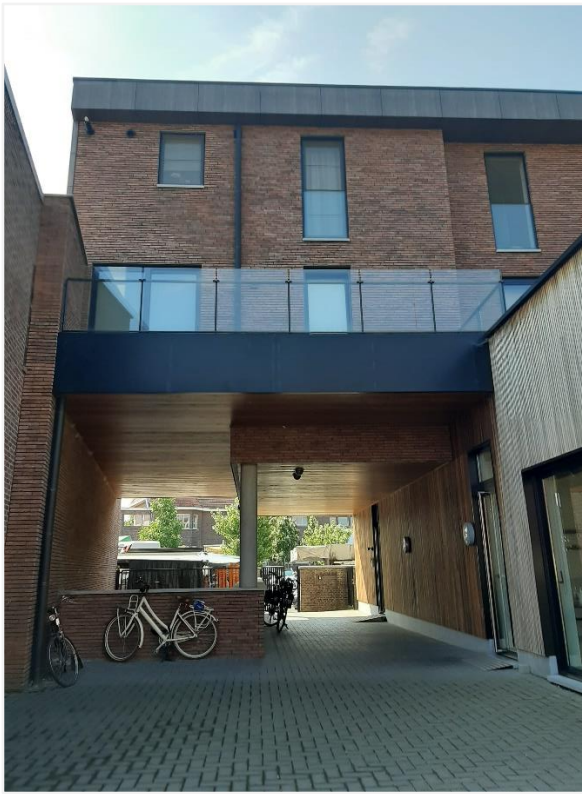
Foto 4: Achterzijde van de nieuwbouw die in 2015-2016 gerealiseerd werd op een deel van de vroegere tuin van het refugiehuis.