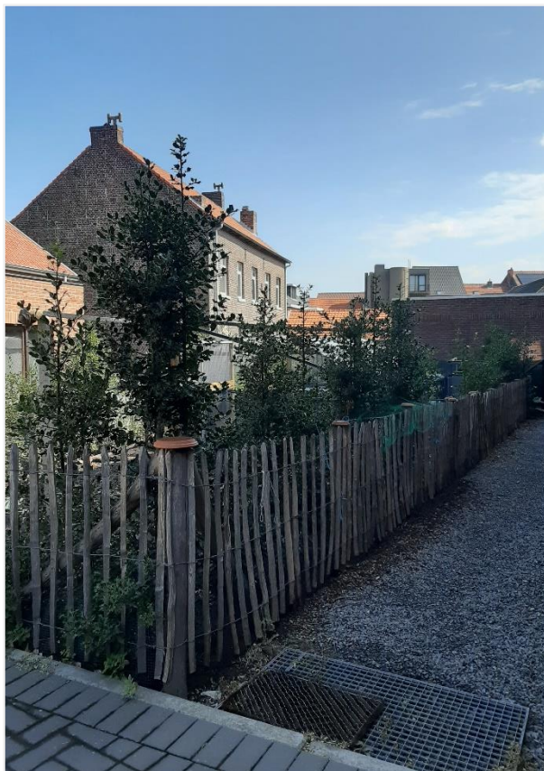
Foto 11: Binnengebied ten noorden van de nieuwbouw van 2015-2016, met kapelanie (hoog gebouw, Vaesstraat 4) dat binnen de afbakening van de bescherming als monument blijft.