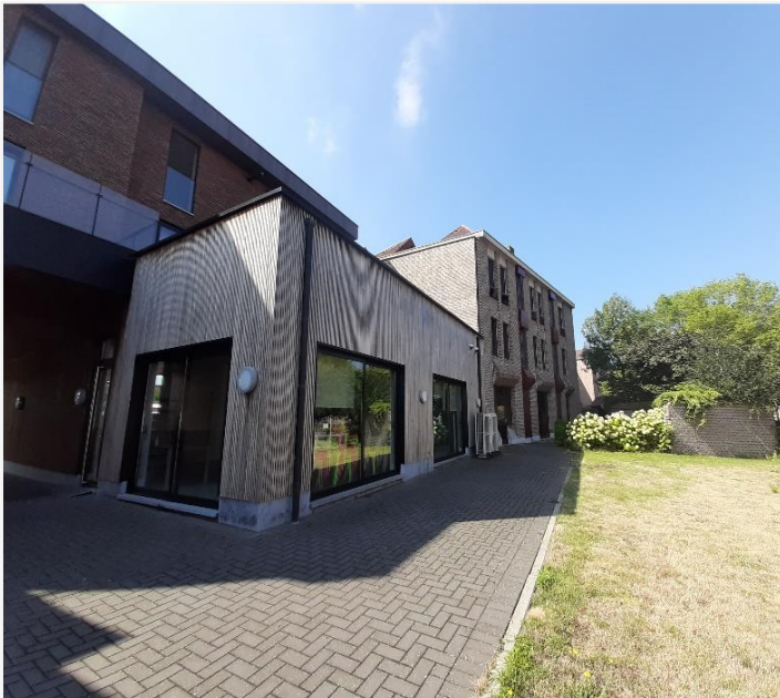
Foto 7: Achterzijde van de nieuwbouw die in 2015-2016 gerealiseerd werd op een deel van de vroegere tuin van het refugiehuis. Rechts daarvan achtergevel van Grauwe Torenwal 9. Grasveld en achterliggend tuintje hoort tot het binnengebied en blijft binnen de afbakening van de bescherming als monument.