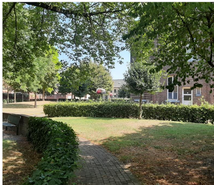
Foto 14: Vroegere tuin van het refugiehuis van Postel, nu gekend als 'Hof van de Deken', in binnengebied ten noorden van de nieuwbouw van 2015-2016. Blijft beschermd als monument.