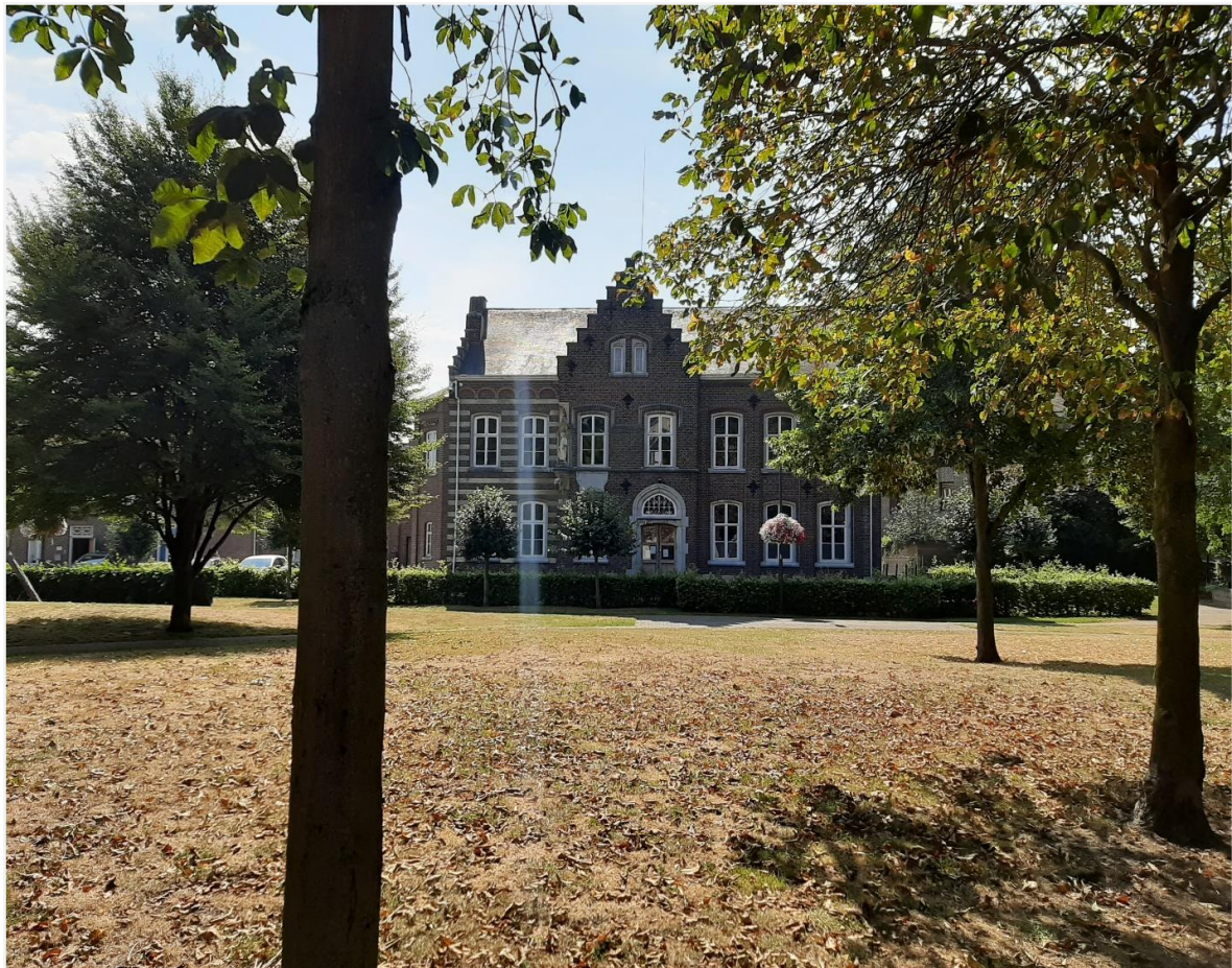
Foto 16: Voorgevel van de dekenij gelegen in de vroegere tuin van het refugiehuis van Postel, nu gekend als 'Hof van de Deken', in binnengebied ten noorden van de nieuwbouw van 2015-2016. Blijft beschermd als monument