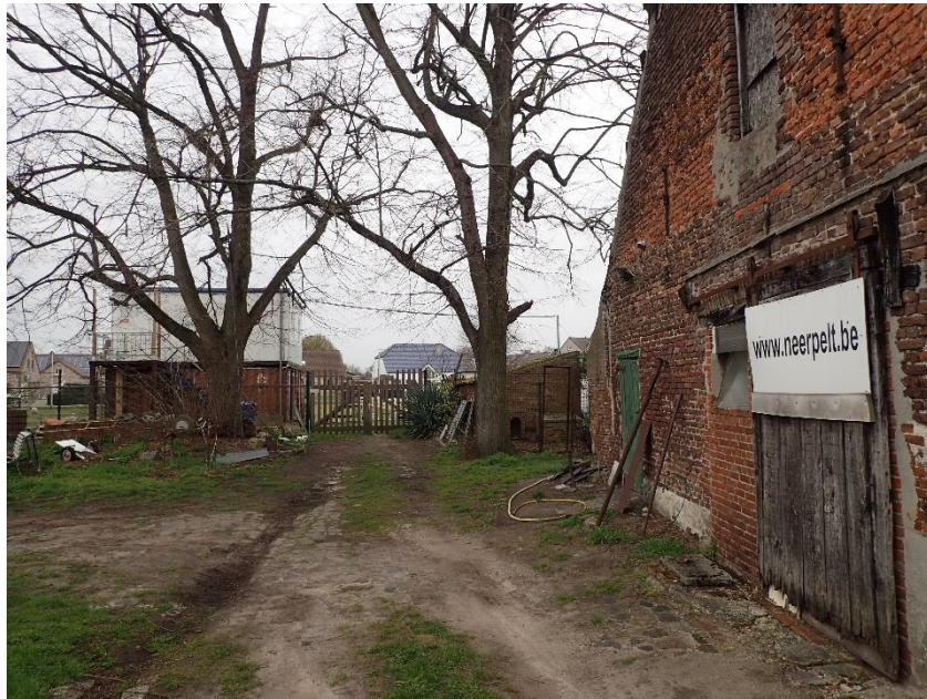
Foto 11: Standplaats van de opgaande schermlindes bij Hoeve Spooren, gezien vanuit het oosten (6 april 2023).