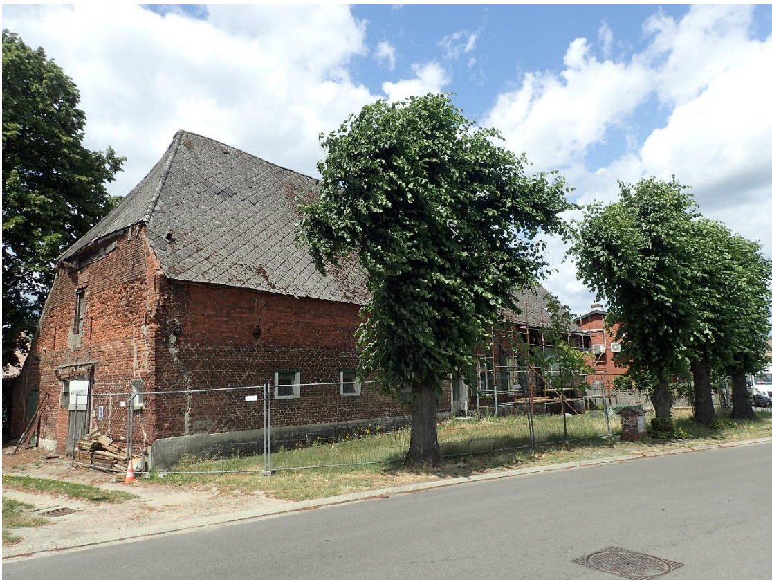
Foto 8: Gekandelaarde scherm lindes bij Hoeve Spooren, gezien vanuit het zuiden (5 juli 2023).