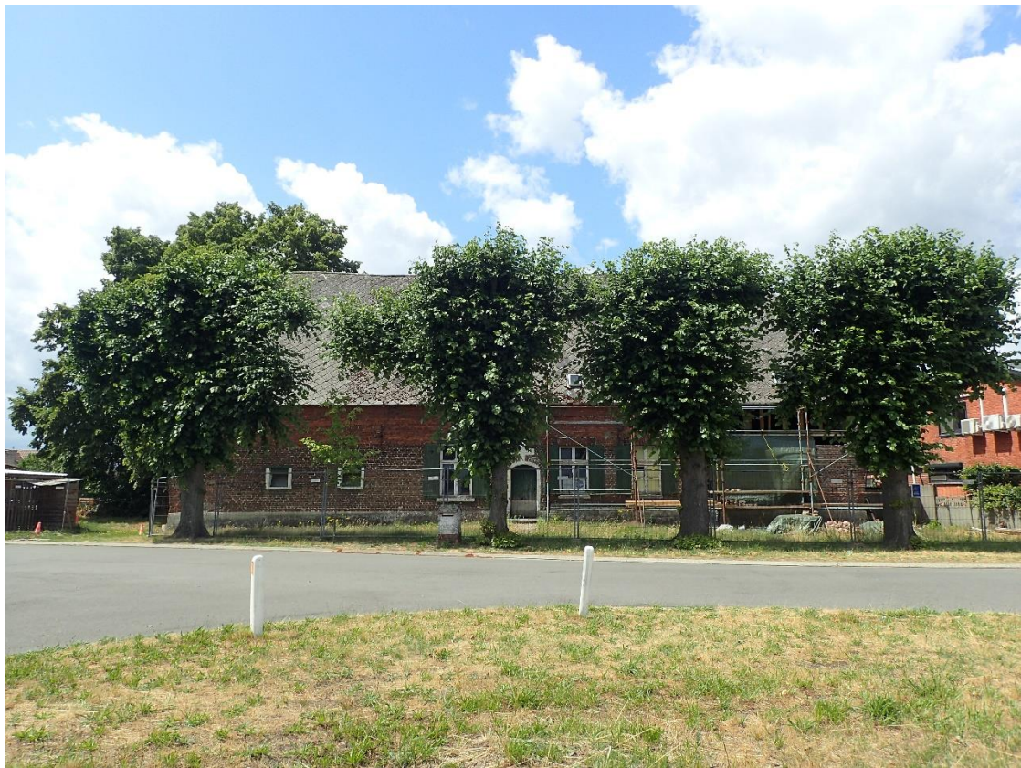
Foto 5: Gekandelaarde schermlindes bij Hoeve Spooren, gezien vanuit het oosten (5 juli 2023).