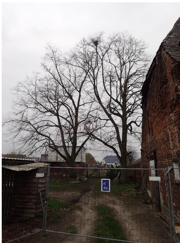
Foto 9: Opgaande schermlindes bij Hoeve Spooren, gezien vanuit het oosten (6 april 2023).