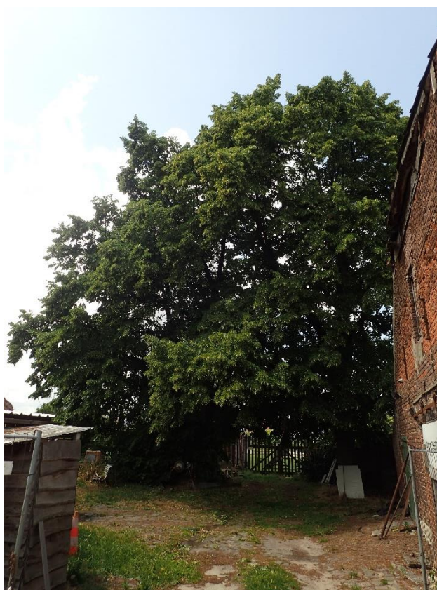
Foto 10: Opgaande schermlindes bij Hoeve Spooren, gezien vanuit het oosten (5 juli 2023).