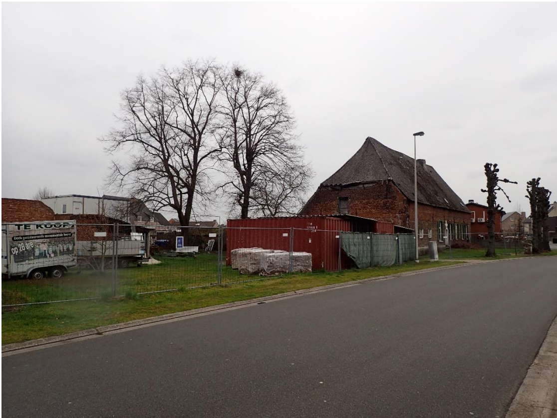
Foto 2: Vier gekandelaarde schermlindes en twee opgaande schermlindes bij Hoeve Spooren, gezien vanuit het zuiden (6 april 2023).