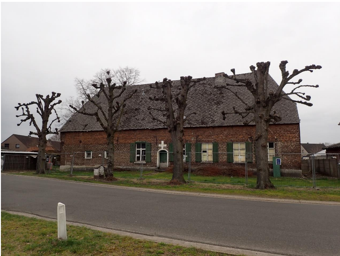
Foto 4: Gekandelaarde schermlindes bij Hoeve Spooren, gezien vanuit het oosten (6 april 2023).