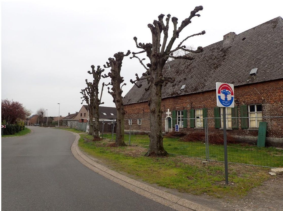
Foto 6: Gekandelaarde schermlindes bij Hoeve Spooren, gezien vanuit het noorden (6 april 2023).