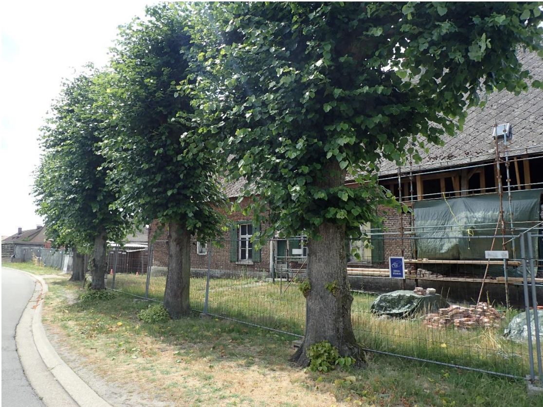
Foto 7: Gekandelaarde scherm lindes bij Hoeve Spooren, gezien vanuit het noorden (5 juli 2023).