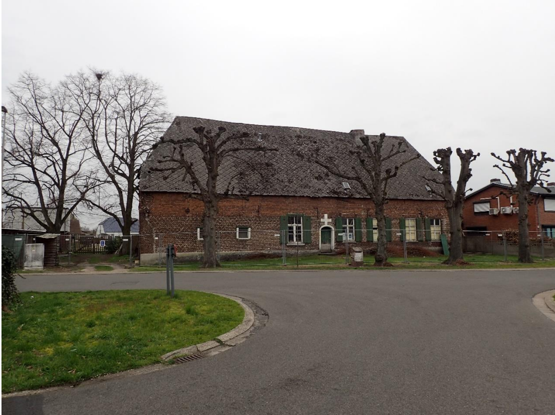
Foto 1: Vier gekandelaarde schermlindes en twee opgaande schermlindes bij Hoeve Spooren, gezien vanuit het oosten (6 april 2023).