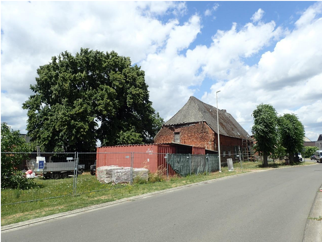
Foto 3: Vier gekandelaarde schermlindes en twee opgaande schermlindes bij Hoeve Spooren, gezien vanuit het zuiden (5 juli 2023).