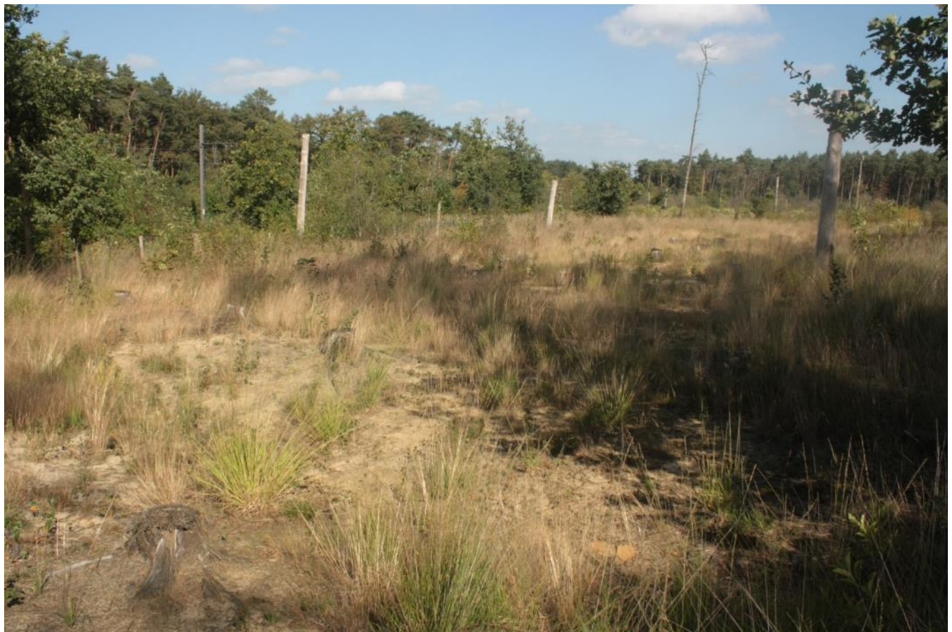
Figuur 4 – Zicht op het afgeplagde terrein op 19-09-2018