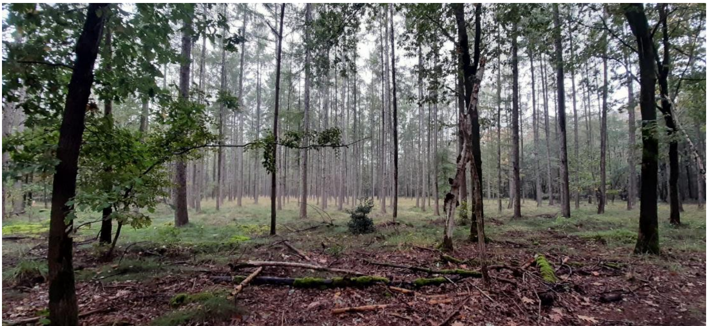
Figuur 4 – Zicht op het bosgebied van Ophovenerheide