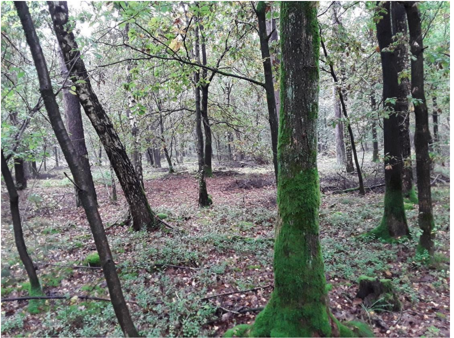
Figuur 7 – Zicht op het bosgebied van Ophovenerheide, plaatselijk is het microreliëf van de Celtic Field wallen zichtbaar