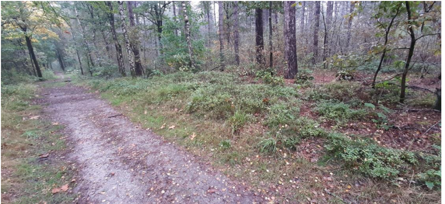
Figuur 3 – Waar de paden de wallen dwarsen is het profiel van de Celtic Field wallen soms duidelijk zichtbaar