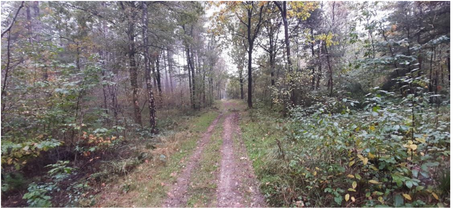
Figuur 5 – Zicht op het bosgebied van Ophovenerheide vanop een van de paden in het zuidelijke gedeelte