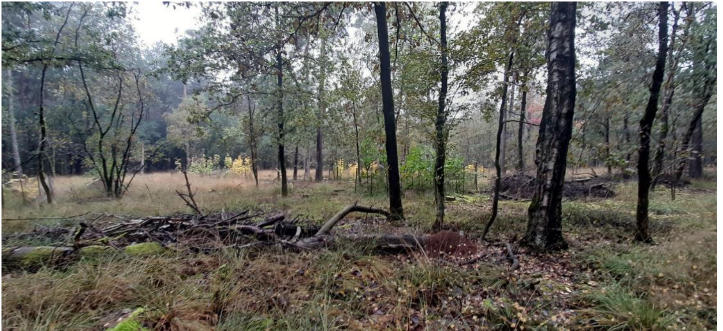
Figuur 6 – Zicht op het bosgebied van Ophovenerheide met halfopen zones en nieuwe bosaanplant