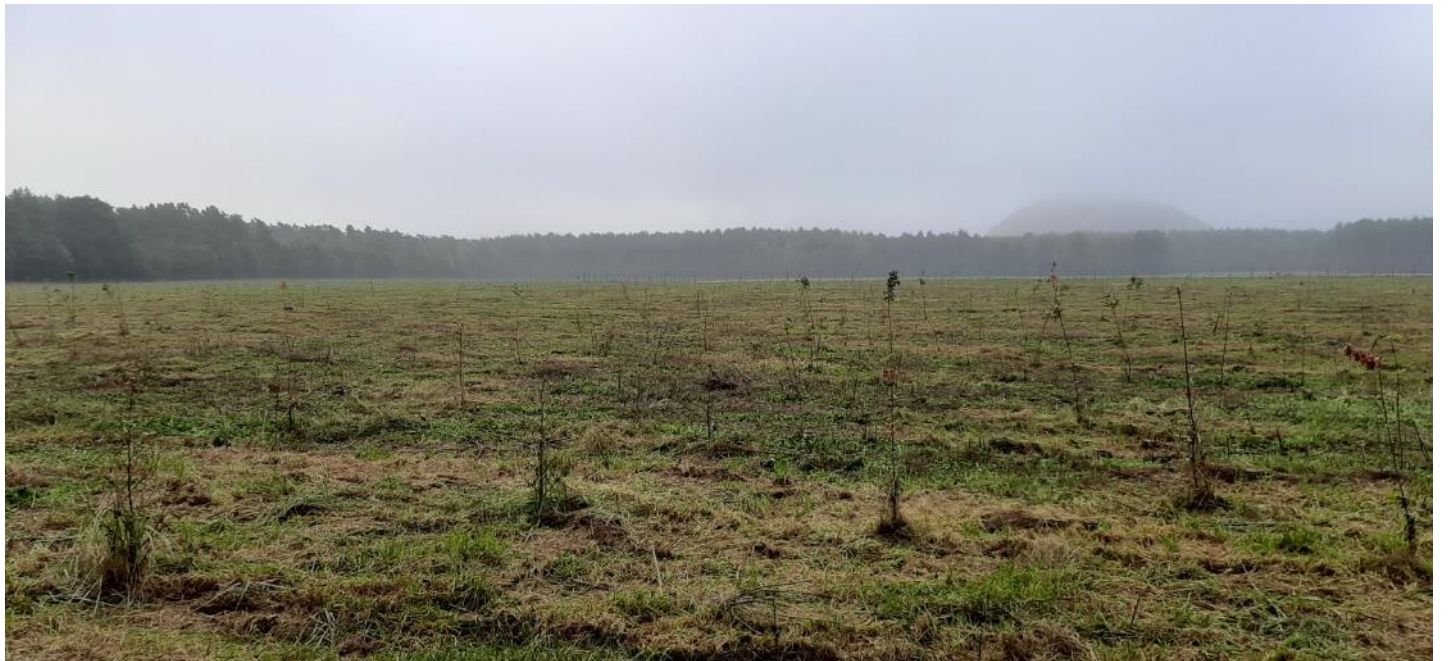
Figuur 4 – Zicht op de westelijke percelen die momenteel in bos worden omgezet