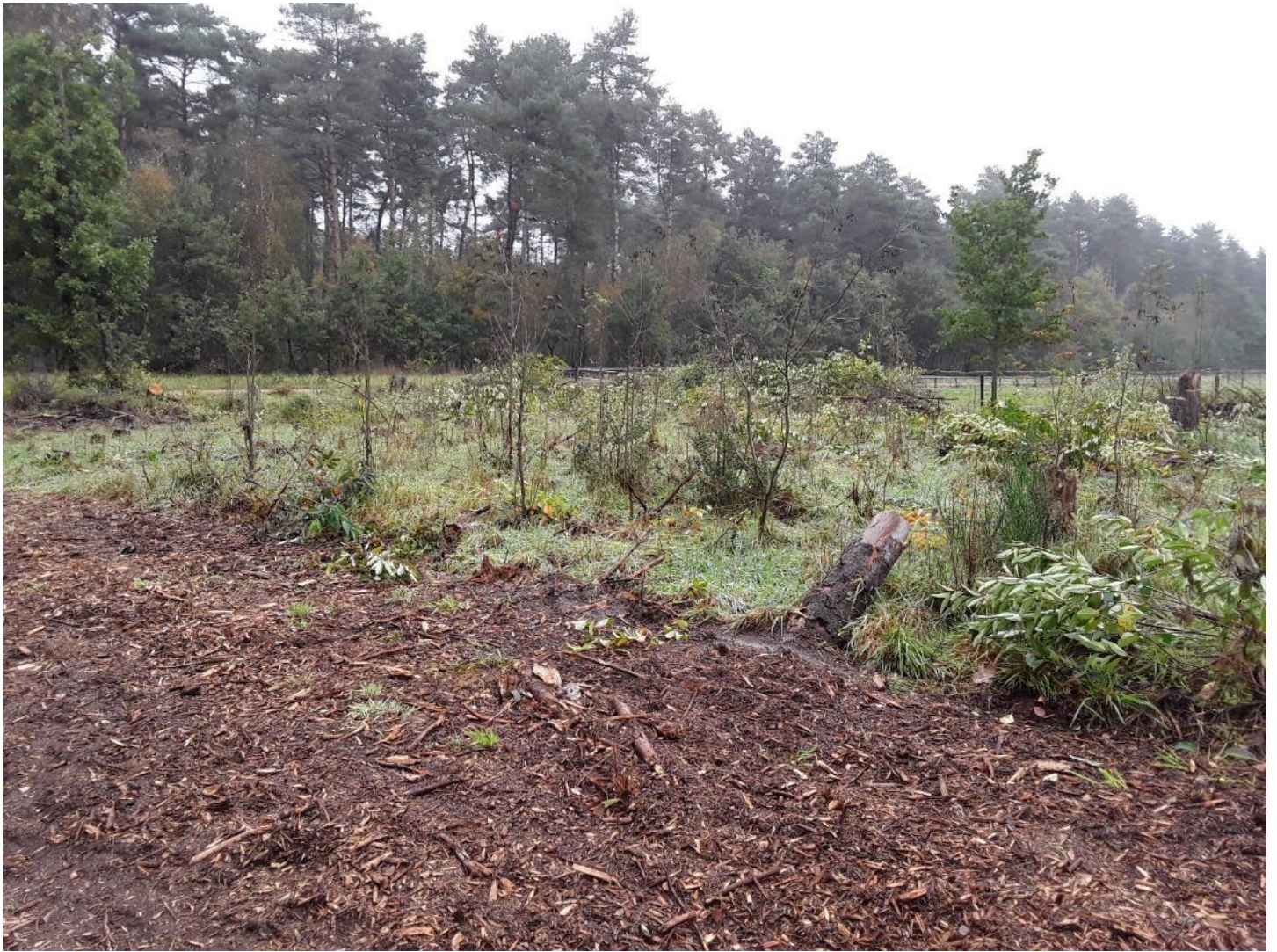
Figuur 8 – Zicht op de grafheuvel op percelen 903/M4 en N4. De grafheuvel wordt gespaard van nieuwe bosaanplant