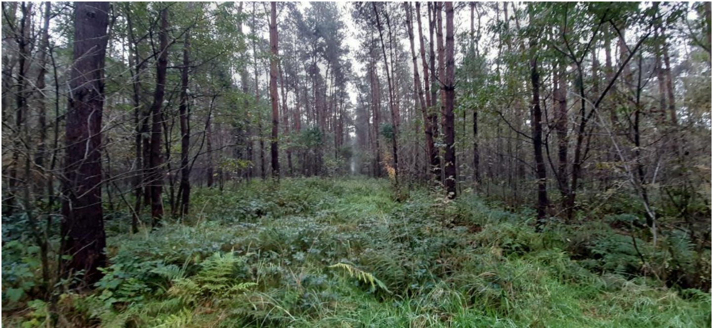
Figuur 5 – Zicht op één van de gefreesde ontginningsstroken van 2019