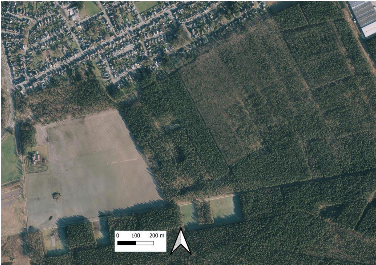
Figuur 1 – Het gebied op de meest recente orthofoto- middenschalig- winteropnamen