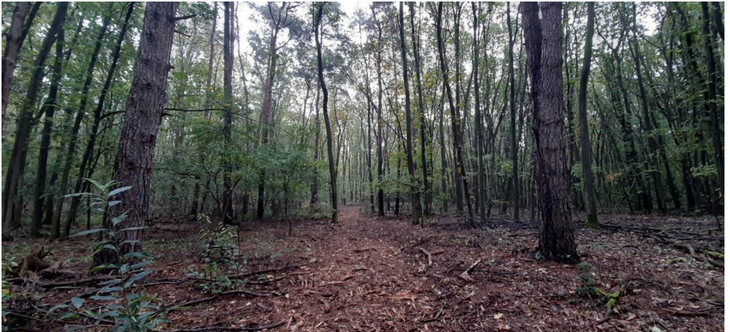
Figuur 6 – Zicht op het bosgebied van Moorsberg