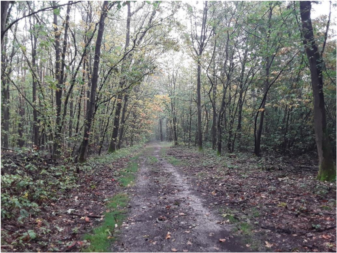
Figuur 7 – Zicht op het bosgebied van Moorsberg vanop één van de paden