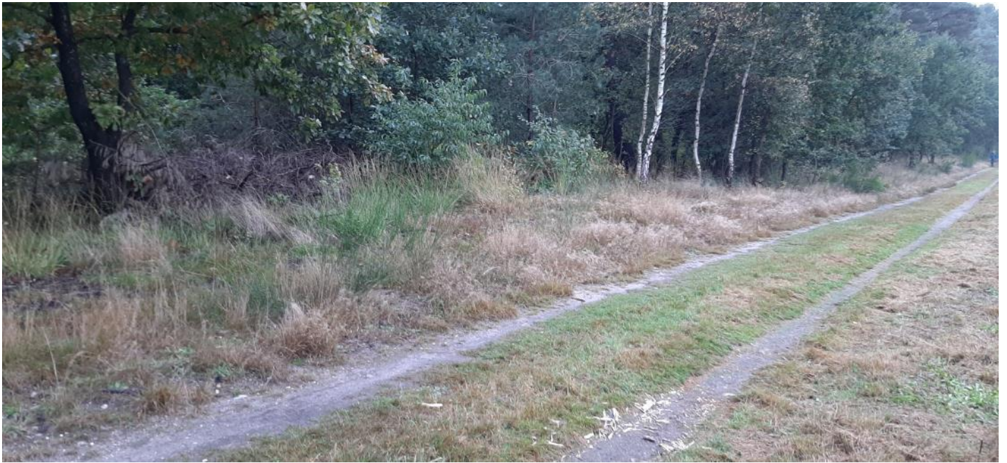
Figuur 3 – Waar de paden de wallen dwarsen is het profiel van de Celtic Field wallen soms duidelijk zichtbaar