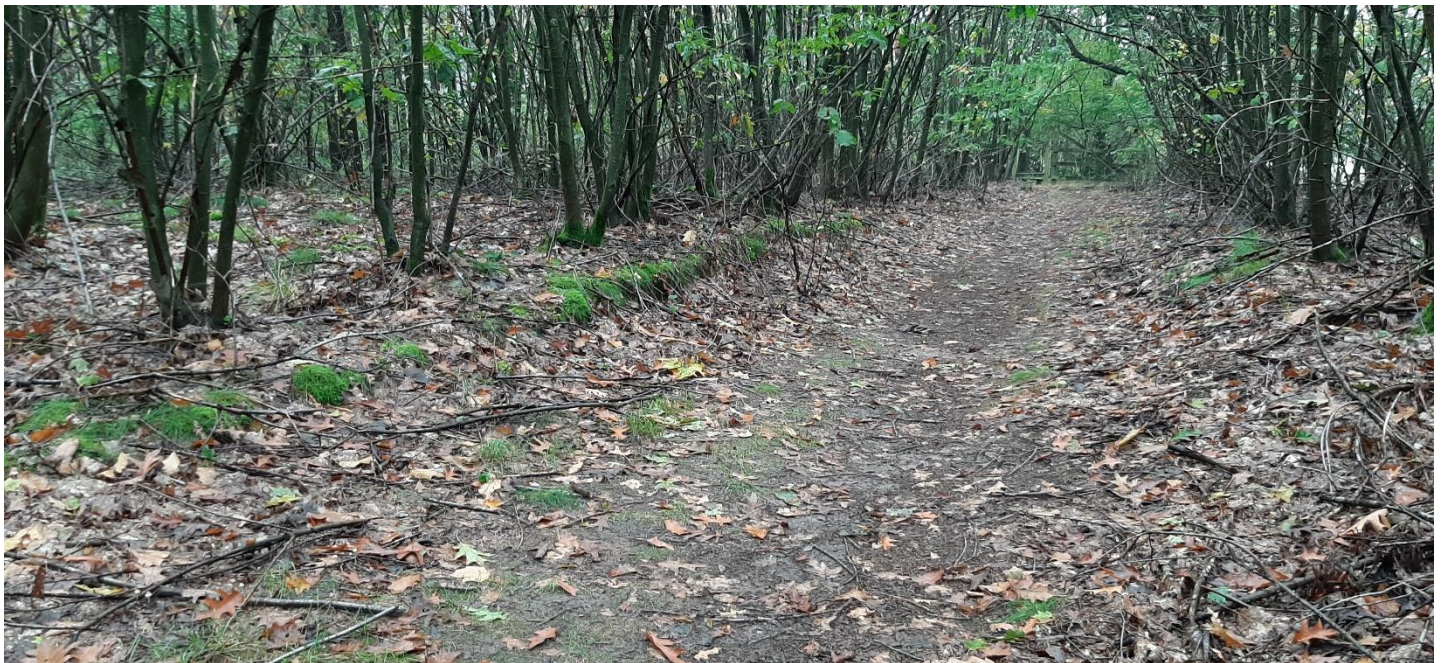
Figuur 4 – Waar de paden de wallen dwarsen is het profiel van de walstructuren zichtbaar