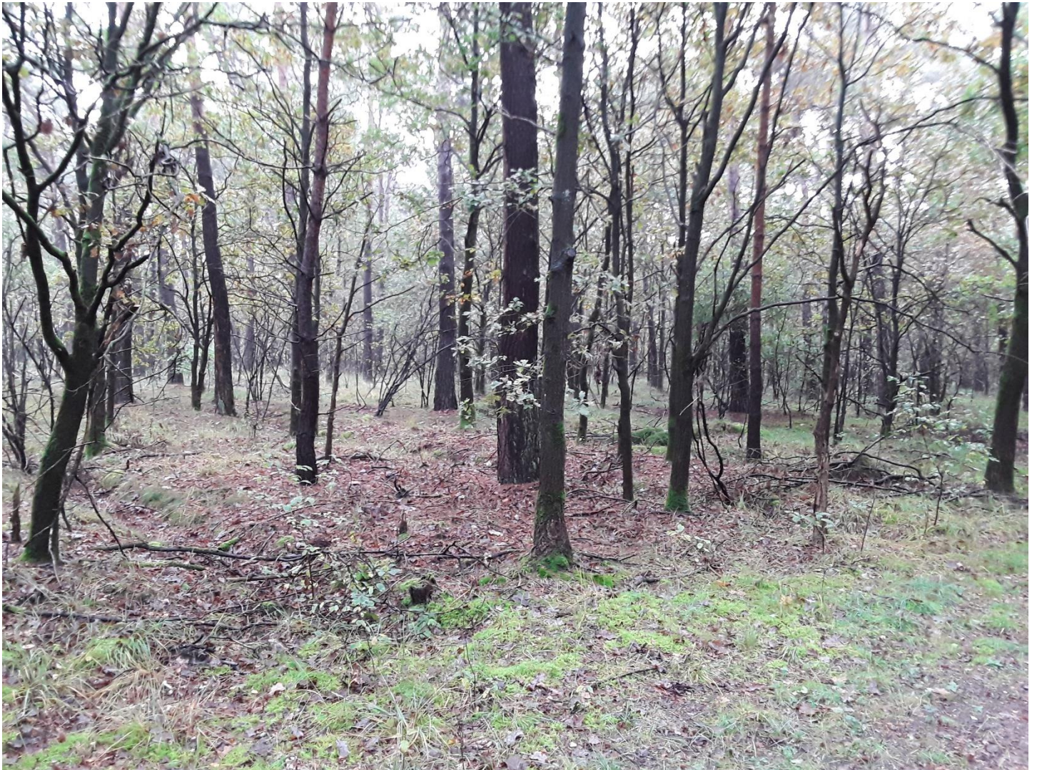
Figuur 6 – Zicht op het bosgebied in het noordoosten, met rabattenstructuren