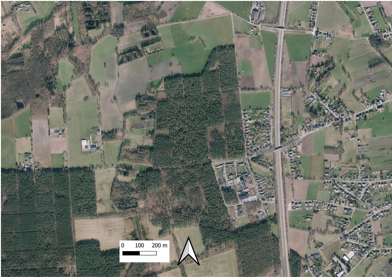
Figuur 1 – Orthofoto middenschalig, winteropnames meest recent