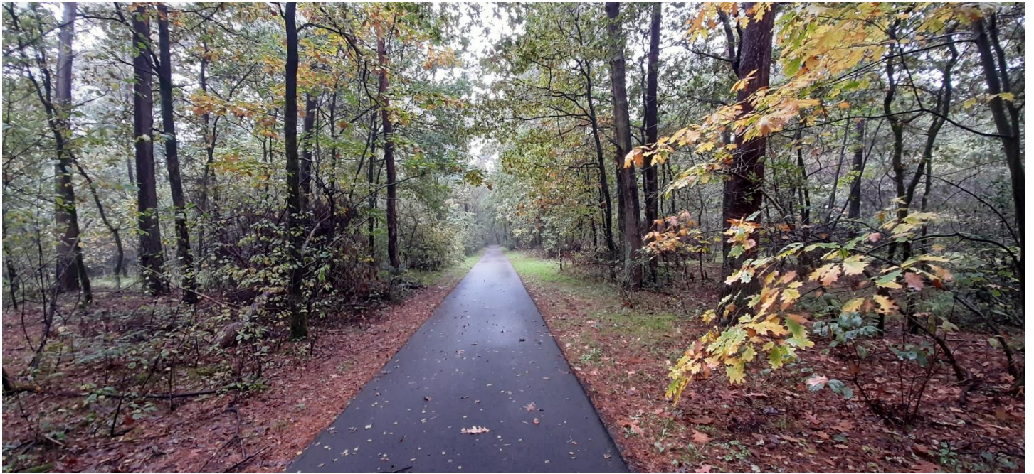
Figuur 5: Zicht op het bosgebied van op één van de verharde paden