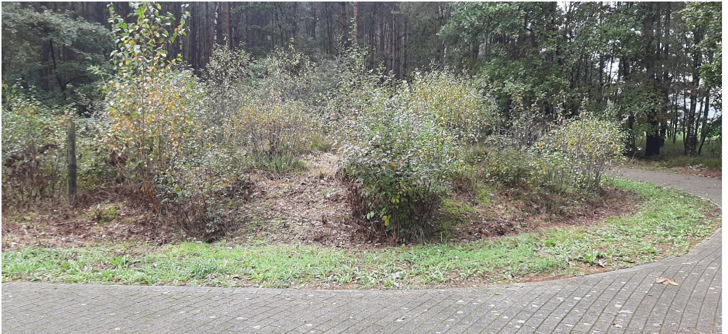
Figuur 3 – Zicht op één van de gereconstrueerde grafheuvels