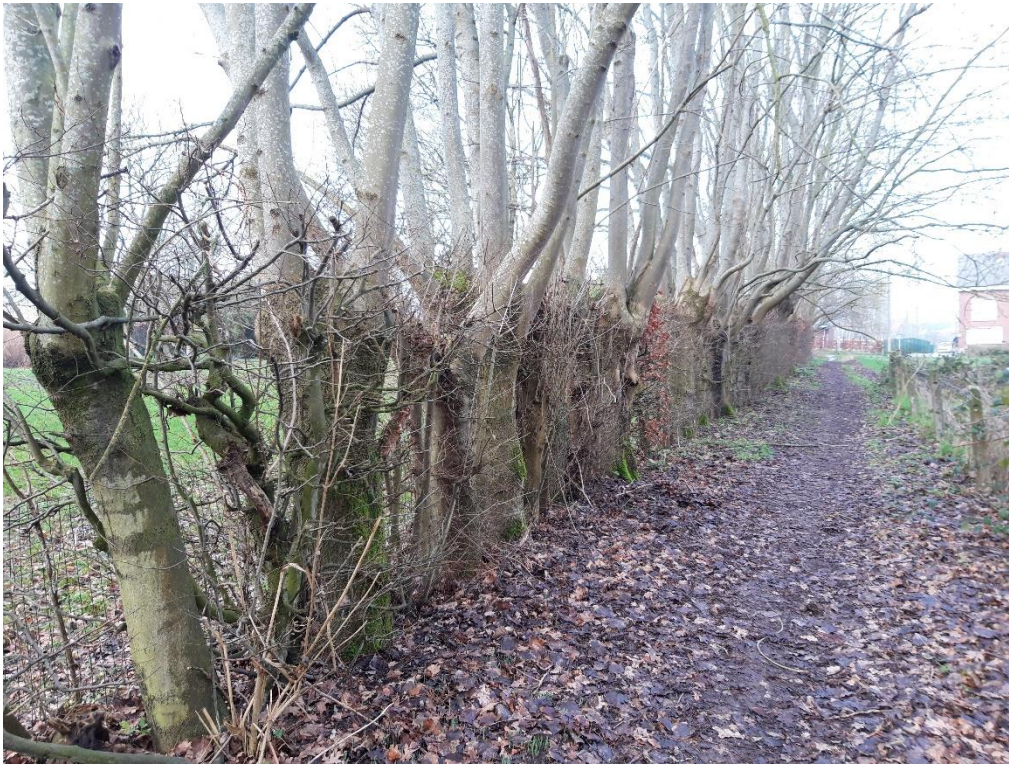
Foto 18: Essenkaphaag langs Ronsweg, Pieter Hoelmanstraat 35 (19 januari 2023)