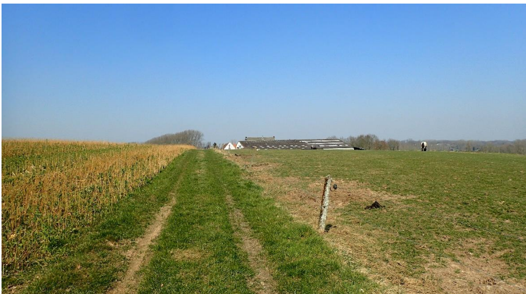
Foto 9: Zicht van aan de bosrand van Brakelbos op Hof ten Bossche met open kouter (24 maart 2022)