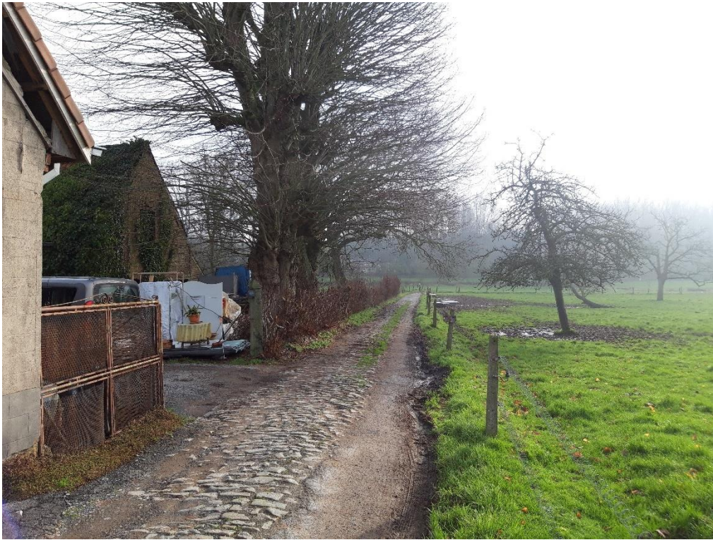
Foto 20: Gekasseide weg, erflindes en haag bij hoeve, Pullem 16 (19 januari 2023)