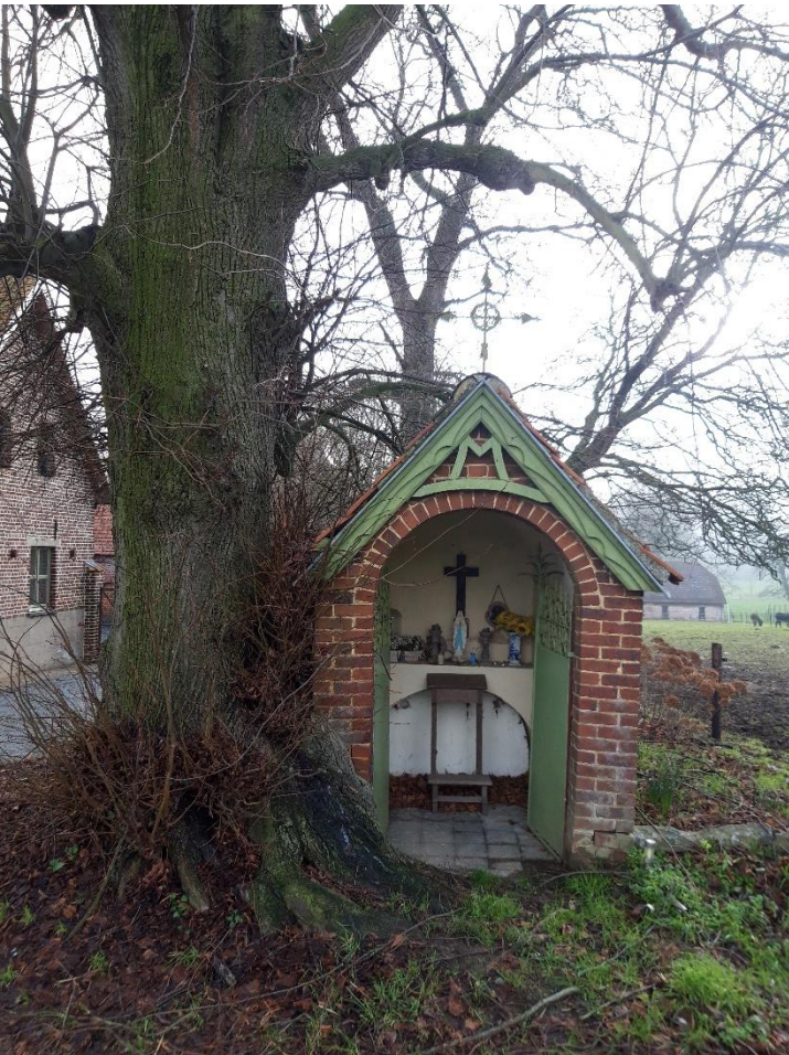
Foto 17: Gekandelaarde kapellinde, Pieter Hoelmanstraat 51 (19 januari 2023)