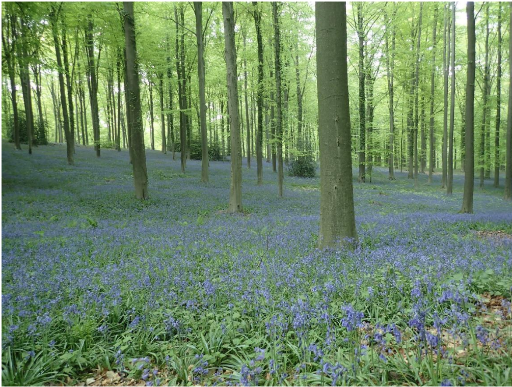
Foto 1: Voorjaarsflora van boshyacint onder beukenbos in Brakelbos (27 april 2022)