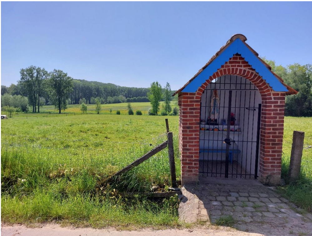
Foto 21: Onze-Lieve-Vrouwekapel bij hoeve met zicht op de vallei van de Sassegembeek en Brakelbos, Pieter Hoelmanstraat 54 (26 mei 2023)