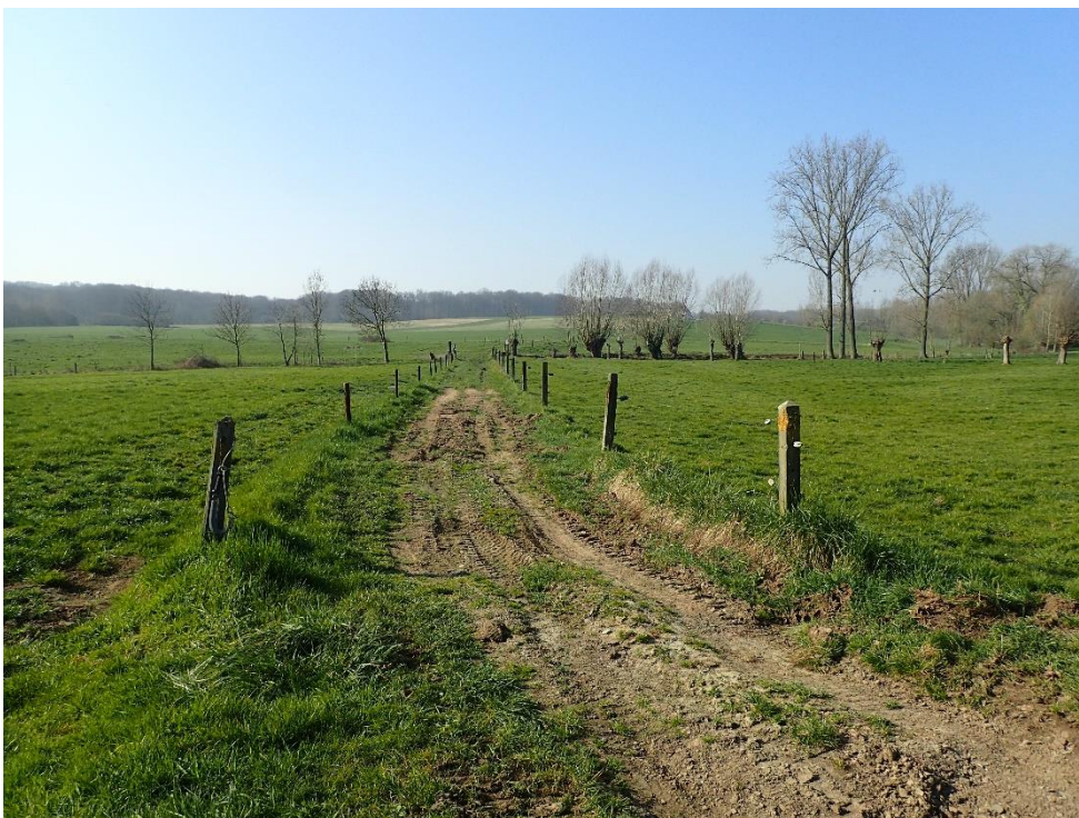
Foto 11: Zicht van aan het kruispunt Pullem-Hof ten Bosscheweg in zuidwestelijke richting over de onverharde Hof ten Bosscheweg naar Hof ten Bossche (24 maart 2022)