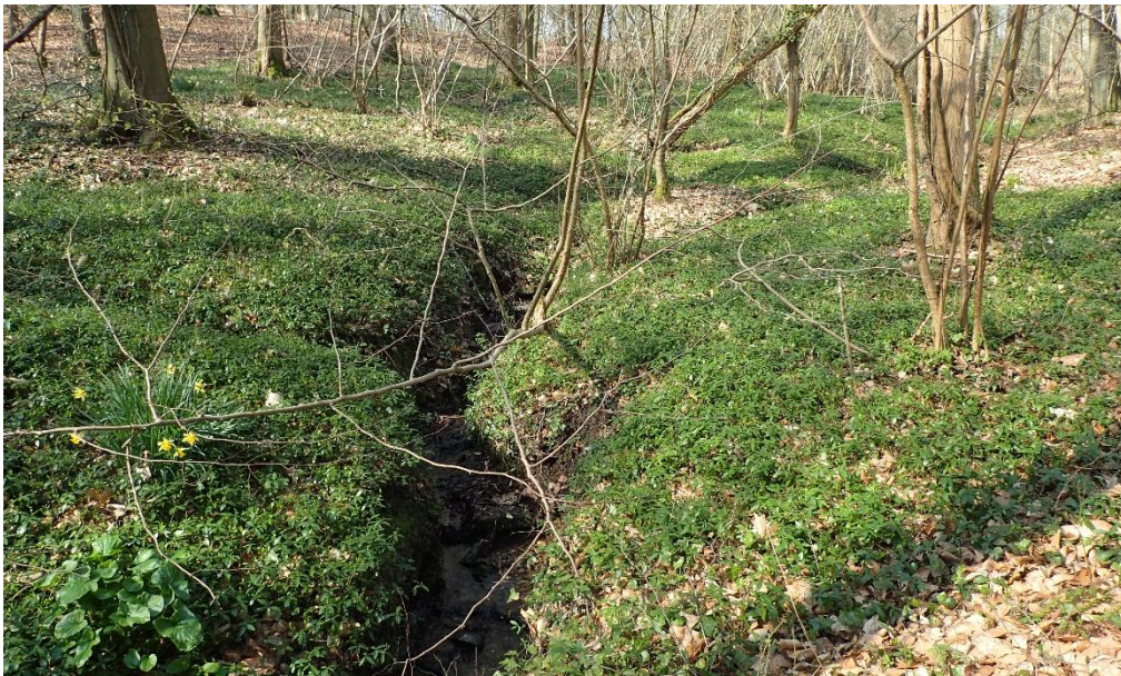
Foto 2: Bronbosvegetatie langs de Sassegembeek in Brakelbos (24 maart 2022)