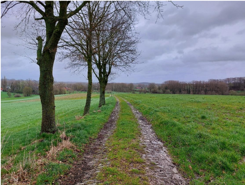
Foto 10: Zicht van aan Hof ten Bossche over de deels gekasseide Hof ten Bosscheweg in de richting van de vallei van de Sassegembeek (31 maart 2023)