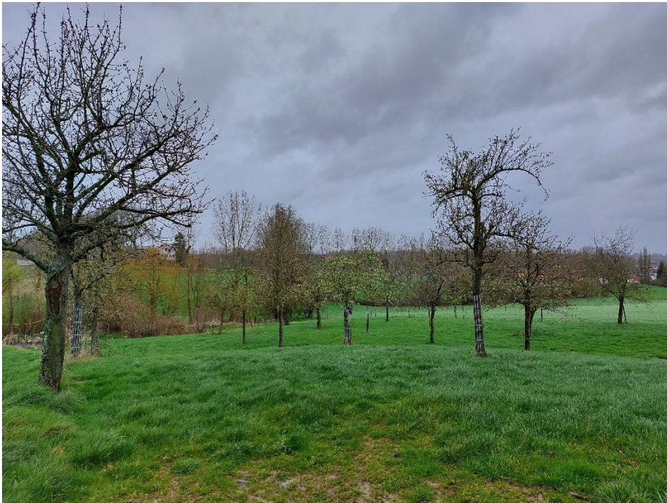
Foto 12: Zicht van aan Hof ten Bossche naar de bronvallei ten noorden van de hoeve, met hoogstamboomgaard en bronzones (31 maart 2023)