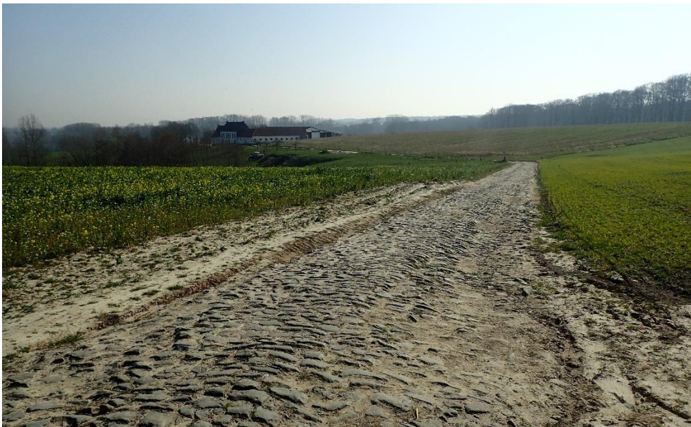
Foto 8: Gekasseide toegangsweg van Hof ten Bossche met zicht over de kouter naar Brakelbos (24 maart 2022)