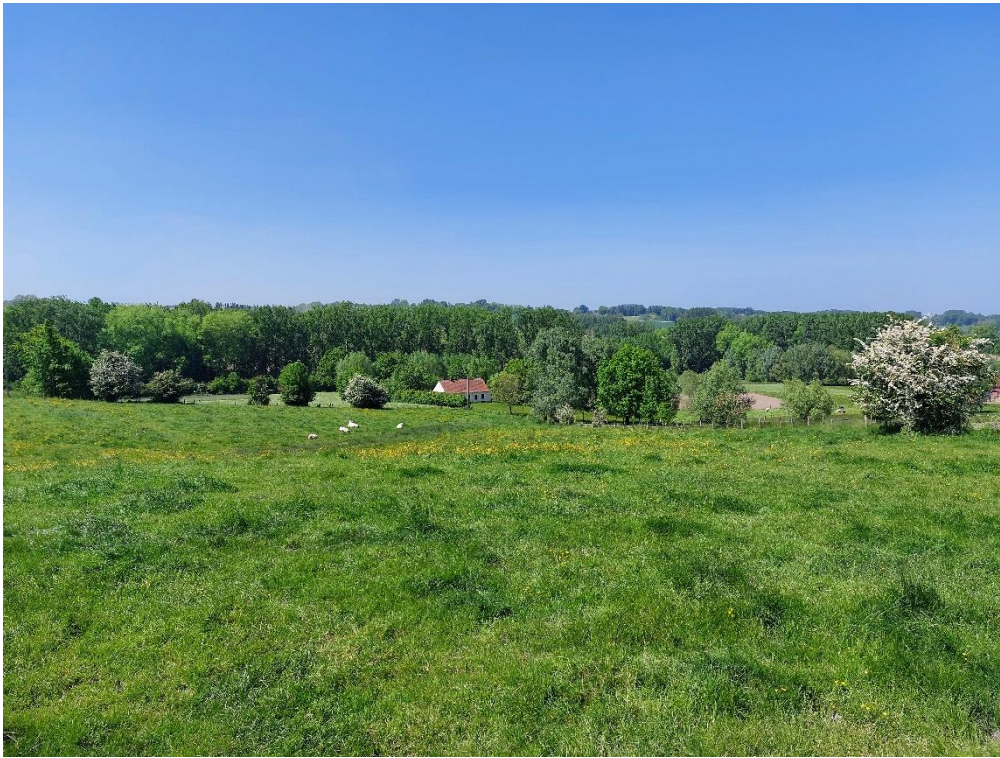
Foto 22: Zicht van de weg Pullem op de vallei van de Sassegembeek met bronzone, hagen en boerenarbeiderswoning Pullem 14 (26 mei 2023)