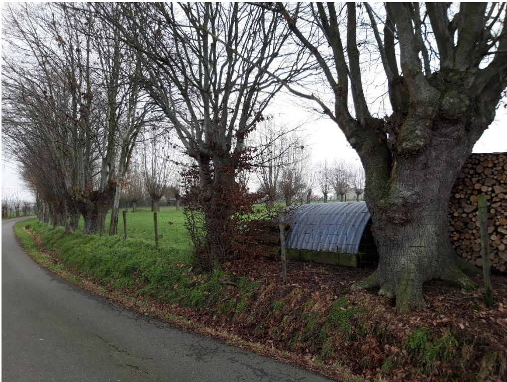
Foto 19: Knotbomenrij van zomereik en haagbeuk langs weg Pullem (19 januari 2023)