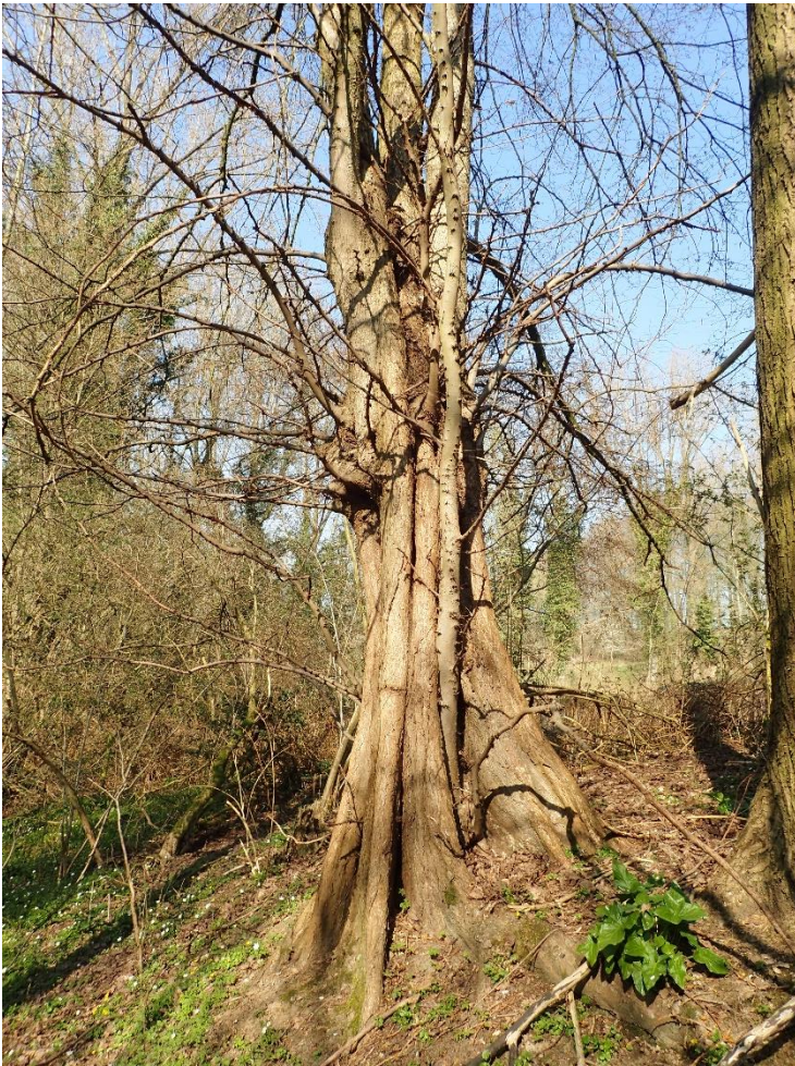
Foto 16: Geknotte fladderiep de Sassegembeekvallei (24 maart 2022)