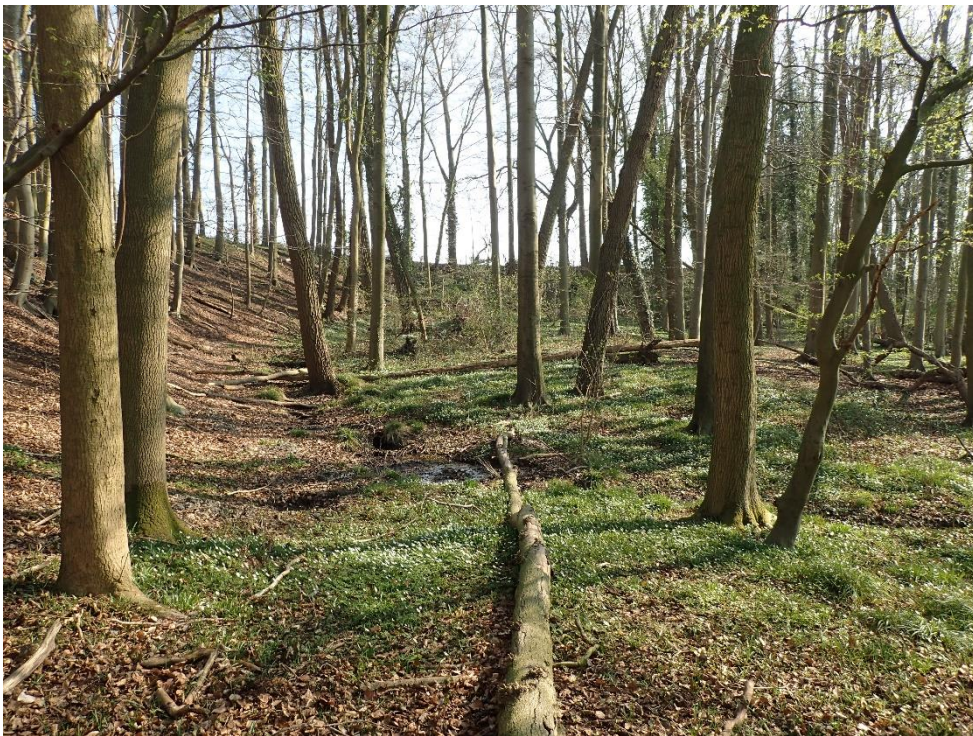
Foto 13: Beboste steile helling met bronzones en voorjaarsflora in de vallei van de Sassegembeek (24 maart 2022)