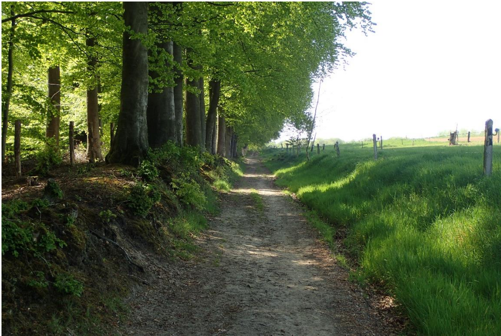
Foto 5: Noordelijke bosrand van Brakelbos met boswal en weg Laaistok (27 april 2022)