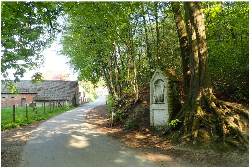
Foto 6: Veldkapelletje met paardenkastanje als kapelboom aan de ingang van Brakelbos, Brakelbosstraat (27 april 2022)