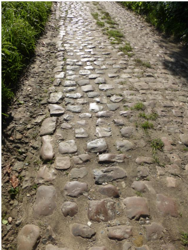
Foto 3: Kasseien en boordstenen in Tiense kwartsiet met voskleurige patina.