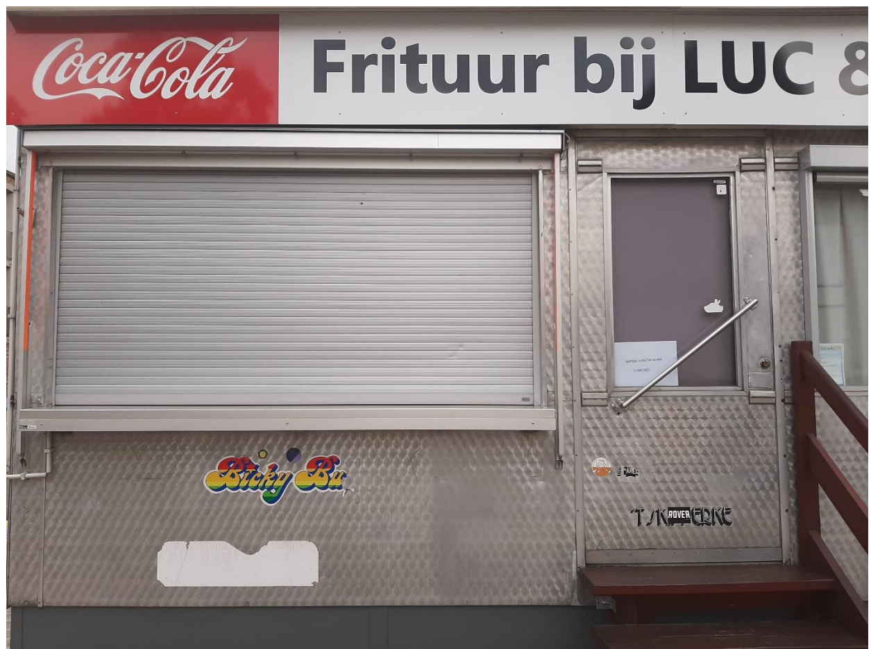
Foto 7: Linker gedeelte van het fritkot bevat het bakgedeelte waar frietjes afgehaald kunnen worden. Het rechter gedeelte is het zitgedeelte.