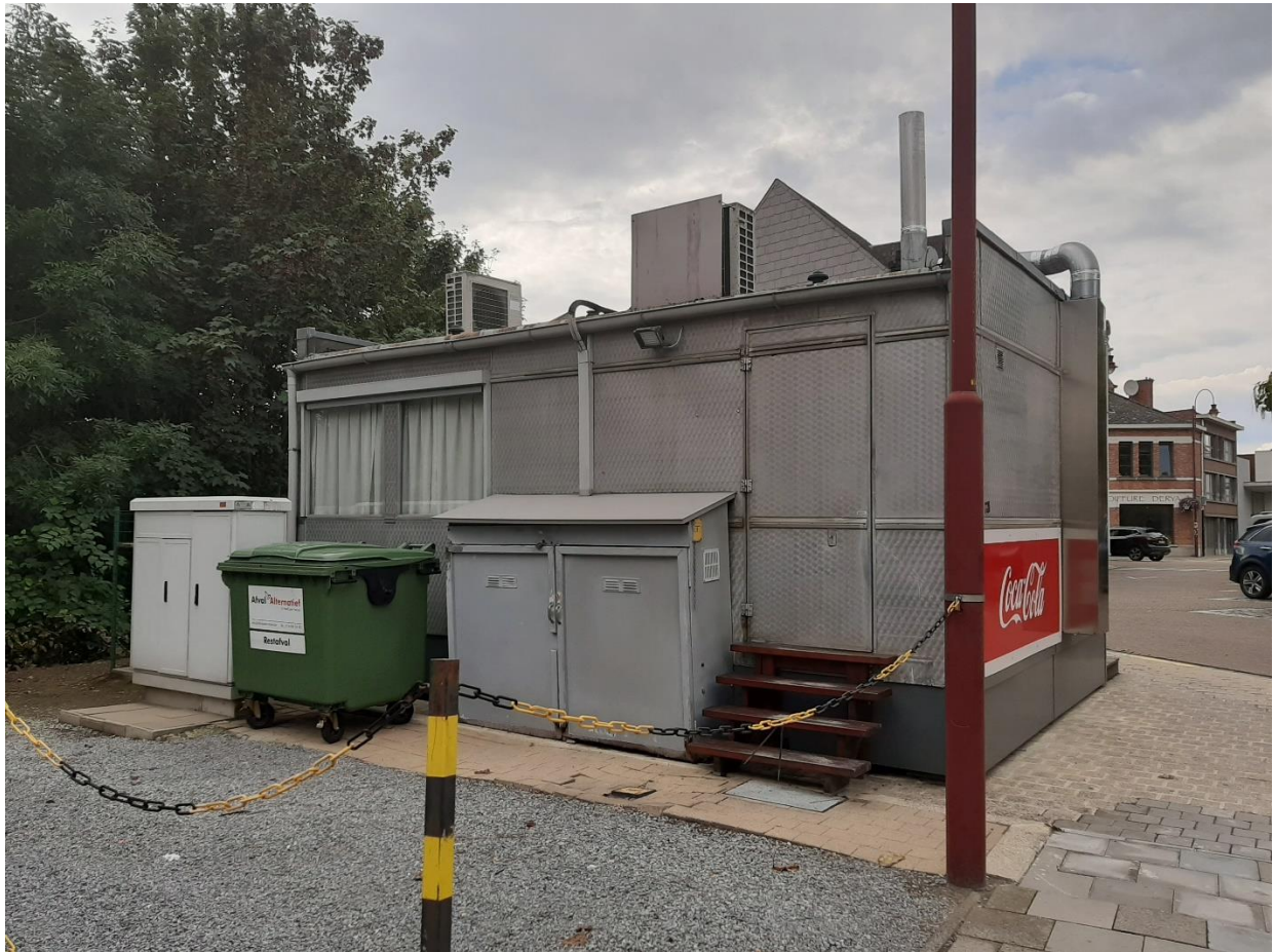
Foto 6: Oostgevel of achtergevel van het frietkot aan de Bekaflaan.