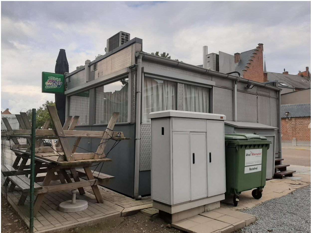
Foto 5: Frietkot aan de Bekaflaan gezien vanuit zuidoostelijke hoek.