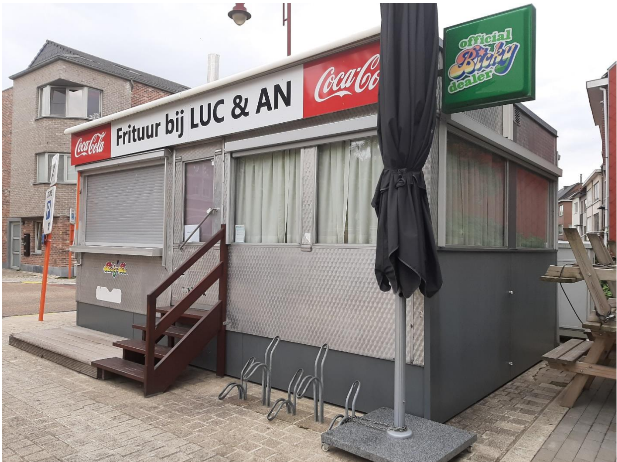
Foto 3: Frietkot aan de Bekaflaan gezien vanuit een zuidwestelijke hoek.