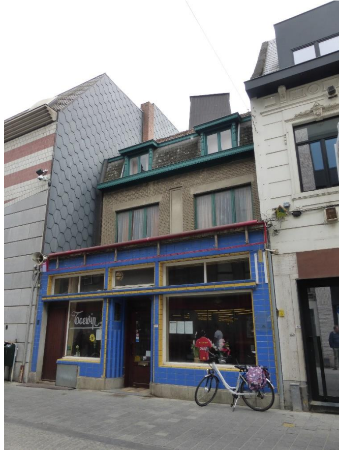
Foto 1: zicht op de voormalige herberg "In de Toewip" – achteraan rijst de schutterstoren boven het pand uit. De toren is licht schuin ingeplant tegenover de rooilijn en het voorgeplaatste gevelfront met herbergpui (plaatsbezoek Onroerend Erfgoed 16.05.2022).