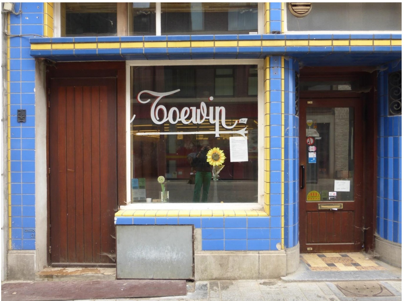
Foto 12: de brede ramen (de bijkomende deur links is niet oorspronkelijk) en het verdiepte portaal zijn gevat onder een geprononceerde druiplijst. Bij het verdiepte portaal met afgeronde hoeken zijn de hardstenen dorpel en de cementtegelvloer uit de jaren 1930 bewaard. De vloer bestaat uit gele en bruine gemarmerde tegels gelegd in een geometrisch patroon (plaatsbezoek Onroerend Erfgoed 16.05.2022).