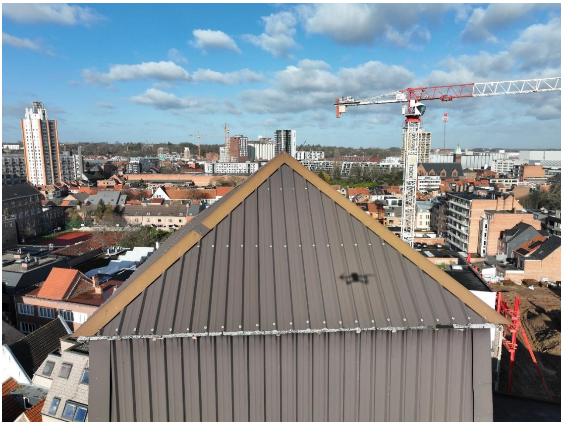
Foto 7: de toren versmalt naar boven toe en is afgedekt met een zwak hellend, licht overkragend piramidedak (rapport Monumentenwacht, plaatsbezoek 30.01.2023,).