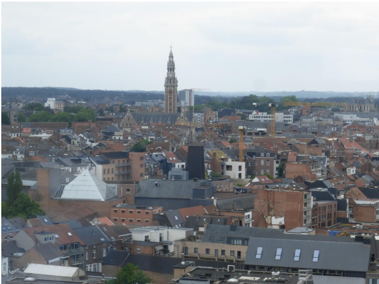
Foto 2: zicht op de obeliskvormige schutterstoren vanuit het Dirk Boutsgebouw in Leuven (plaatsbezoek Onroerend Erfgoed 16.05.2022).