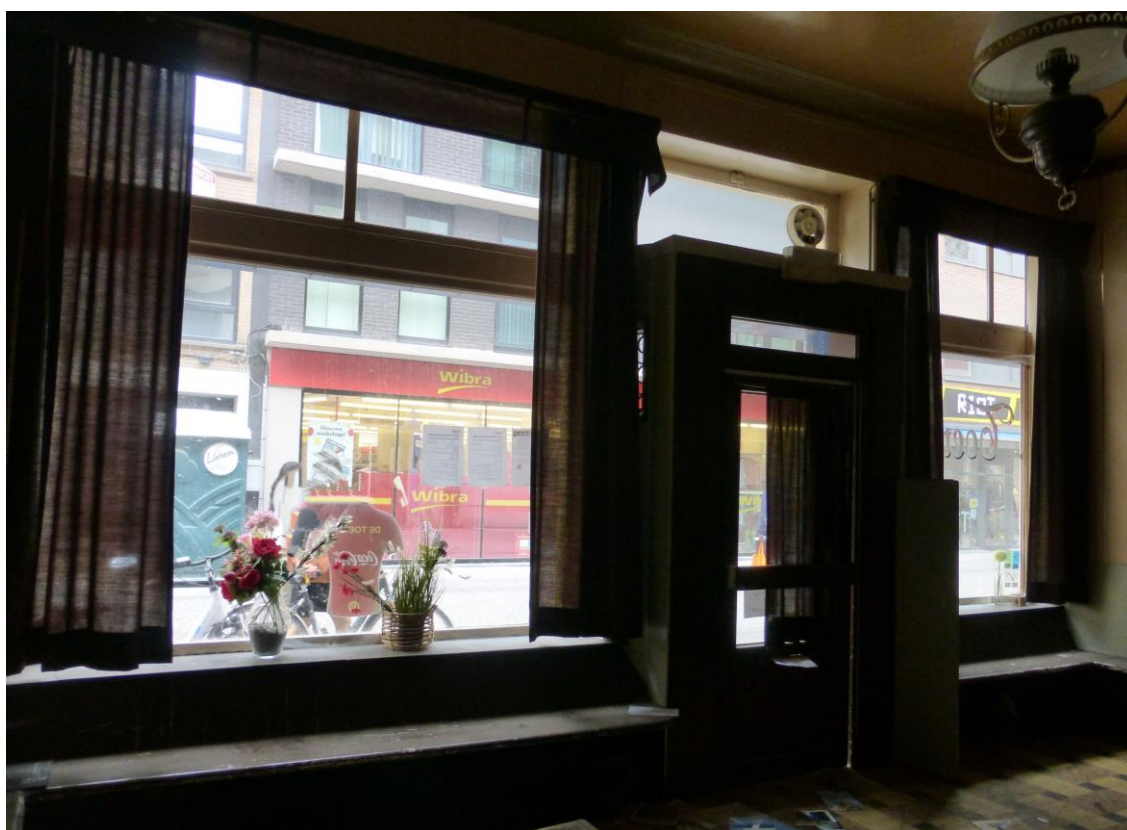
Foto 15: interieurzijde van de herbergpui. Aan de binnenzijde is het verdiepte portaal rechthoekig uitgewerkt. Boven de vensters en het portaal steekt een breed bovenlicht (plaatsbezoek Onroerend Erfgoed 16.05.2022).