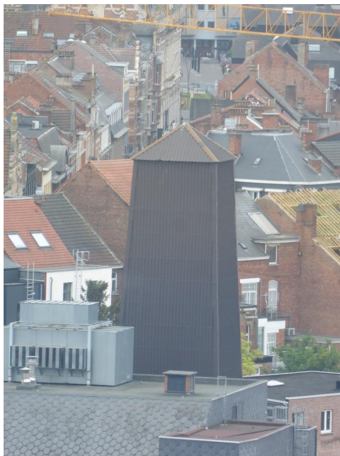
Foto 3: zicht op de obeliskvormige schutterstoren vanuit het Dirk Boutsgebouw in Leuven (plaatsbezoek Onroerend Erfgoed 16.05.2022).