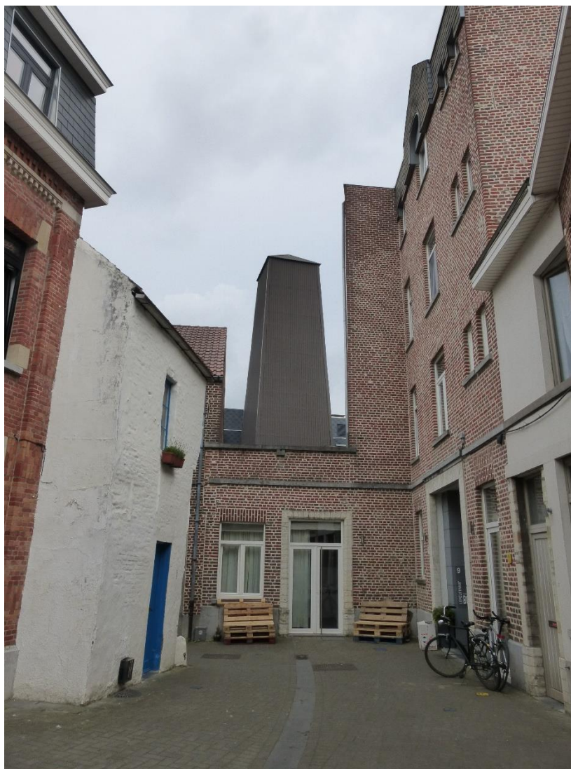
Foto 5: zicht op de obeliskvormige schutterstoren vanaf de doodlopende Lepelstraat, ten zuidwesten (plaatsbezoek Onroerend Erfgoed 16.05.2022).