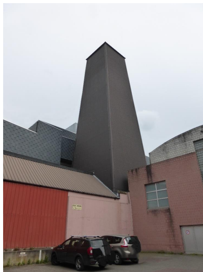
Foto 4: zicht op de obeliskvormige schutterstoren vanaf de ten westen aan de gelagzaal palende parkeerplaats (plaatsbezoek Onroerend Erfgoed 16.05.2022).