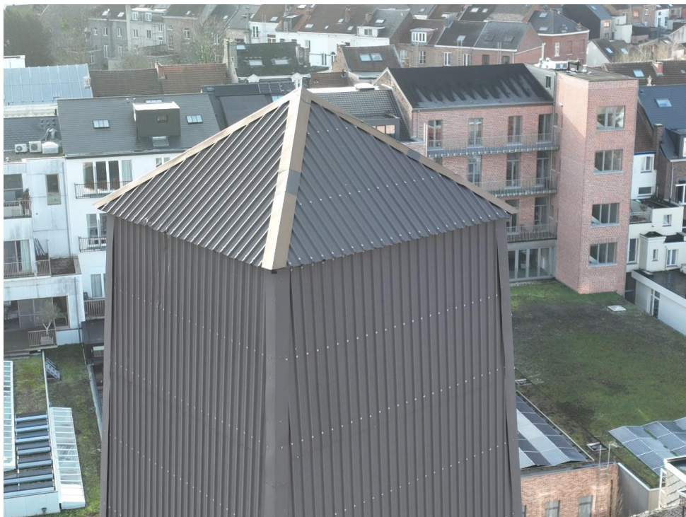
Foto 9: de toren versmalt naar boven toe en is afgedekt met een zwak hellend, licht overkragend piramidedak (rapport Monumentenwacht, plaatsbezoek 30.01.2023,).