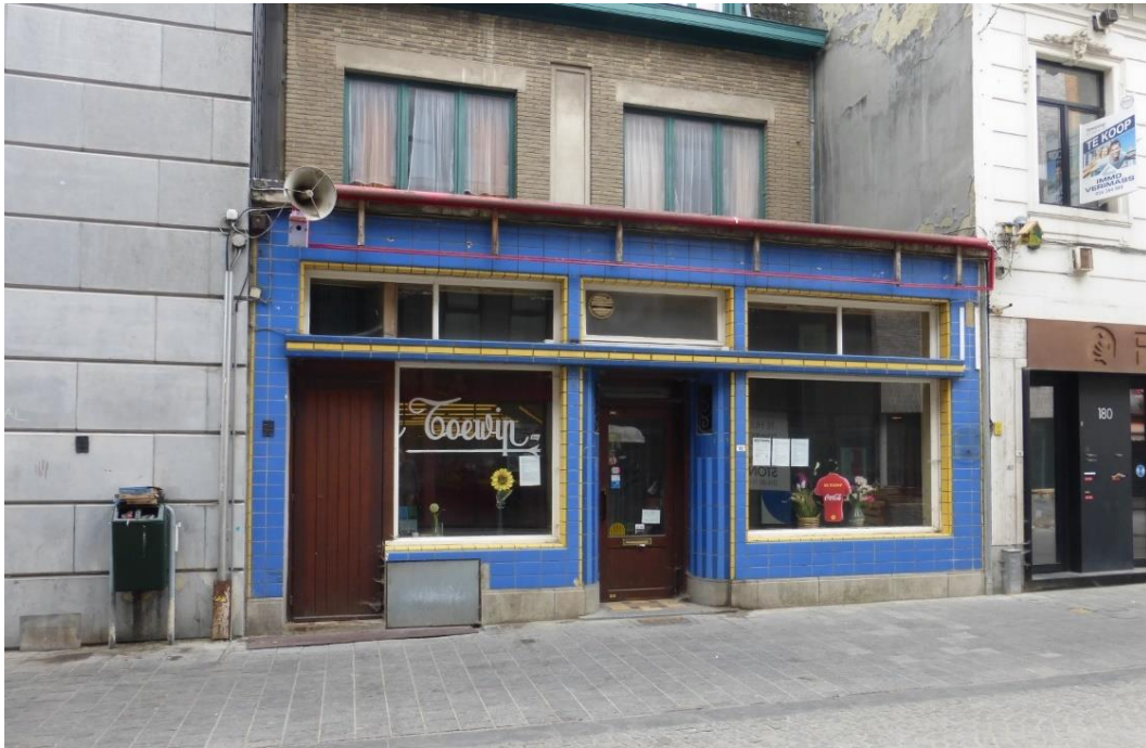
Foto 11: het voorgeplaatste gevelfront met de pui van de voormalige herberg "In de Toewip" – het gevelfront springt naar voor tegenover de bovenverdieping, maar staat op dezelfde rooilijn als de aanpalende gevels (plaatsbezoek Onroerend Erfgoed 16.05.2022).