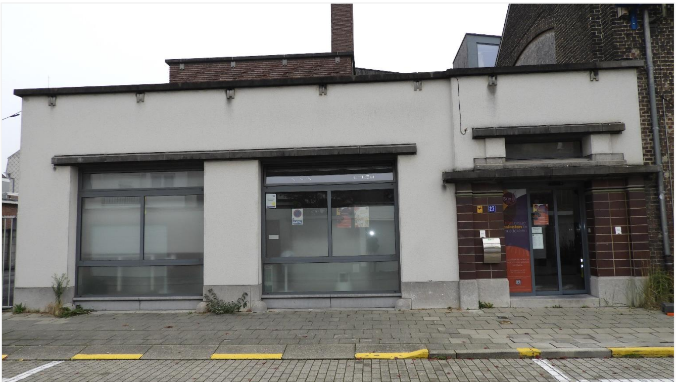
6: Het in de jaren 1930 aangebouwde stedelijk badhuis, dat sinds 1999 als stadsgezicht is beschermd