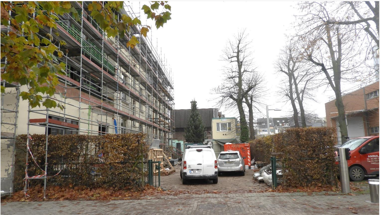
3: Achterkant van het voormalige schoolgebouw