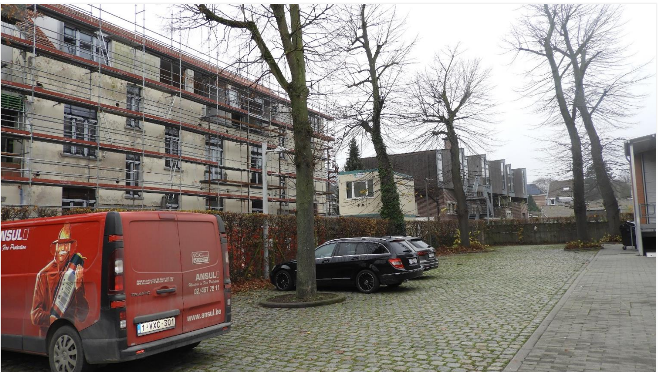
4: Achterkant van het voormalige schoolgebouw (links), rechts de in 2019 gerealiseerde bovenbouw op het achterste volume van het stedelijk badhuis, nu in gebruik als gebouw voor de Stedelijke Academie Muziek, Woord en Dans