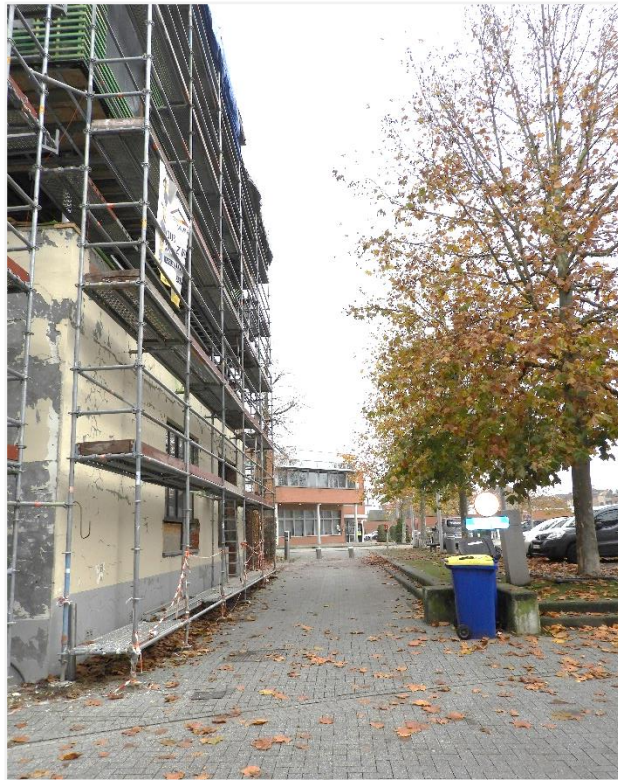
7: Toegang tot de parking achter het schoolgebouw van de voormalige Meisjeskostschool Les Peupliers