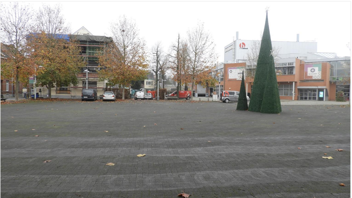
2: Zicht van op het verharde plein in de richting van het stadsgezicht (links) en het CC Bolwerk