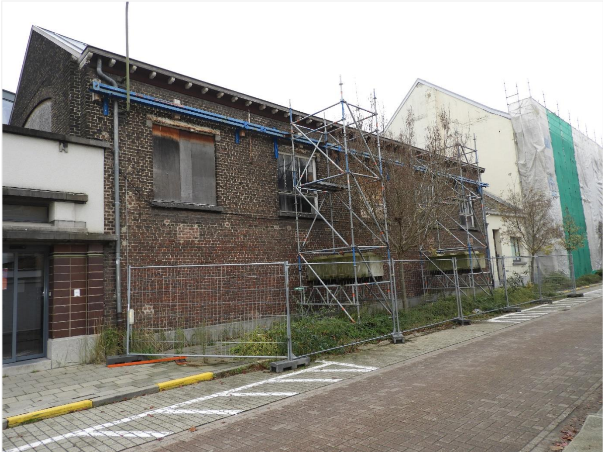
5: De als monument beschermde turnzaal (ontwerp van Horta), foto Hilde Verboven