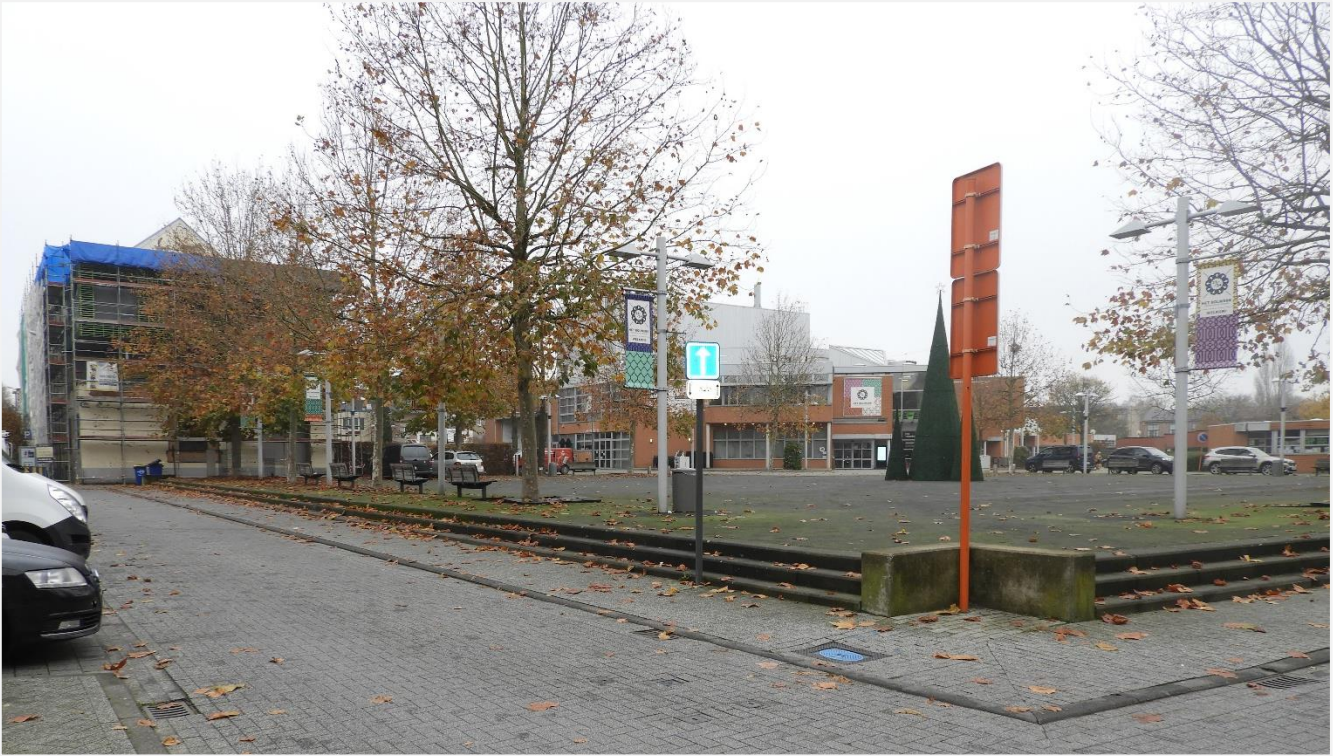
1: Zicht vanuit de Bolwerkstraat op het plein, dat de vroegere tuin en tuinmuur vervangt