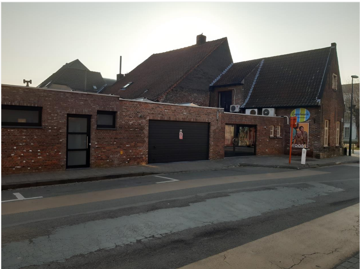
Foto 5: Hofstede In Sint-Anthone, Drongenplein 15: overzicht aanbouw Vierhekkensstraat (© agentschap Onroerend Erfgoed 24 maart 2022).