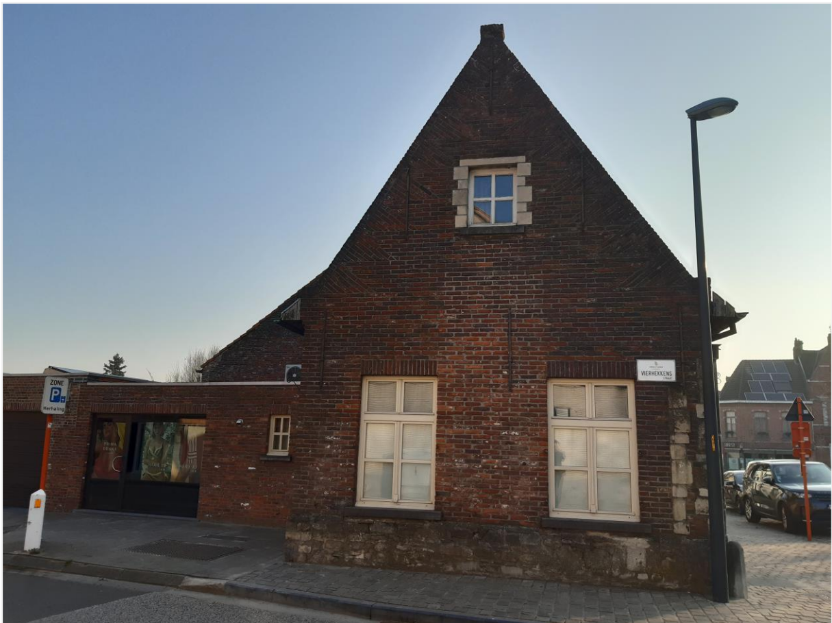
Foto 4: Hofstede In Sint-Anthone, Drongenplein 15: westelijke zijpuntgevel met gereconstrueerde geveltop met vlechtwerk en aandaken (© agentschap Onroerend Erfgoed 24 maart 2022).