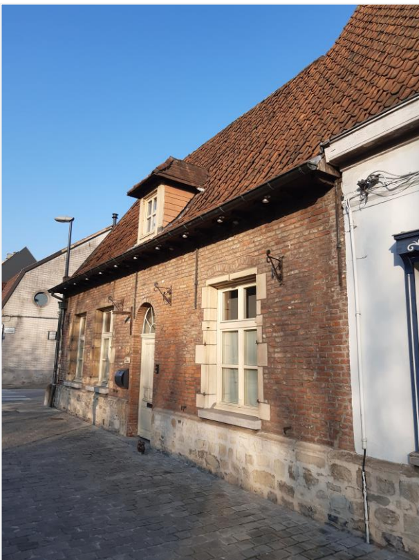
Foto 2: Hofstede In Sint-Anthone, Drongenplein 15: voorgevel.