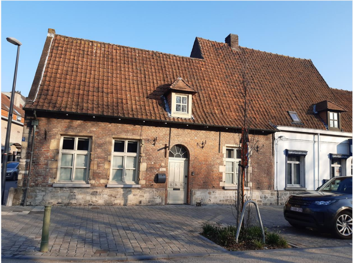
Foto 1: Hofstede In Sint-Anthone, Drongenplein 15 in Gent (Drongen): voorgevel (© agentschap Onroerend Erfgoed 24 maart 2022).