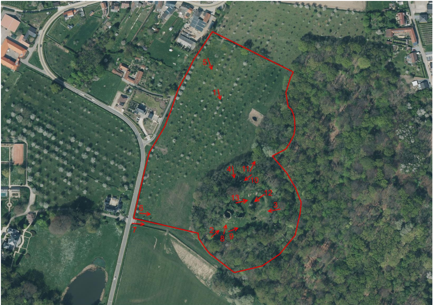
Orthofoto (winter 2022) met aanduiding van de bescherming en situering van de foto's.