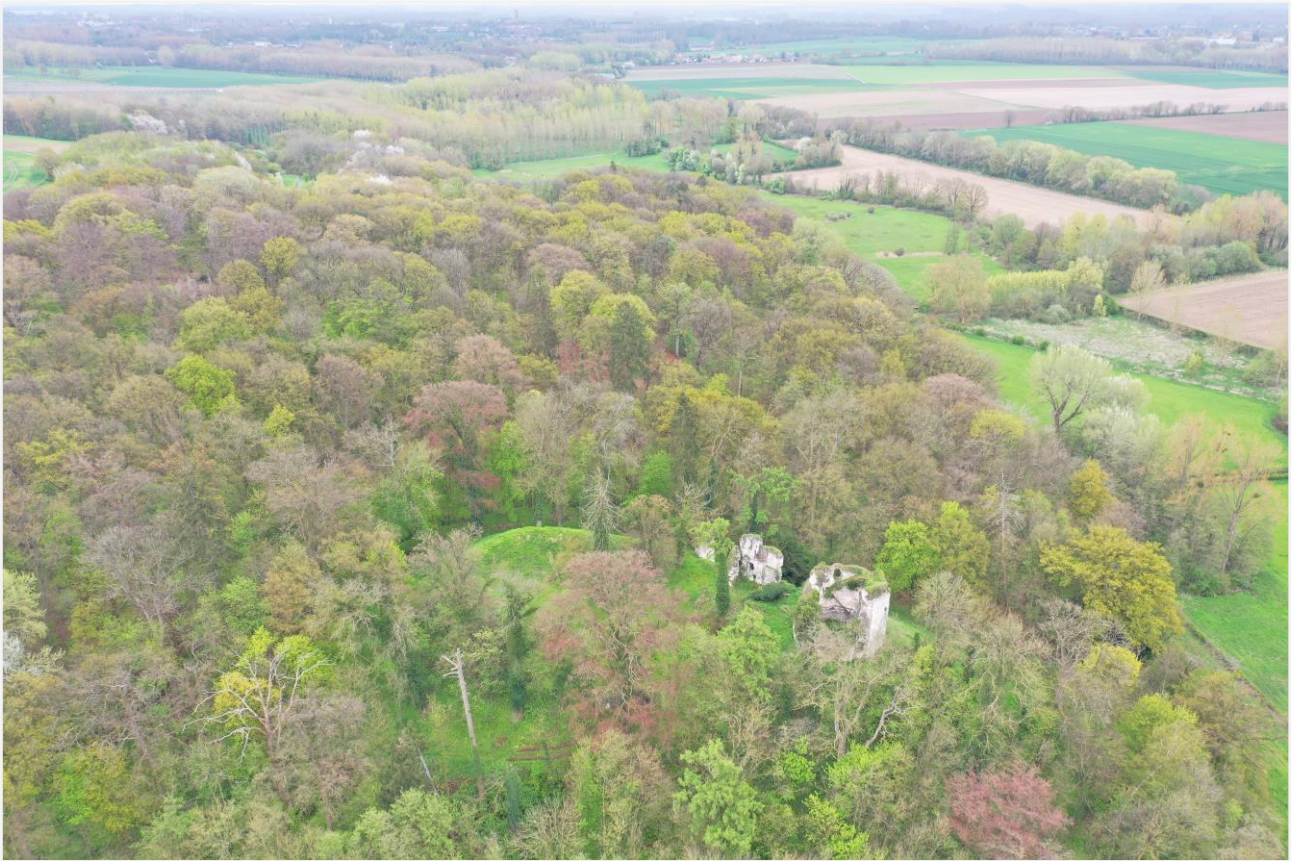
Foto 1: Dronebeeld van Kolmontbos met de burchtruïne (26/04/2023).