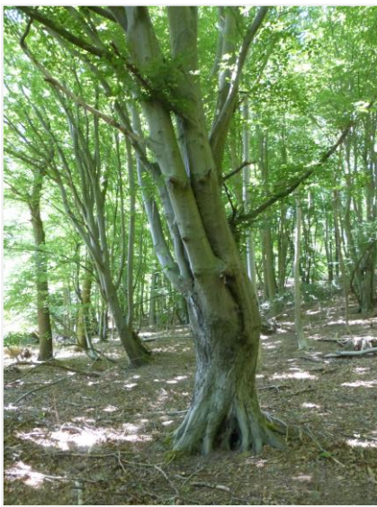
Foto 15: Knothaagbeukenrij op talud aan de bosrand in het oosten (15/02/2022).