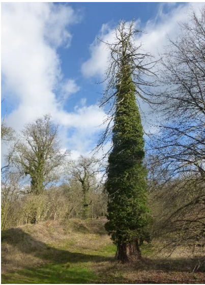
Foto 4: Mammoetboom op de binnenplaats van de burcht (15/02/2022)