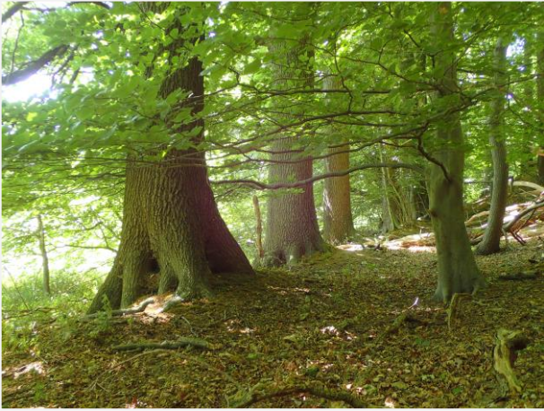
Foto 13: Eikenrij op talud aan de bosrand in het zuiden (15/02/2022).