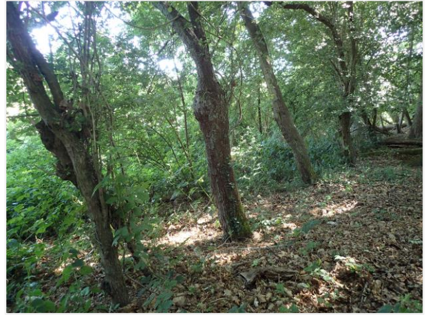
Foto 14: Relict van meidoornhaag aan de bosrand in het zuidoosten (15/02/2022).