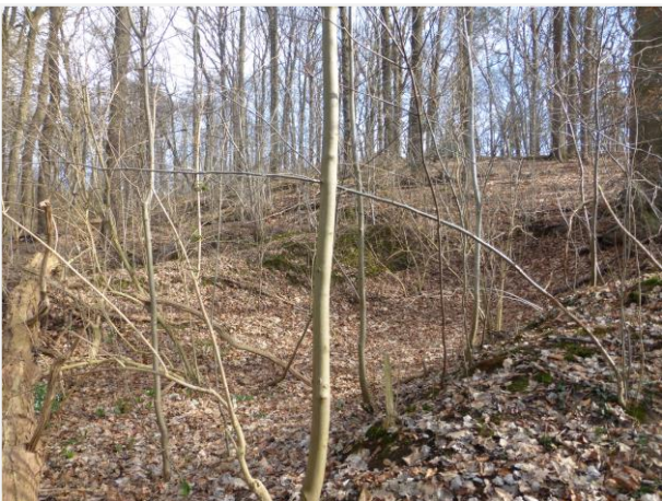
Foto 18: Ontginningskuilen aan de bosrand in het westen (15/02/2022).