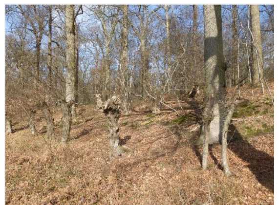
Foto 12: Knothaagbeukenrij aan de bosrand in het zuidwesten (15/02/2022).