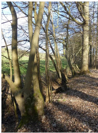
Foto 16: Rij knotessen aan de bosrand in het noordwesten (15/02/2022).