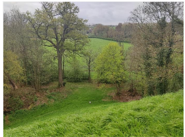
Foto 3: Zicht van op de ruïne op de zomereik en de beekvallei (26/04/2023).