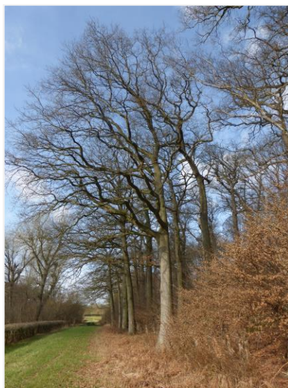
Foto 11: Zomereiken aan de bosrand in het zuidwesten (15/02/2022)