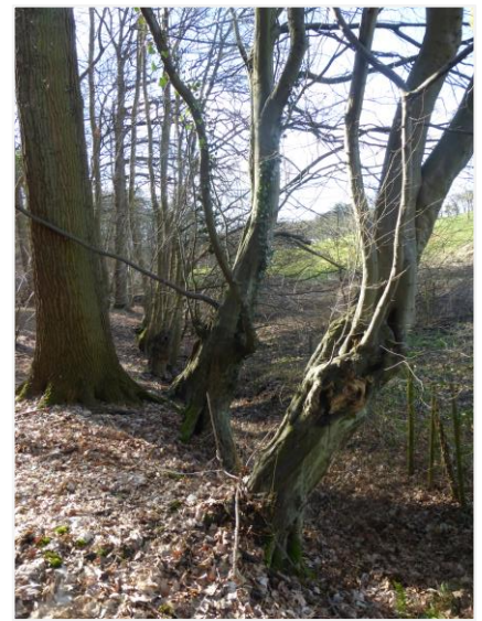
Foto 17: Rij knothaagbeuken aan de bosrand in het noordwesten (15/02/2022).