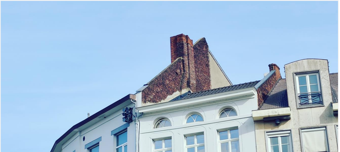
Foto 4: zijpuntgevel: sporen van dakwerken waarbij de zijpuntgevel met aandak en vlechtingen deels heropgebouwd werd