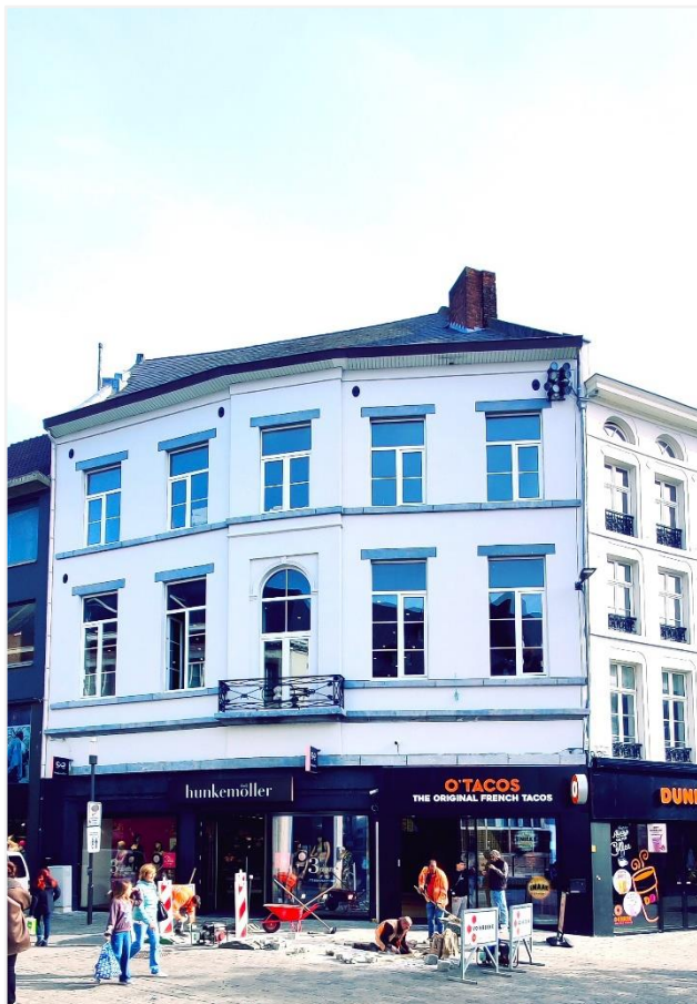
Foto 2: voorgevel: verbouwde begane grond en bewaarde verdiepingen in empirestijl