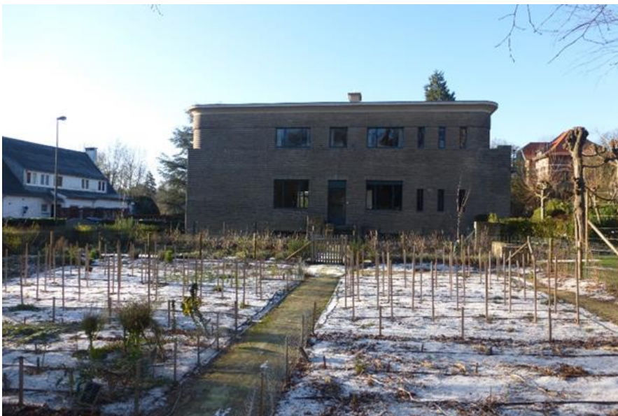
Foto 20: Moestuin met centraal pad in halfverharding en draadafsluiting. Zicht vanuit het noorden.