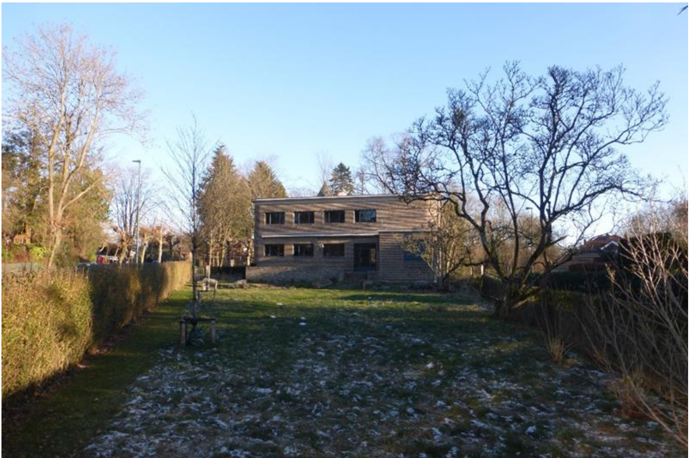
Foto 14: Zicht vanop het terras in de zuidpunt van de tuin. Rechts twee meerstammige magnolia's, vermoedelijk daterend uit de periode Joseph Hers.