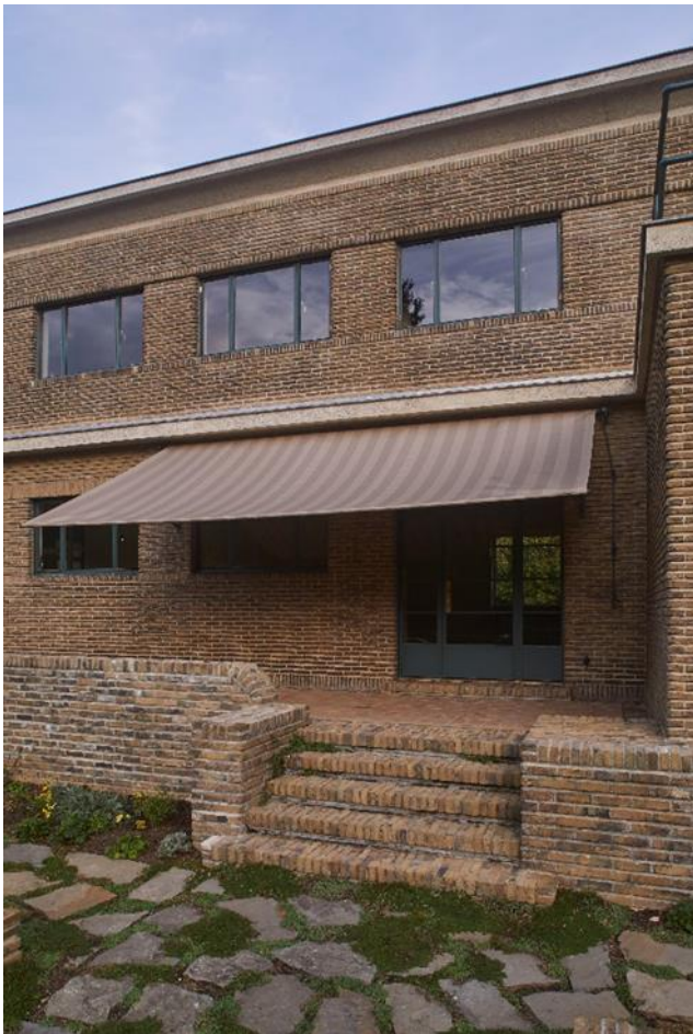
Foto 7: Verhoogd terras met afgeronde terrasmuur, zonneluifel en pad in flagstones aansluitend bij de zuidgevel.