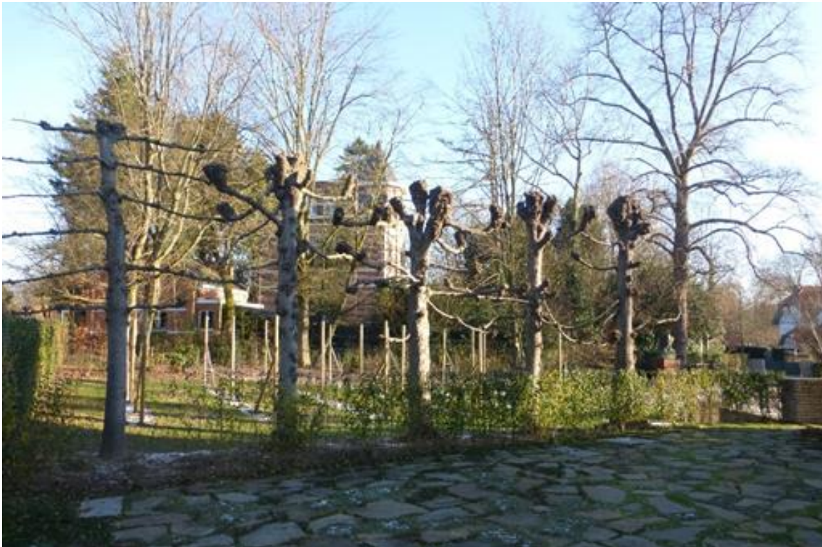
Foto 32: Rij geleide linden bij de toegangszone die de vijf kinderen van het echtpaar van de Velde symboliseren. De meest linkse werd recent aangeplant ter vervanging van een afgestorven exemplaar.