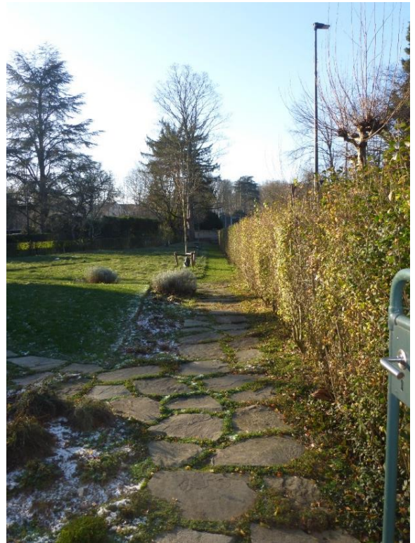
Foto 16: Zicht vanaf het tuinpoortje naar het tuinterras in de zuidelijke punt.