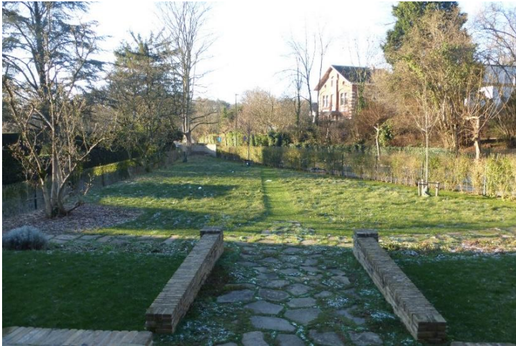
Foto 15: Zicht vanop het terras naar het zuiden. De keermuren en het pad in flagstones leiden de blik zuidwaarts. Langs het graspad parallel met de haag werden recent een kers, jonge Gingko Biloba en een geelbladige Colchische esdoorn aangeplant.