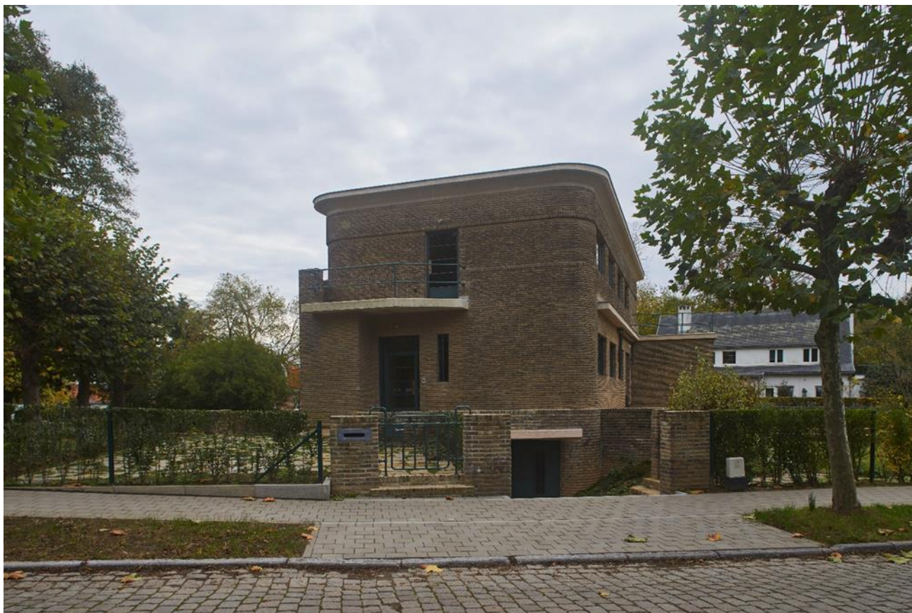
Foto 1: Noordwestgevel met toegangszone afgesloten door een hek in buismetaal tussen bakstenen hekpijlers.