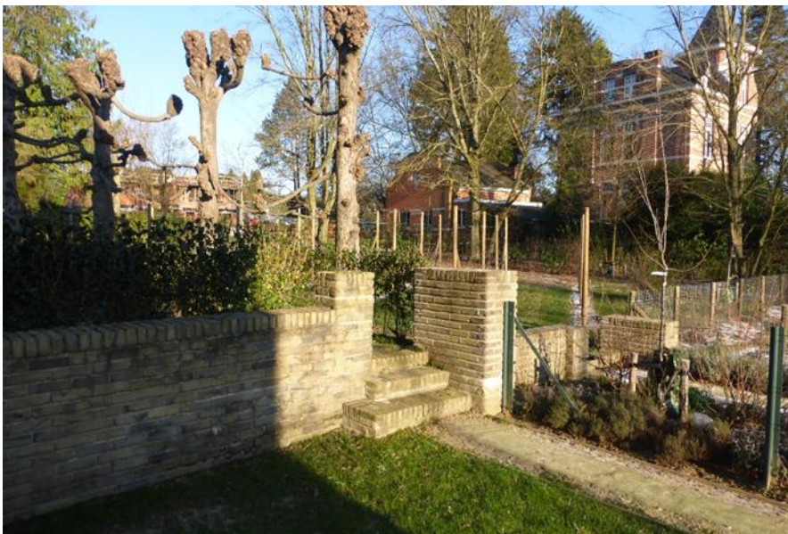
Foto 23: Zicht op het noordelijk tuingedeelte met tuinmuurtjes en -trappen aansluitend bij de woning.