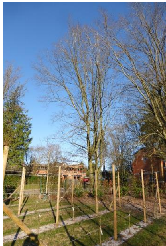
Foto 18: Recent toegevoegde aanplanting van geleid laagstamfruit ten noordwesten van de woning.