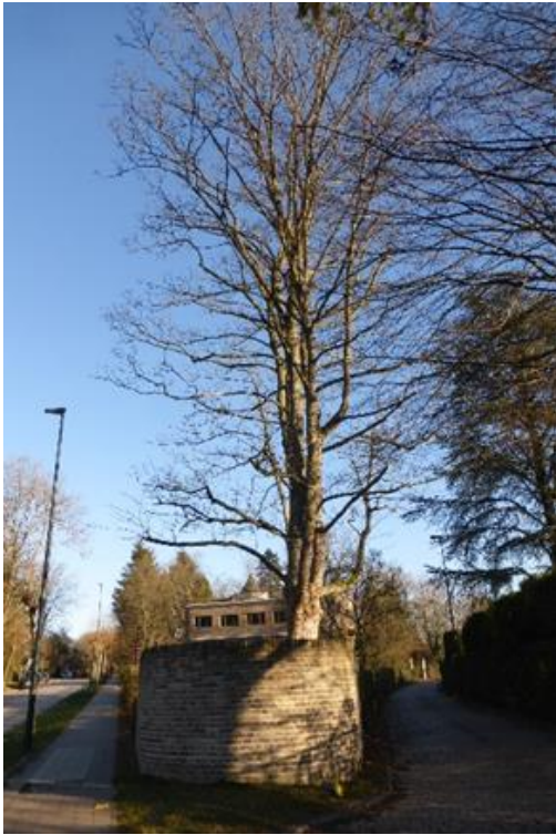
Foto 12: Half rond terras met begeleidende, solitaire gewone esdoorn. Zicht vanaf de straat.