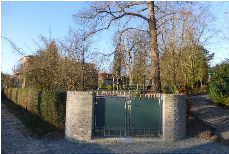
Foto 22: Nieuwe toegangspoort in de noordoostelijke punt van de tuin.