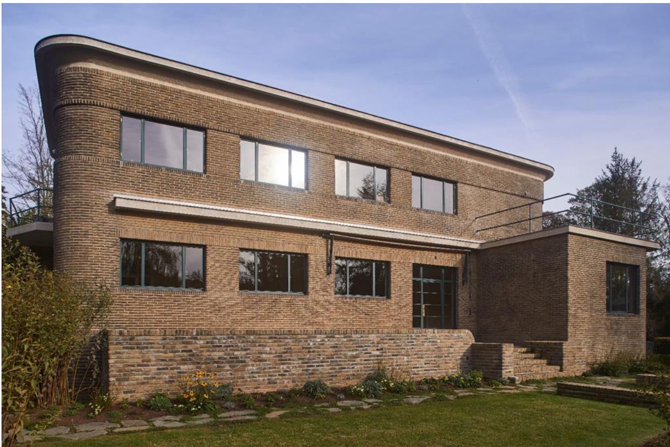
Foto 4: Zuidwestgevel met aansluitend terras. Het uitspringend volume herbergt het atelier.