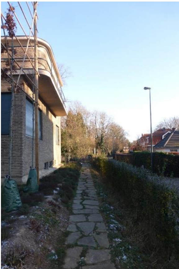
Foto 17: Pad langs de zuidoostgevel naar het noordelijke tuingedeelte.