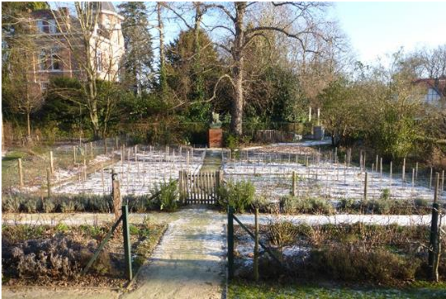
Foto 19: Recent toegevoegde moestuin op de locatie van de vroegere moestuin in de noordoostelijke tuinzone. Zicht vanaf de woning.