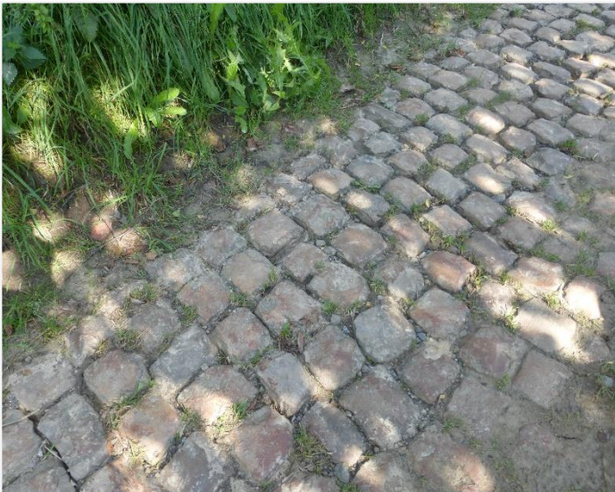
Foto 7: Detail kasseien met voskleurige patina en in halfsteensverband.