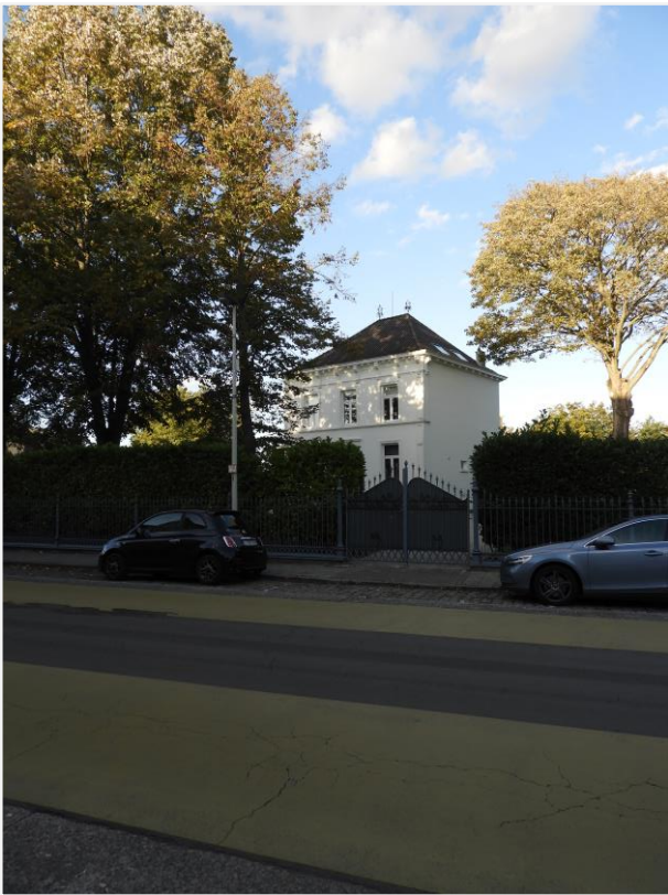
Foto 1: Neoclassicistisch landhuis met omliggende tuin, Dorpsstraat 36 Lier (Koningshooikt). Zicht van aan overzijde straat.