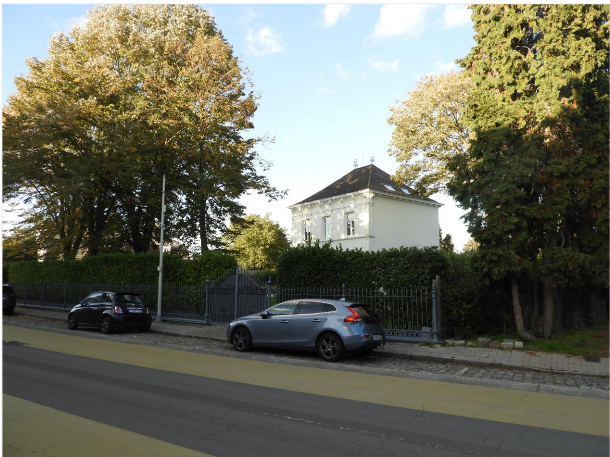
Foto 3: Neoclassicistisch landhuis met omliggende tuin, Dorpsstraat 36 Lier (Koningshooikt). Zicht van aan overzijde straat.