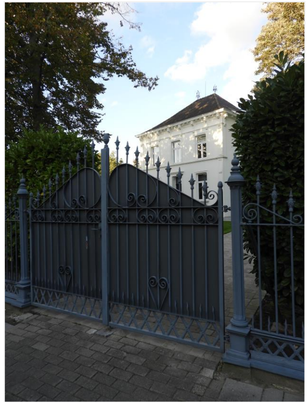
Foto 2: Neoclassicistisch landhuis met omliggende tuin, Dorpsstraat 36 Lier (Koningshooikt). IJzeren hekwerk en poort (rechts).