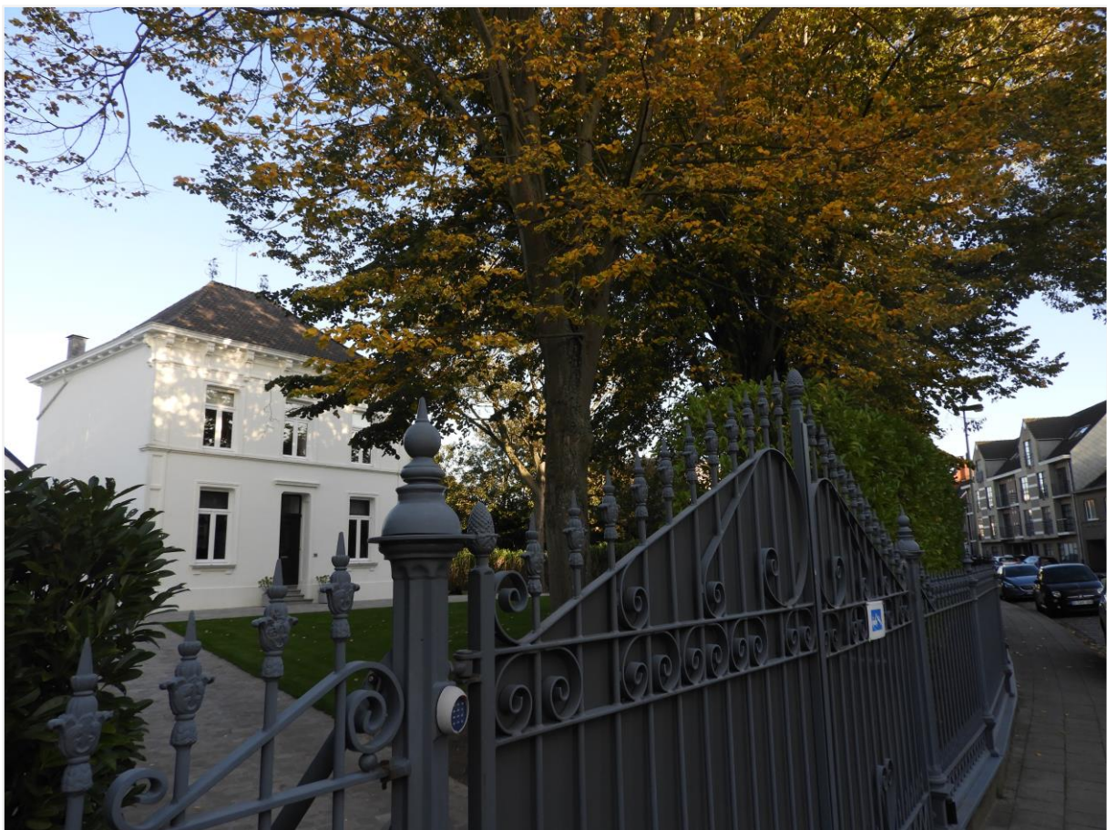
Foto 5: Neoclassicistisch landhuis met omliggende tuin, Dorpsstraat 36 Lier (Koningshooikt). Zicht heraanlegde voortuin met verharde oprit.