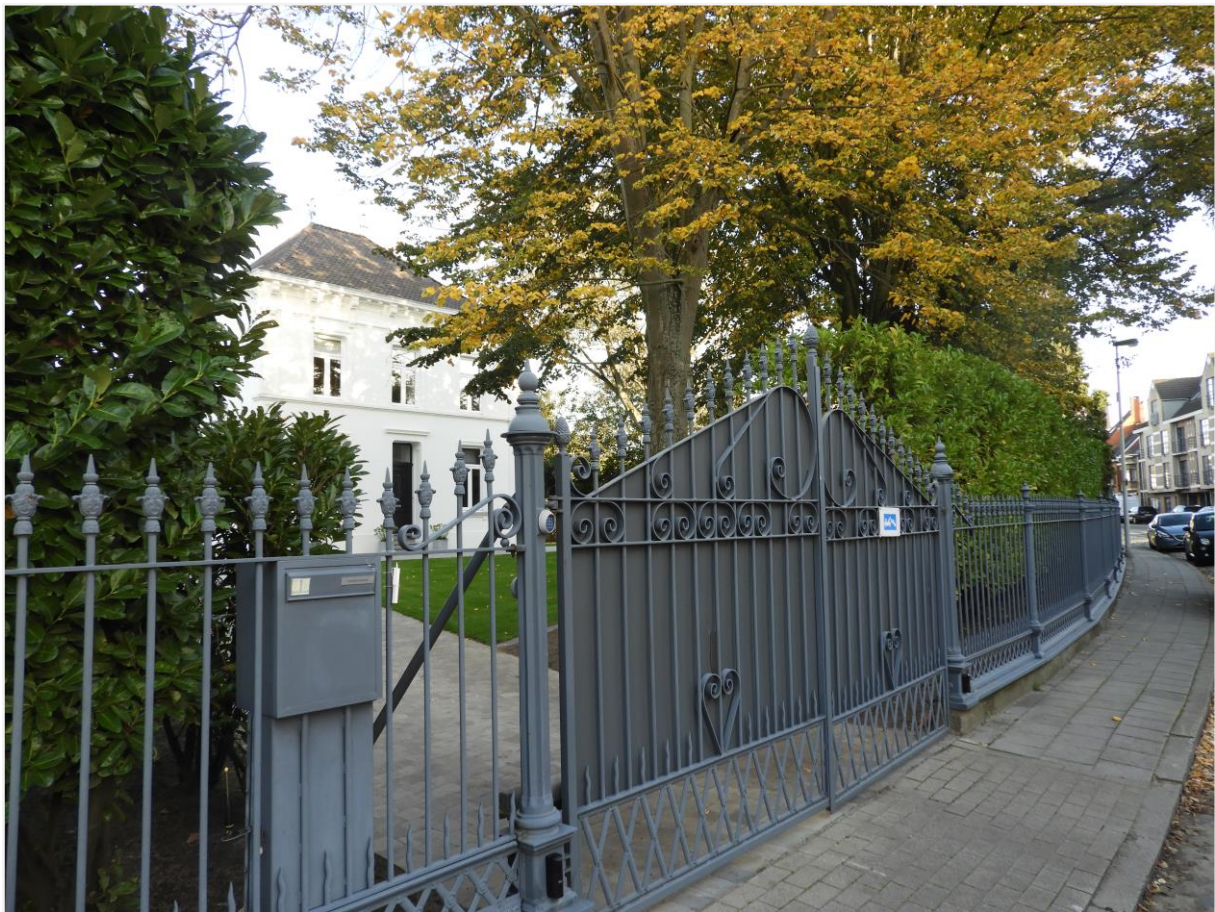
Foto 4: Neoclassicistisch landhuis met omliggende tuin, Dorpsstraat 36 Lier (Koningshooikt). IJzeren hekwerk en poort (links).