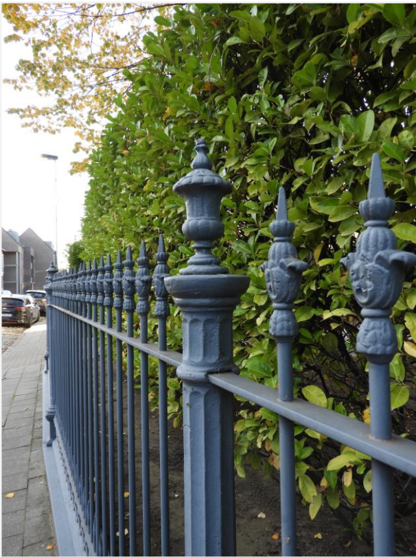
Foto 6: Neoclassicistisch landhuis met omliggende tuin, Dorpsstraat 36 Lier (Koningshooikt). Detail ijzeren hekwerk met gietijzeren tussenzuil en bekroningen.