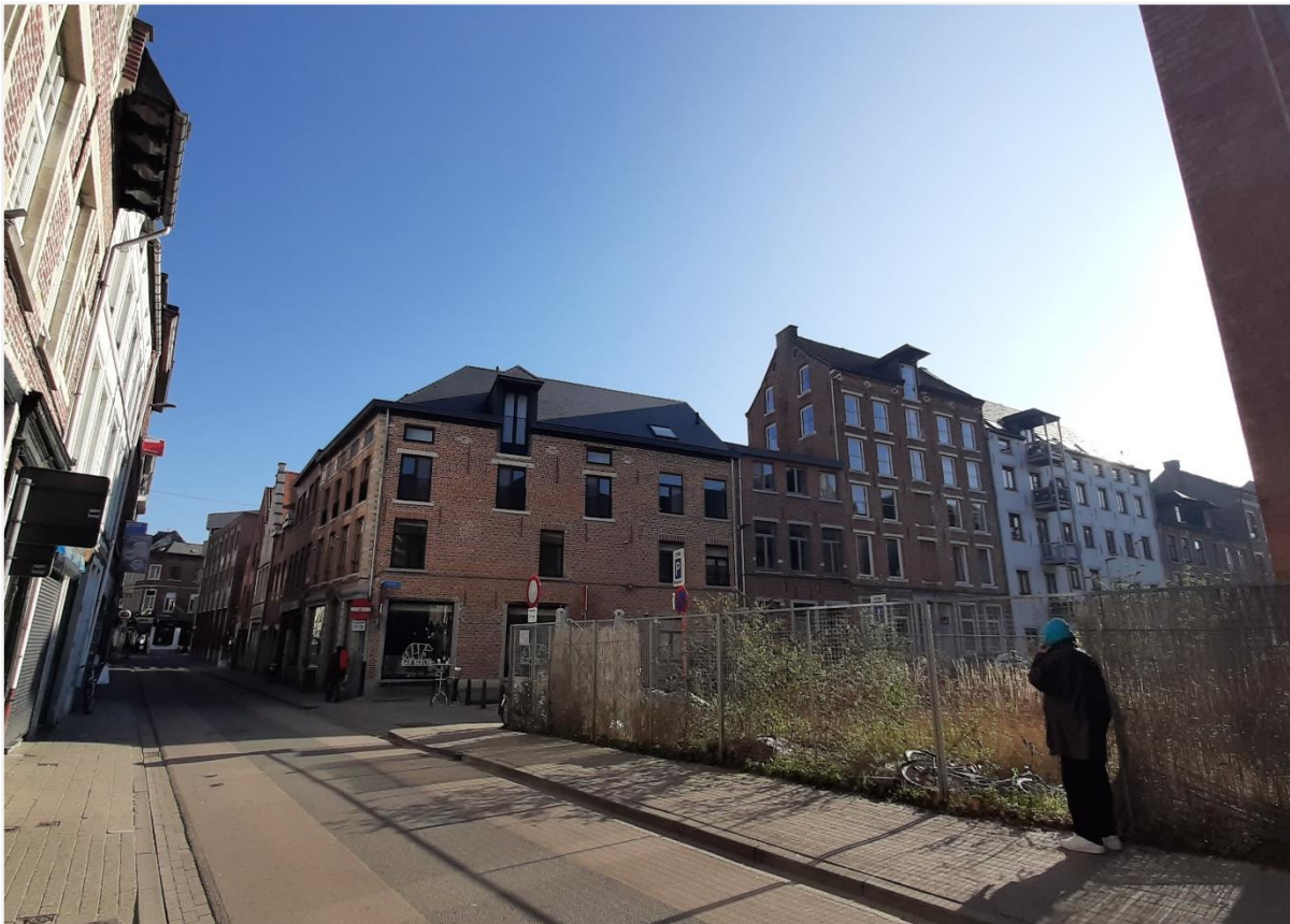
Foto 4: De hoek van de Brusselsestraat met de Wagenweg. Links zijn de pakhuizen te zien die mee beschermd zijn als de Beursgang.