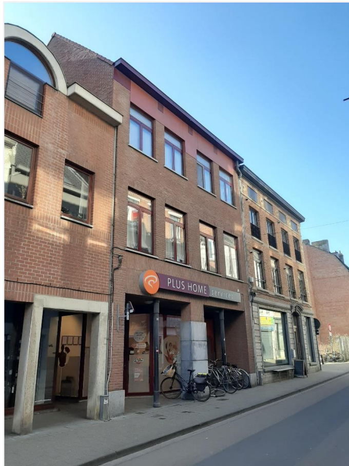
Foto 3: Brusselsestraat 111-113 en 115 op de hoek met de Wagenweg.