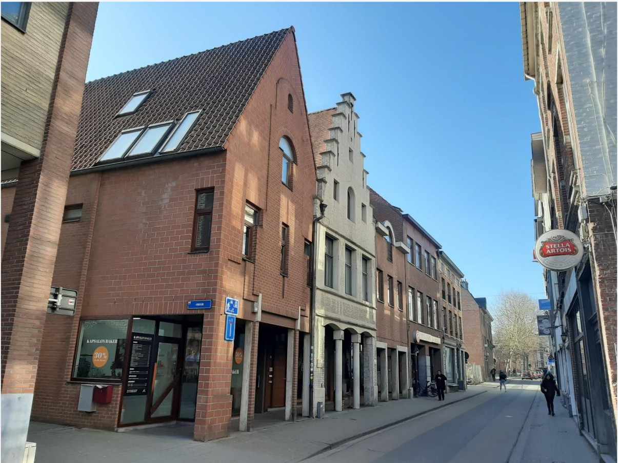
Foto 2: Uiterst links de Zongang. Daarnaast Brusselsestraat 105 tot en met 115.