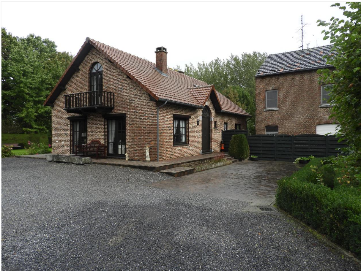
Foto 11: Niet-vergunde fermette van omstreeks 1990 (links) met restant woonhuis (rechts) van afgebroken vroeg-20ste-eeuwse hoevegebouwen, beschermd als 'kasteelsite'.