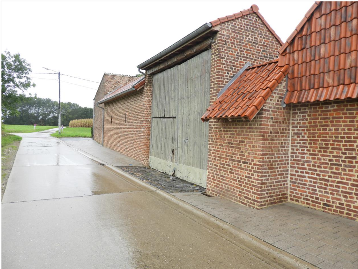
Foto 1: Kasteelhoeve de Montferrant voorgevel straatzijde de Montferrantstraat 2 Batsheers.