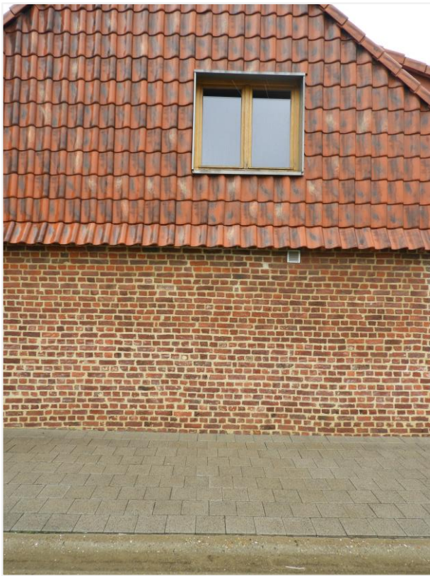
Foto 3: Detail gerestaureerde zuidgevel (straat) stallingen kasteelhoeve de Montferrant.