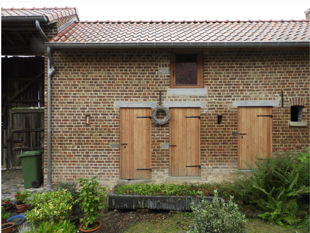
Foto 6: Zicht gerestaureerde kleine stallingen en stockageruimte kasteelhoeve de Montferrant (© Onroerend Erfgoed 26 september 2022).