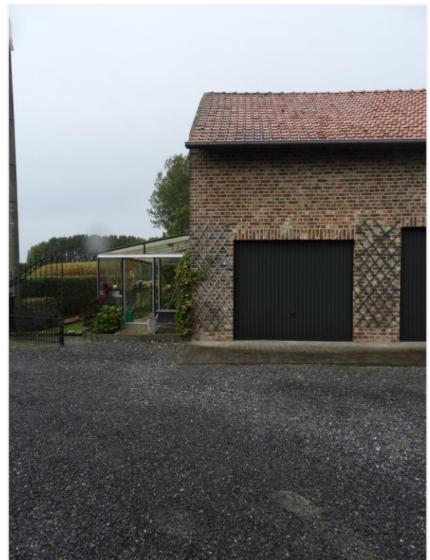
Foto 13: Detail verbouwde schuur van 1913 met nieuwe muuropeningen en aangebouwde serre.