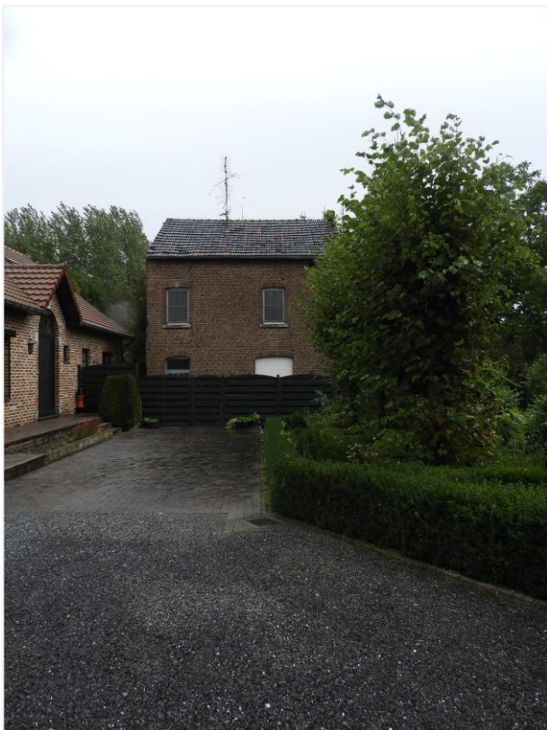
Foto 12: restant woonhuis (rechts) van afgebroken vroeg-20ste-eeuwse hoevegebouwen, aangeduid als 'torenachtig gebouw'.