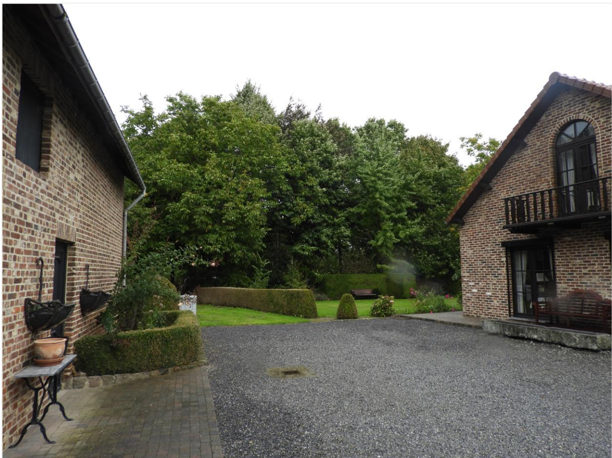
Foto 15: Zicht op tuin achter niet-vergunde fermette van omstreeks 1990 (© Onroerend Erfgoed 26 september 2022).