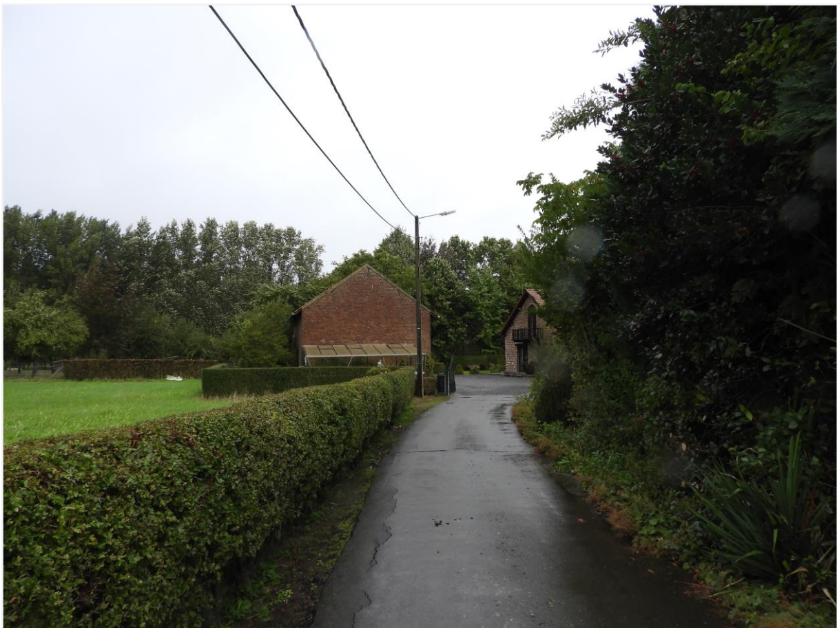
Foto 18: Verharde insteekweg die toegang geeft tot de Montferrantstraat 4.