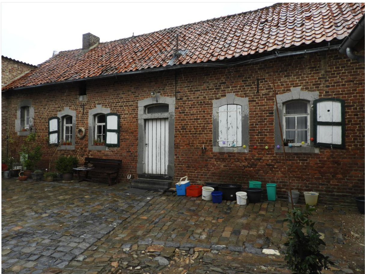
Foto 7: Woonhuis kasteelhoeve de Montferrant (© Onroerend Erfgoed 26 september 2022).