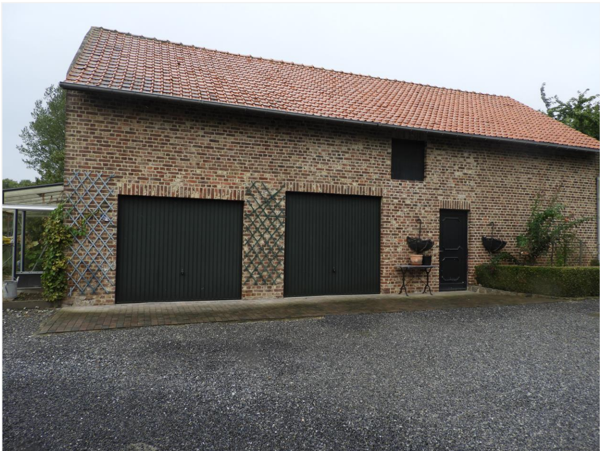
Foto 14: Verbouwde schuur van 1913 met nieuwe muuropeningen en vernieuwde draagstructuur in beton.