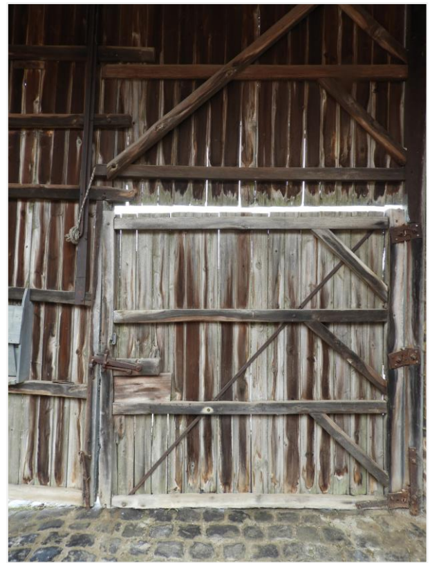
Foto 4: Detail toegangspoort binnenaanzicht koer kasteelhoeve de Montferrant.