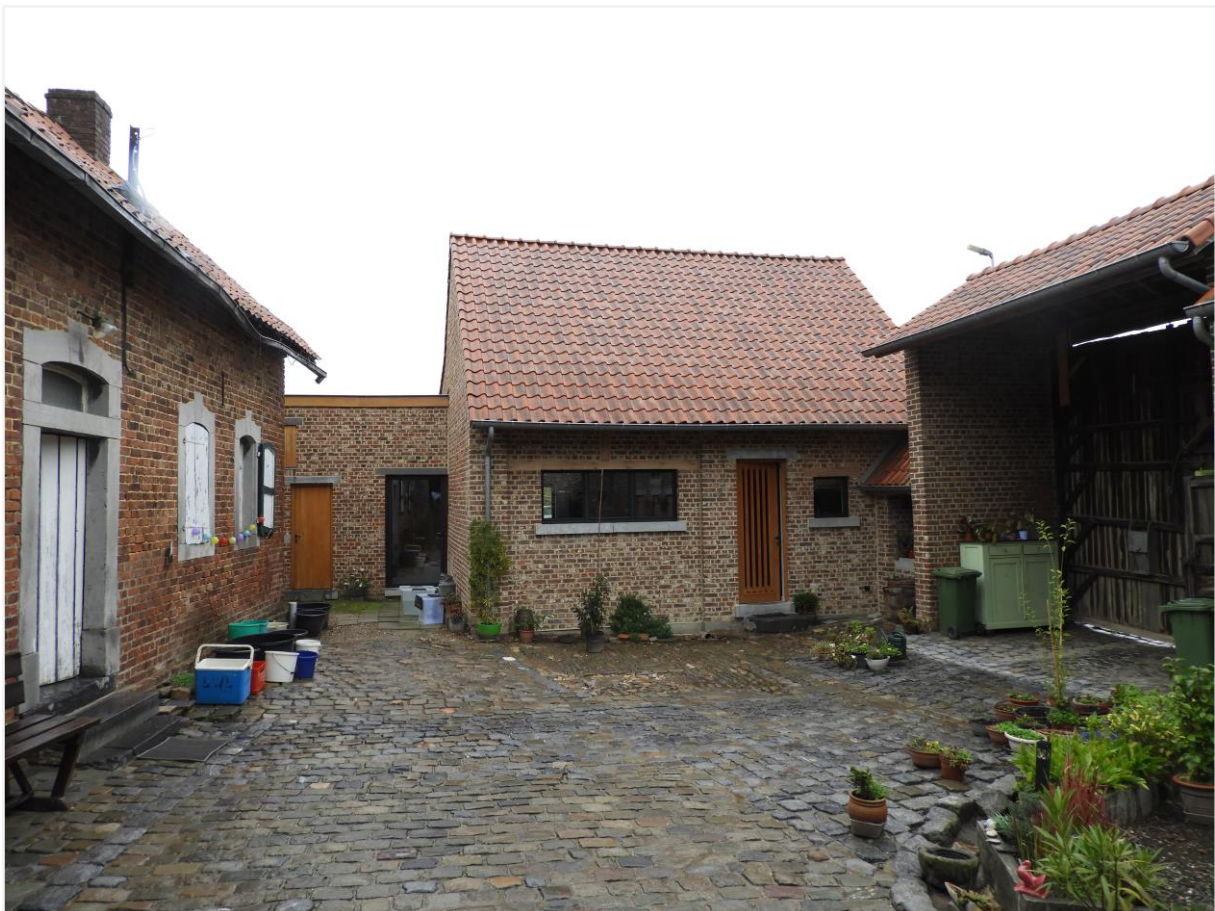
Foto 5: Zicht gekasseide koer kasteelhoeve de Montferrant met gerestaureerde hoevegebouwen (v.l.n.r. stallingen, pomphuis en poortgebouw) (© Onroerend Erfgoed 26 september 2022).