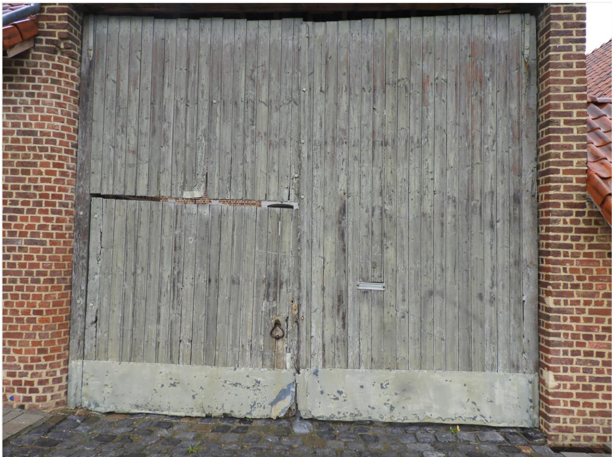
Foto 2: Detail toegangspoort kasteelhoeve de Montferrant.