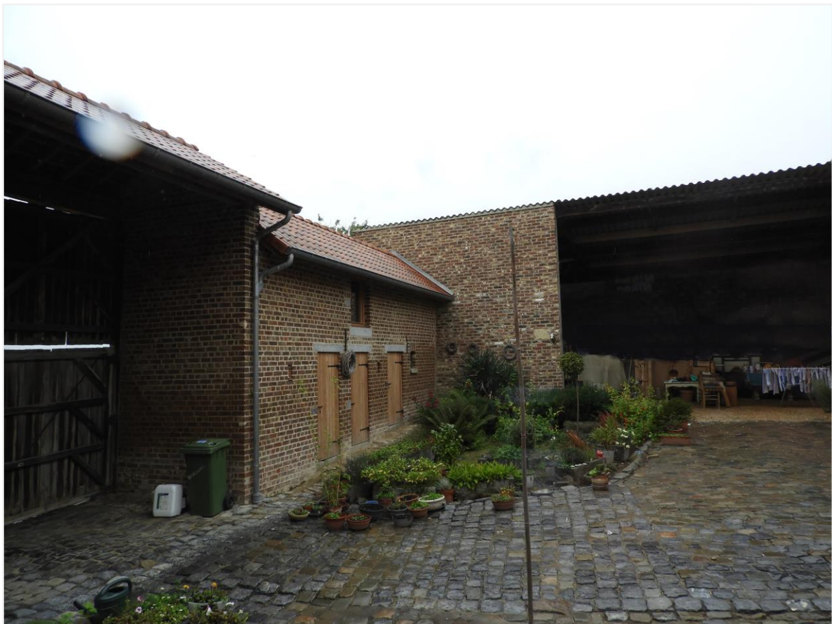
Foto 10: Zicht gekasseide koer kasteelhoeve de Montferrant (v.l.n.r. gerestaureerd poortgebouw en kleine stallingen en schuur).