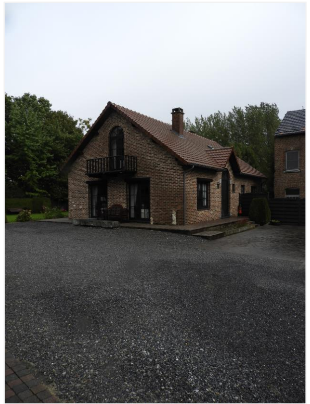
Foto 17: Zicht op niet-vergunde fermette van omstreeks 1990 (© Onroerend Erfgoed 26 september 2022).