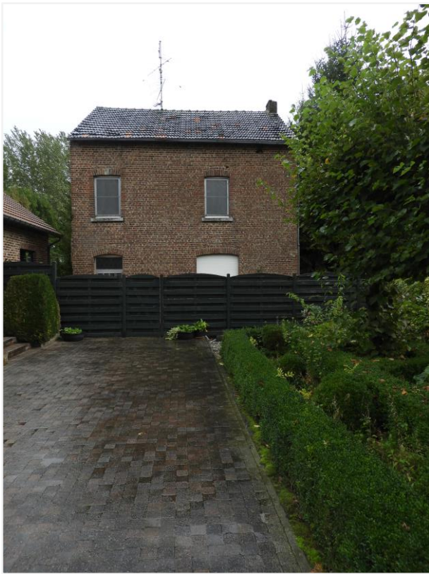
Foto 16: Zicht op restant woonhuis van afgebroken vroeg-20ste-eeuwse hoevegebouwen (© Onroerend Erfgoed 26 september 2022).