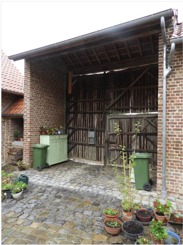
Foto 8: Poortgebouw kasteelhoeve de Montferrant.