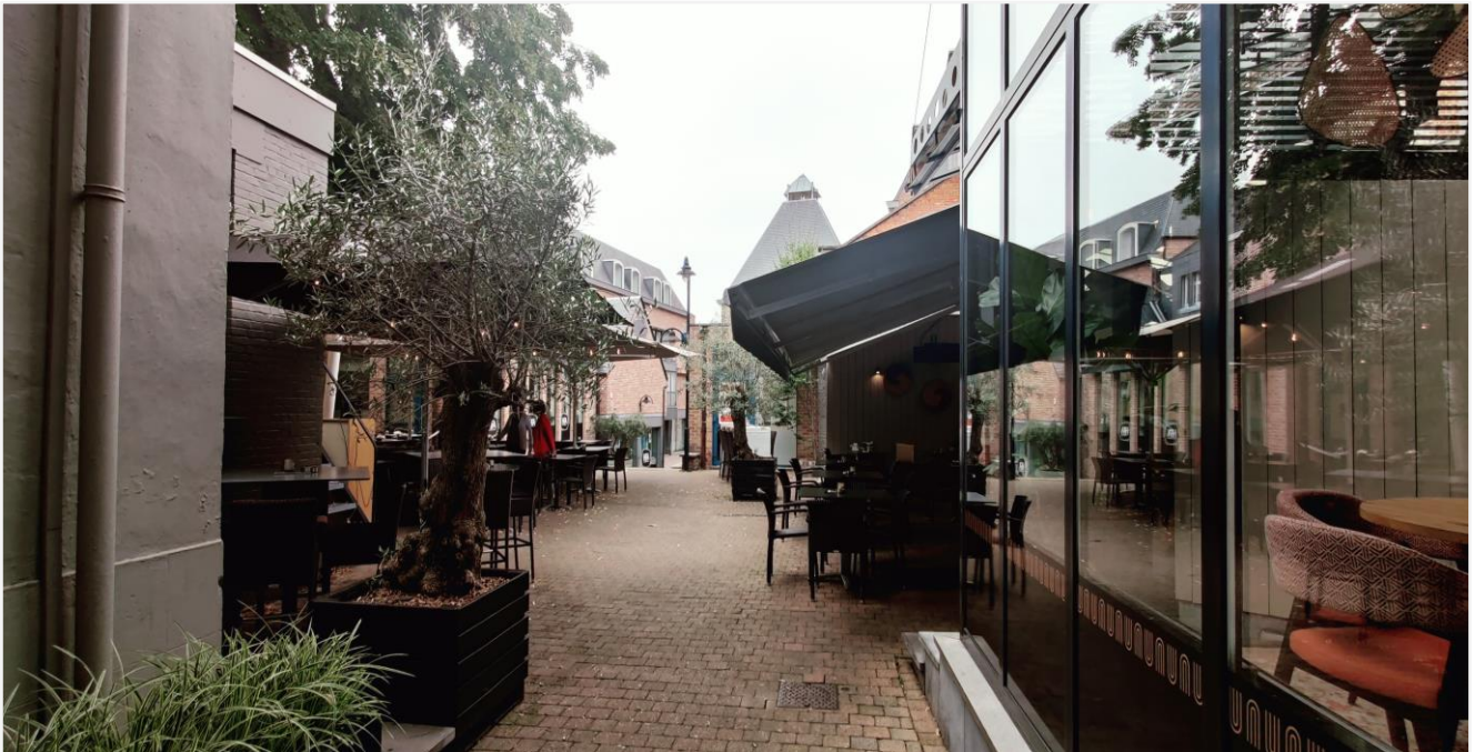
Foto 9: vanuit poortdoorgang zicht op de publieke passage naar de Molenpoort