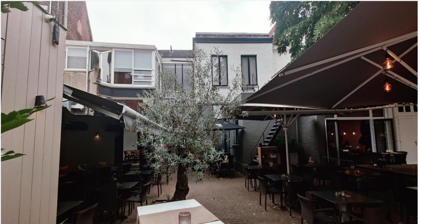
Foto 6: zicht op achtergevel met publieke passage (poortdoorgang) en aan weerszijden terrassen