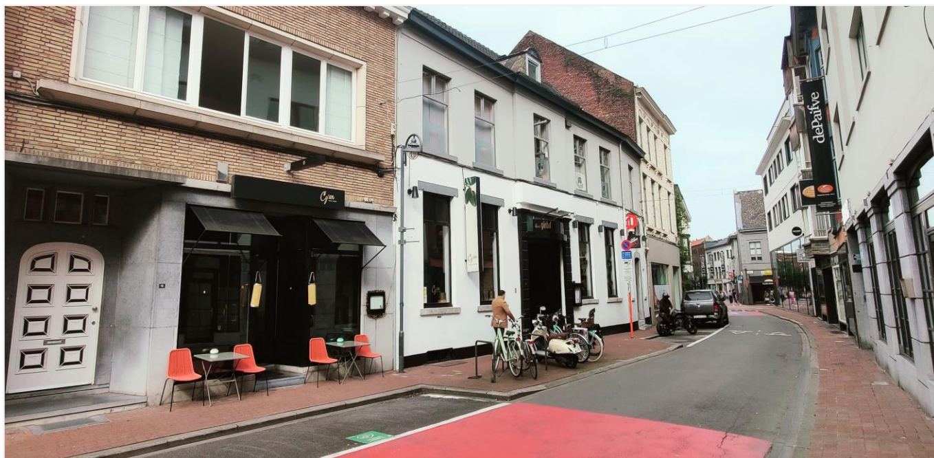
Foto 1: straatbeeld: voormalige burgerhuis, Minderbroedersstraat 9-11 met links pand nummer 13 waarmee 9-11 intern verbonden is