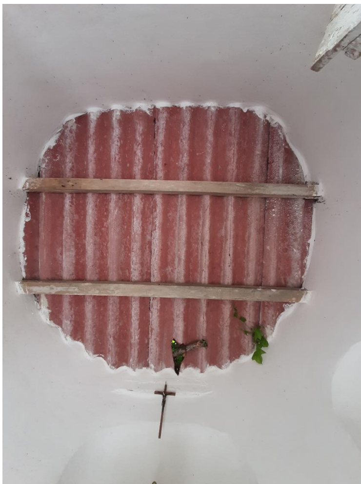
Foto 11: overdekking van het interieur van de kapel met golfplaat