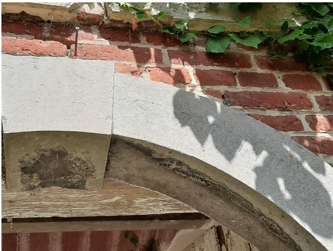
Foto 6: opschrift 'St Josephus' op de hardstenen booglijst in de voorgevel van de kapel