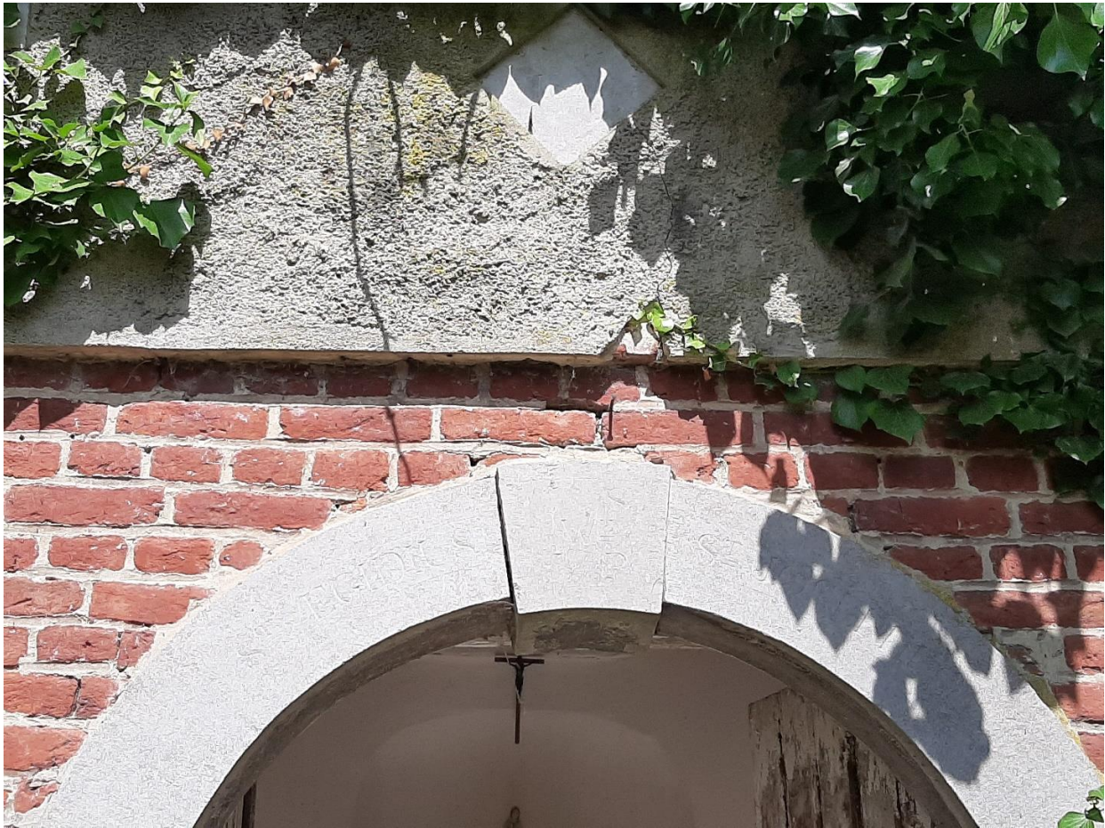
Foto 4: hardstenen booglijst en sluitsteen in de voorgevel van de kapel