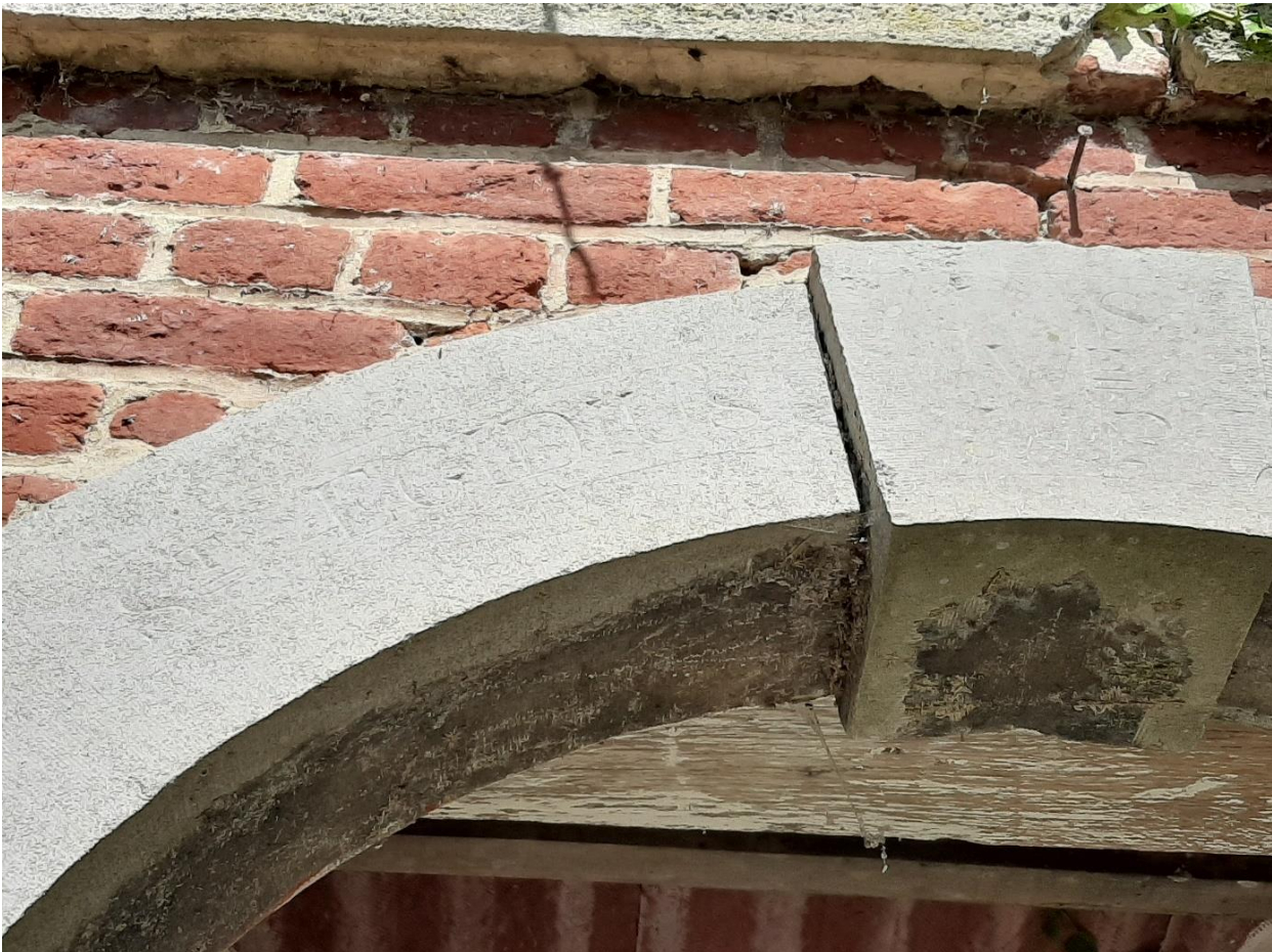
Foto 5: opschrift 'St Egidius' op de hardstenen booglijst in de voorgevel van de kapel