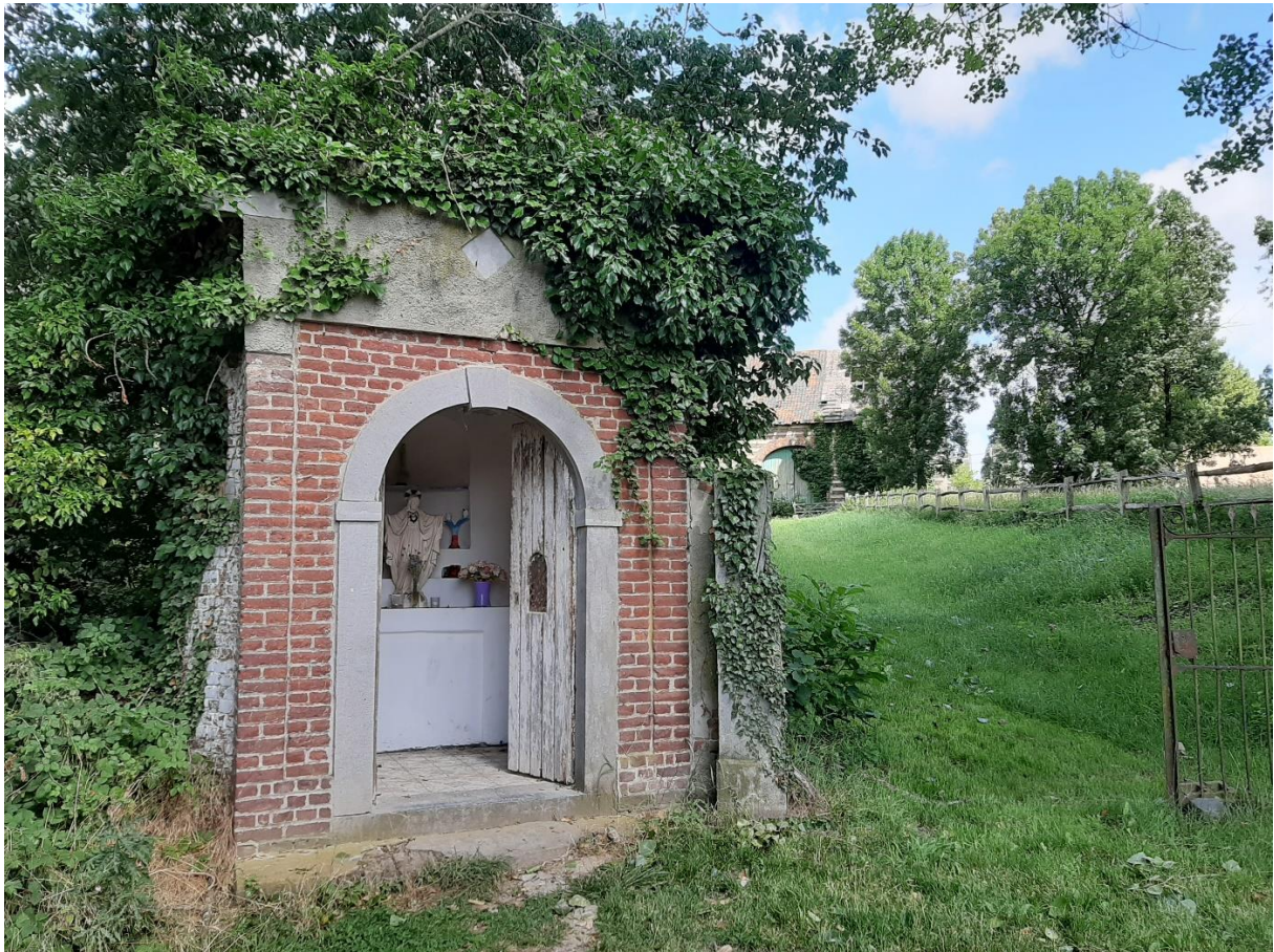
Foto 1: de kapel Onze-Lieve-Vrouw en een deel van het hek van de hoeve Kuesses