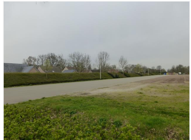
Foto 8: Groene buffer voor de woningen langs de Leukeneindestraat gezien van op de Eikenlaan.