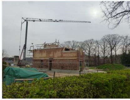
Foto 2: Verkaveling aan Herenhoef met de Damburghoeve op de achtergrond.