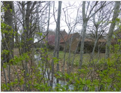
Foto 1: De Damburghoeve met omgrachting gezien van op de Eikenlaan.