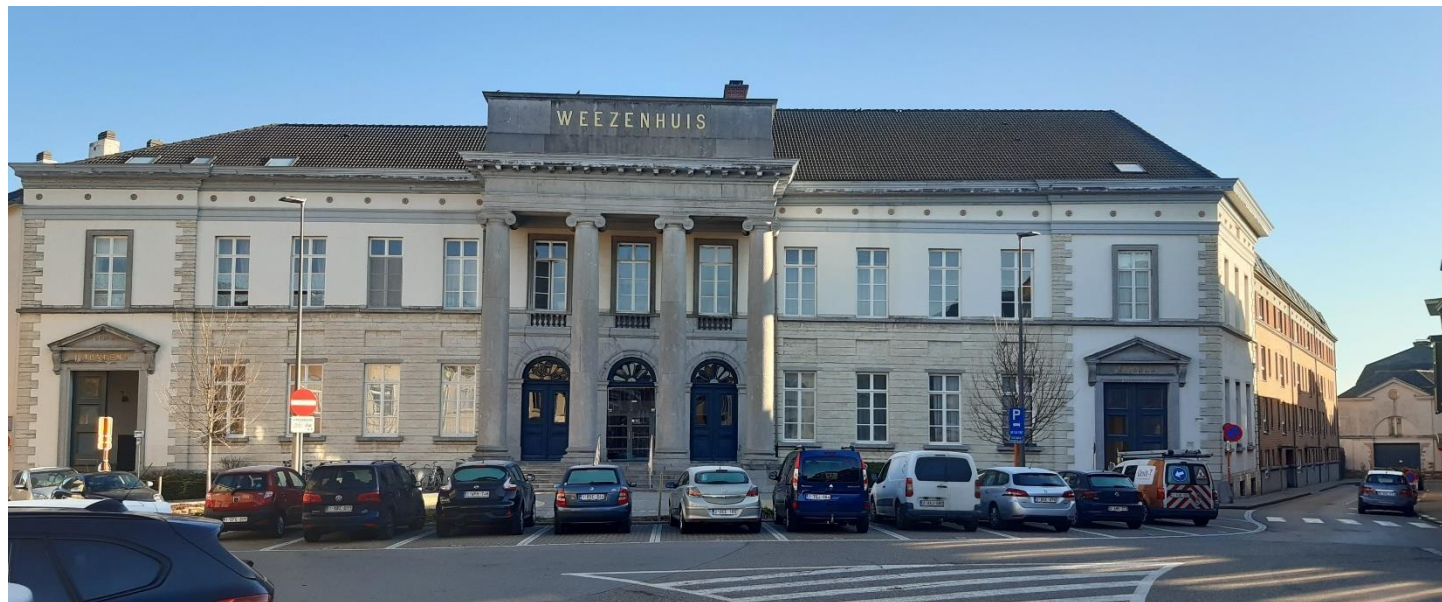
Foto 1: weeshuis vanop Kapucijnenplein met rechts poortgebouw (28 februari 2023).