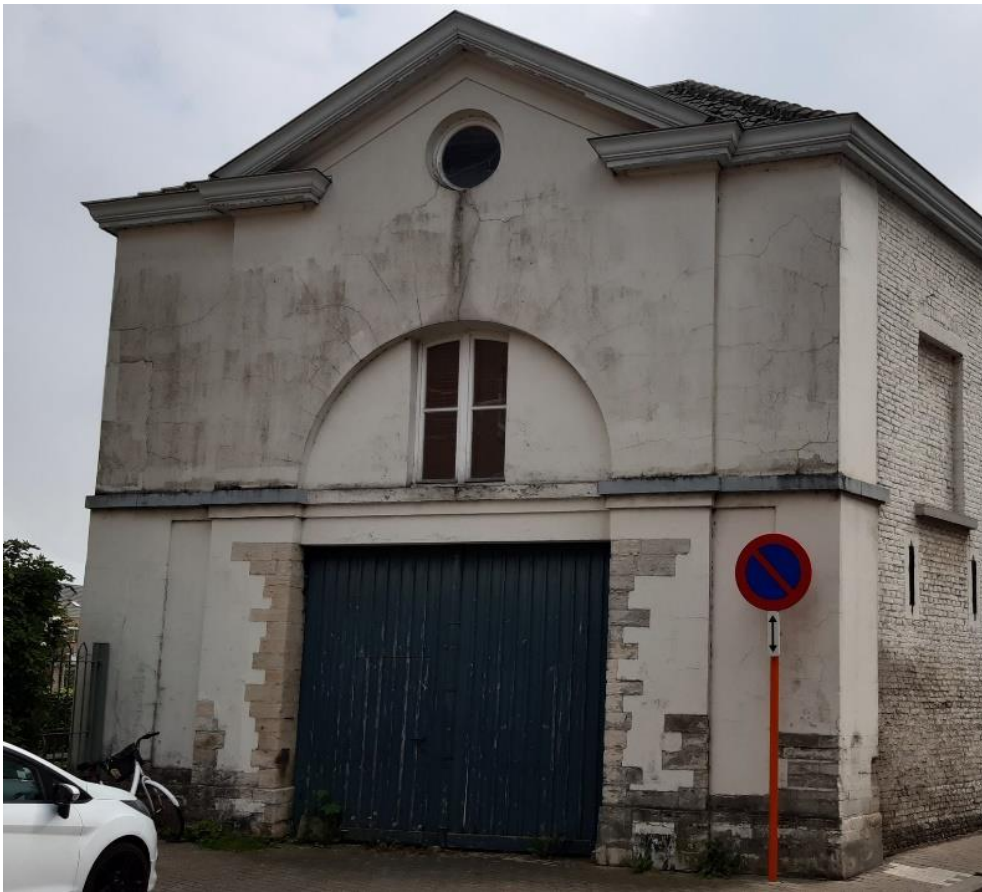
Foto 18: voorgevel van het poortgebouw, Kapucijnenstraat (5 mei 2022).