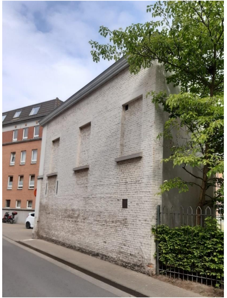
Foto 21-22: zuidelijke zijvleugel van weeshuis en zijgevel van poortgebouw, Kapucijnenstraat (5 mei 2022).