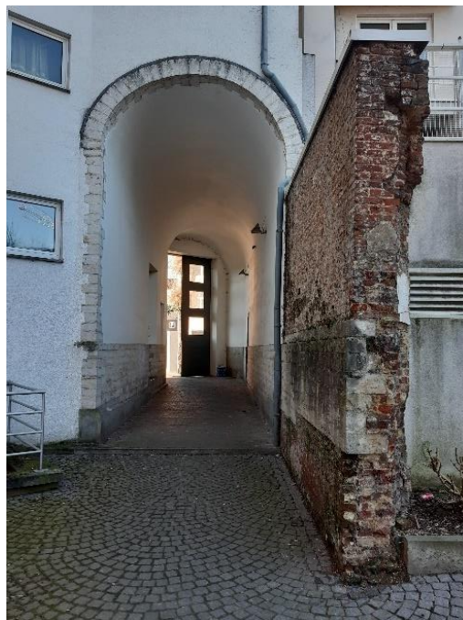
Foto 12: zuidelijke doorgang (28 februari 2023). Foto 13: noordelijke doorgang (28 februari 2023).