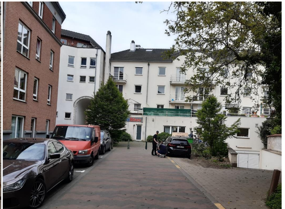
Foto 20: achterzijde Kapelstraat (rechts) en deel van weeshuis met noordelijke zijvleugel (links) (5 mei 2022).