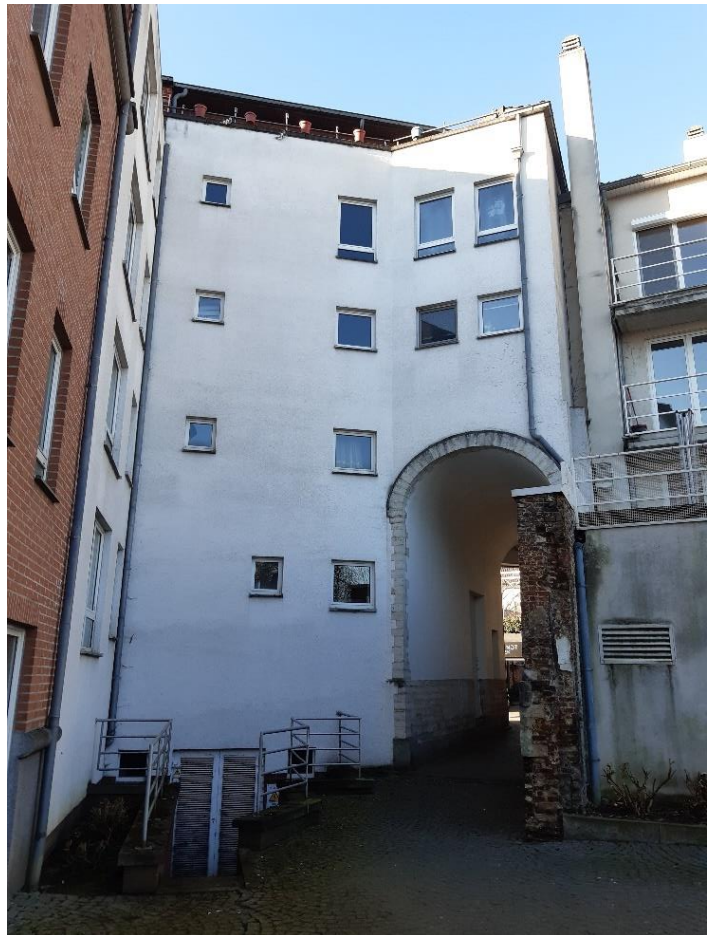
Foto 16-17: achtergevel van weeshuis met respectievelijk zuidelijke en noordelijke doorgang (28 februari 2023).