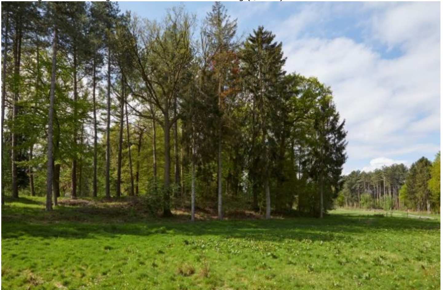
Figuur 4 – Zicht op de omwalling van het kasteel van Grevenbroek