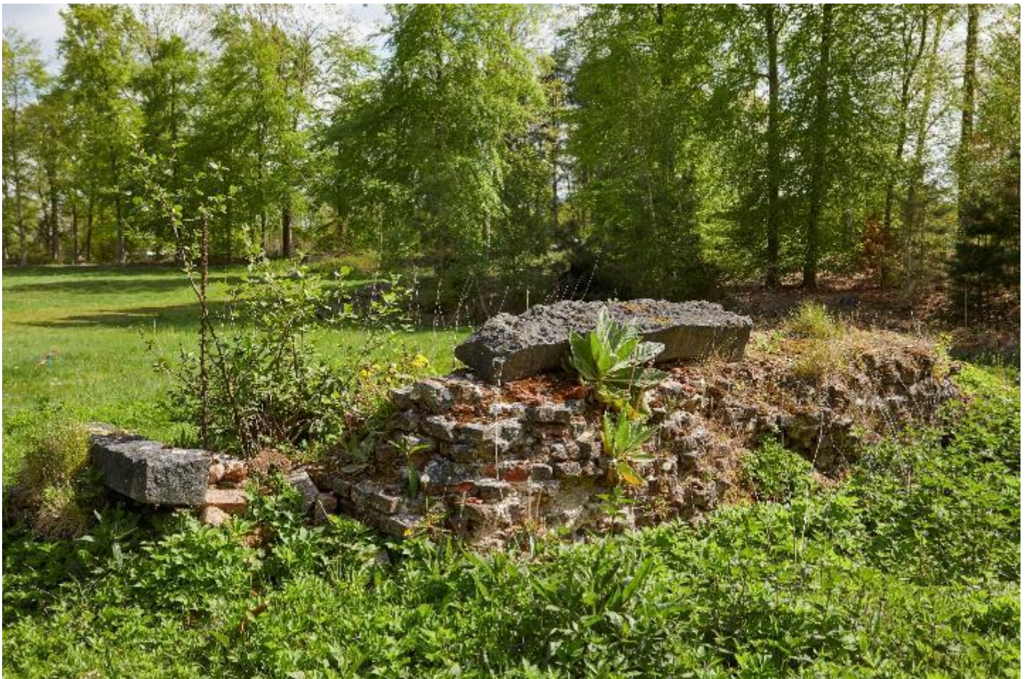
Figuur 10 – Vermoedelijk restant van een originele bakstenen muur