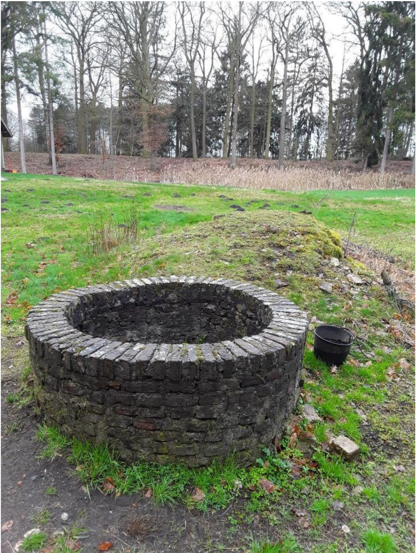
Figuur 13 – Vermoedelijk recente, bakstenen waterput