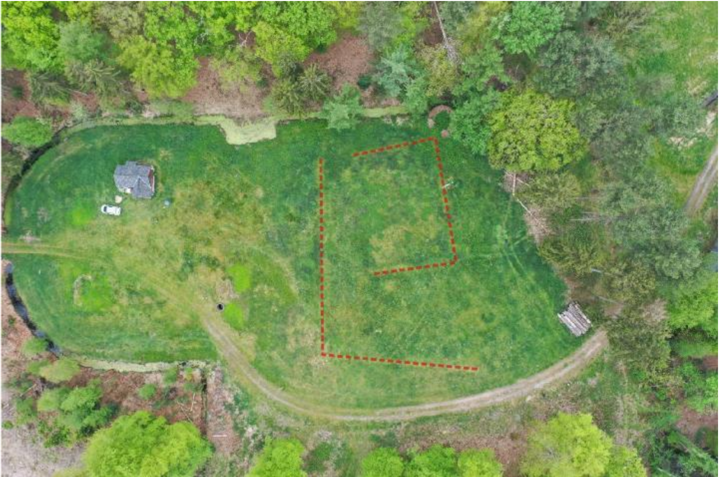
Figuur 5: Aanduiding van de verschillen in vegetatie die wijzen op de aanwezigheid van muurresten