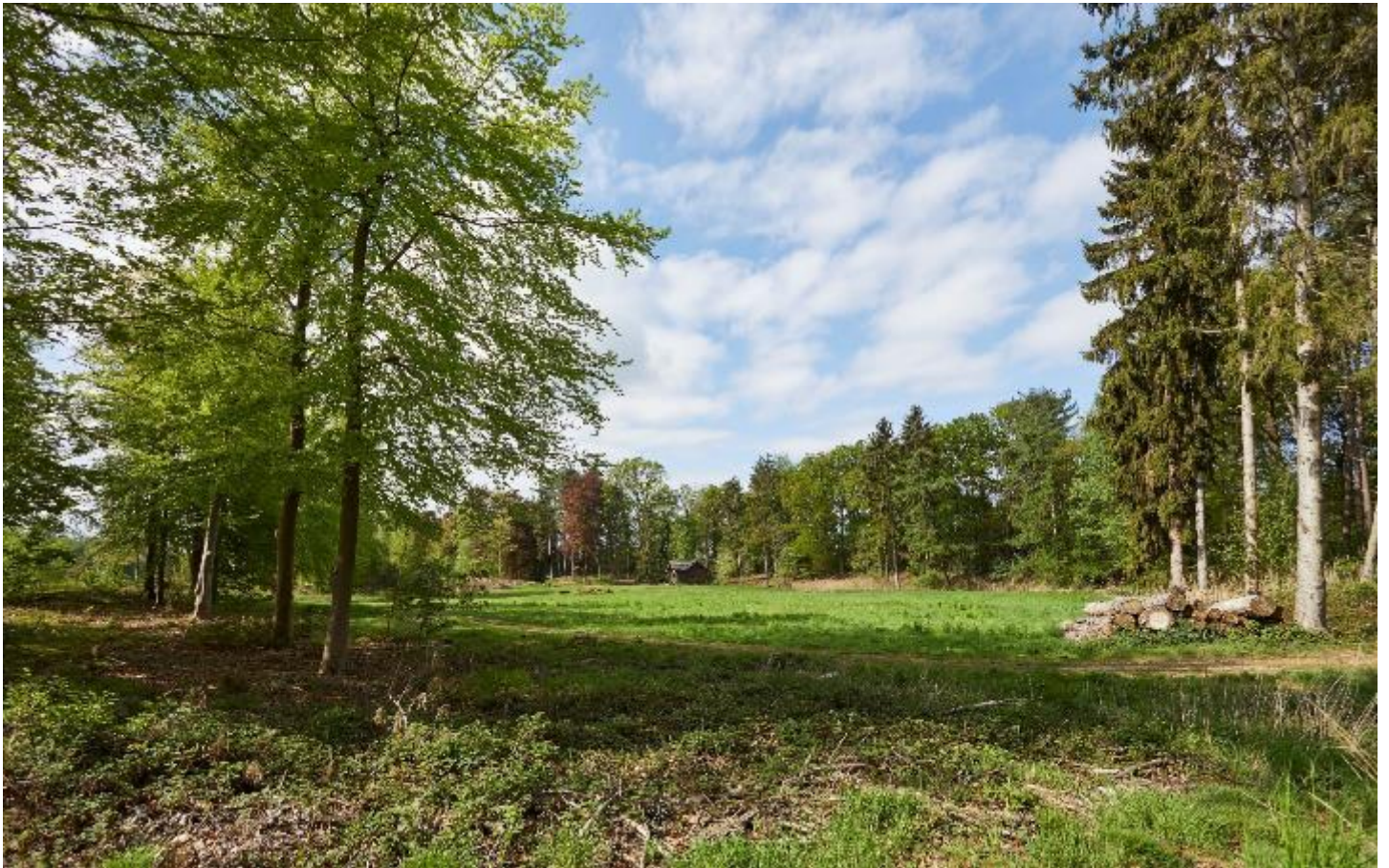
Figuur 1 – Algemeen zicht op de kasteelsite