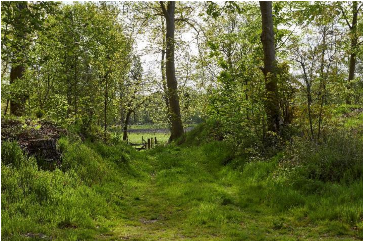
Figuur 8 – Doorbraak in de omwalling aan de oostzijde