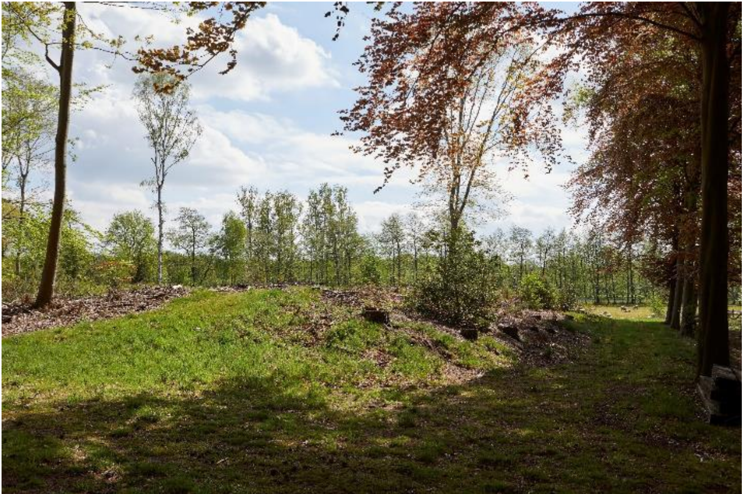
Figuur 9 – Doorbraak in de omwalling aan de zuidzijde