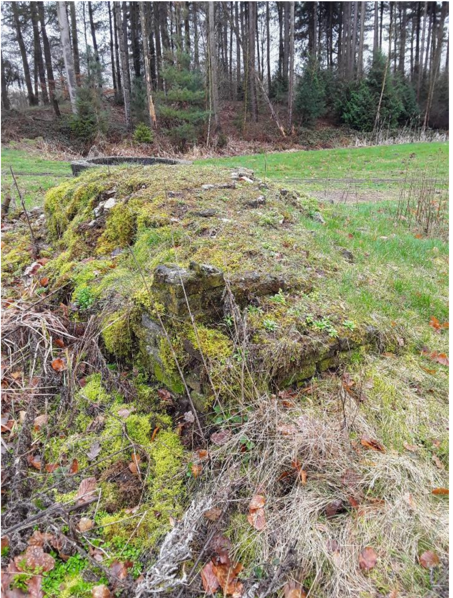
Figuur 11 – Vermoedelijk restant van een originele bakstenen muur