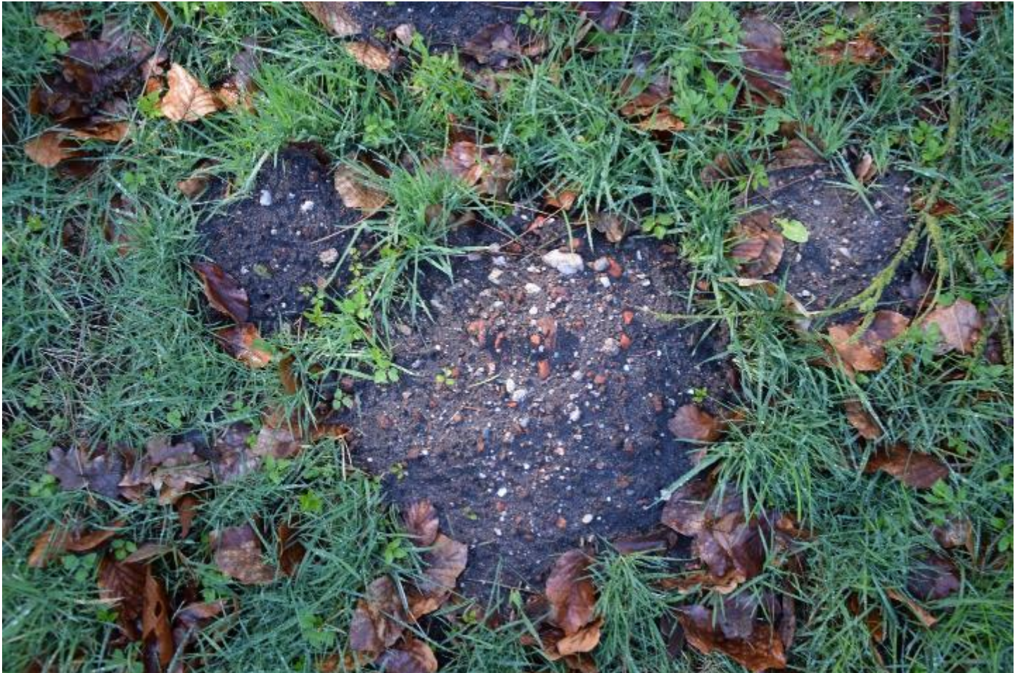
Figuur 15 – Molshopen met baksteen- en mortelfragmenten