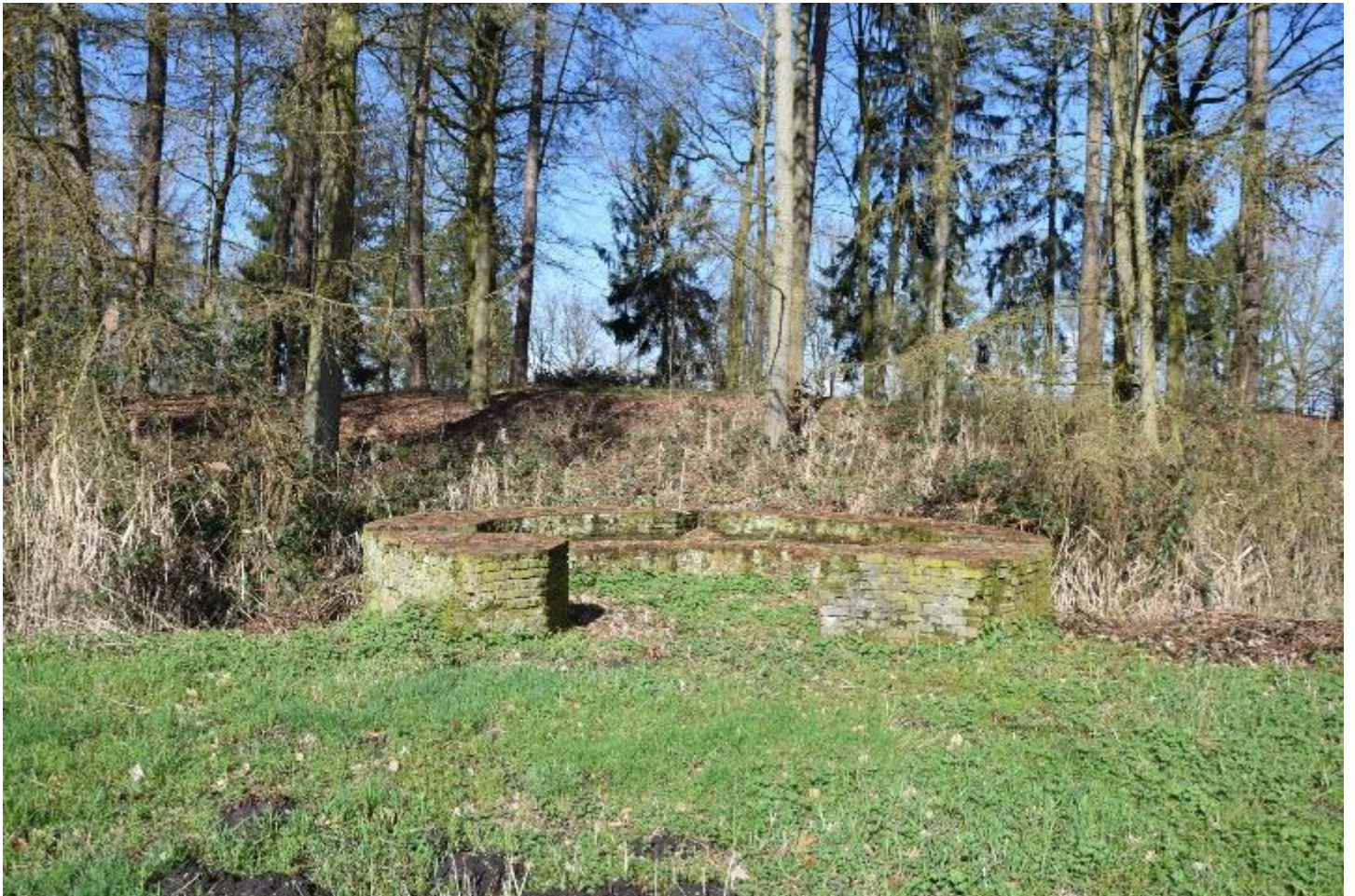
Figuur 14 – Gereconstrueerd, laag, bakstenen torentje, met op de achtergrond de omwalling