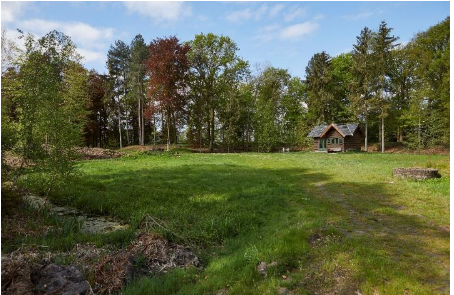
Figuur 12 – Zicht op de site binnen de omwalling met de chalet op de achtergrond