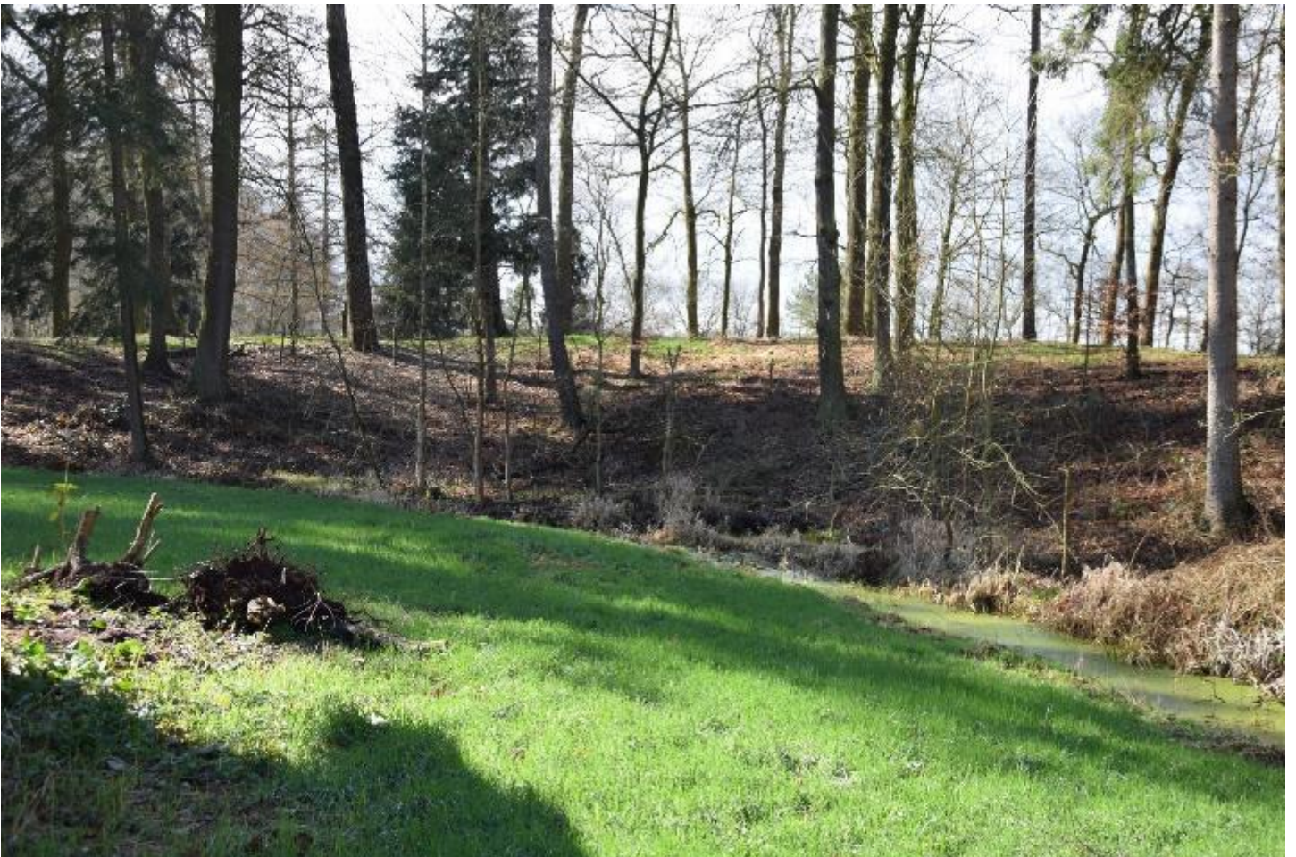
Figuur 6 – Zicht op de omwalling met gracht