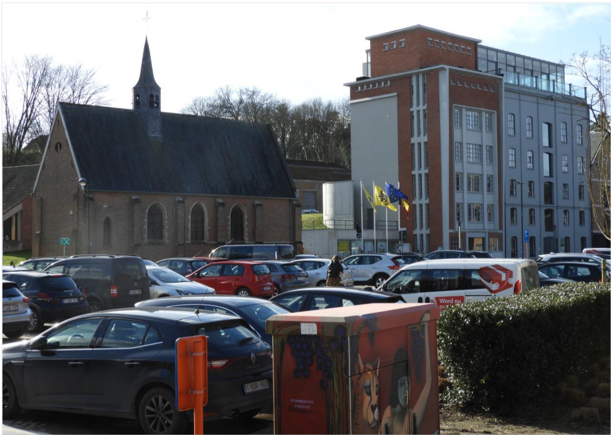
Foto 2: Voorzijde (noord) van het beschermd landschap van de Begijnhofkapel, bestaande uit een parking. Rechts het gemeentehuis van Overijse, gevestigd in de Vuurmolen