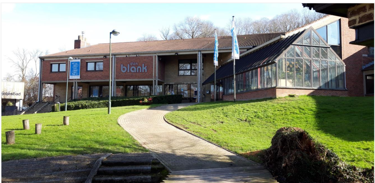
Foto 7: Cultureel Centrum Den Blank