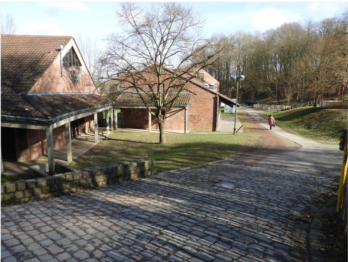
Foto 5: Zuidgrens van het beschermd landschap, bestaande uit de bibliotheek en de aanzet van het cultureel centrum, Den Blank