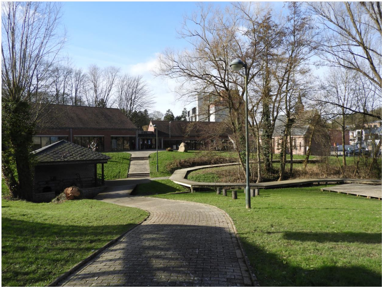
Foto 6: Zicht op het in 1984 aangelegd parkje bij het cultureel centrum Den Blank. De afbakening van het beschermd landschap (van rechts naar links in het midden van de foto) volgt een oude perceelsgrens die nu niet meer herkenbaar is.