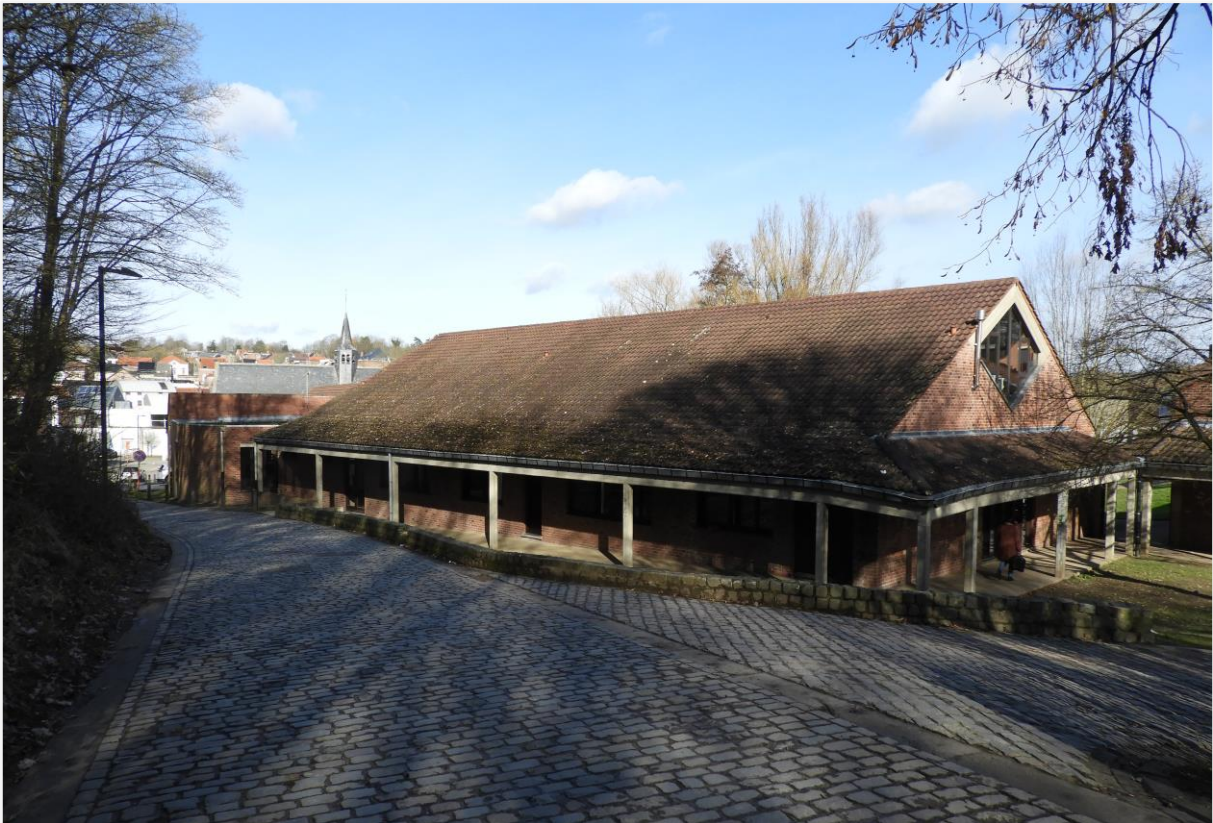
Foto 4: Bibliotheek van Overijse, in 1984 gebouwd in het beschermd landschap 'Begijnhofkapel en omgeving'