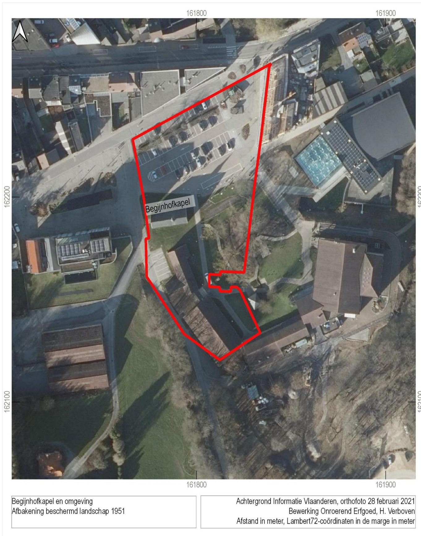
Foto 1: Begijnhofkapel en omgeving op luchtfoto, 28 februari 2021