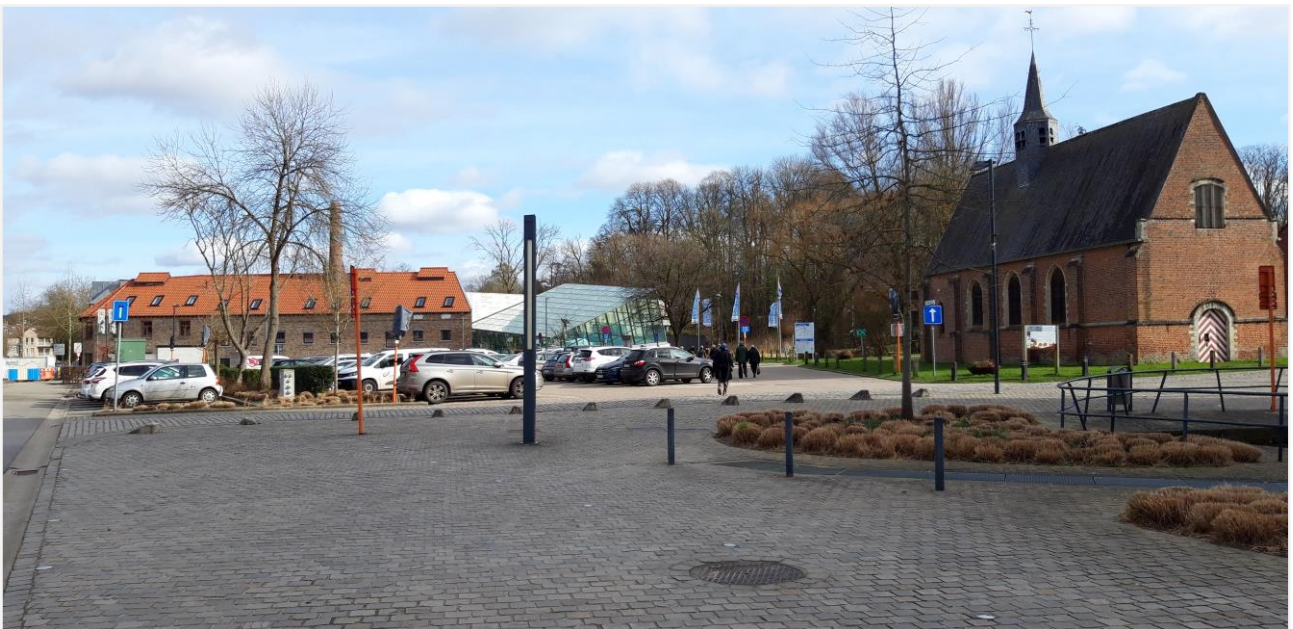
Foto 8: Begijnhofkapel met parking aan de noordzijde van het beschermd landschap. Het glazen volume in de achtergrond is het gemeentelijk zwembad (valt buiten de beschermingsperimeter).