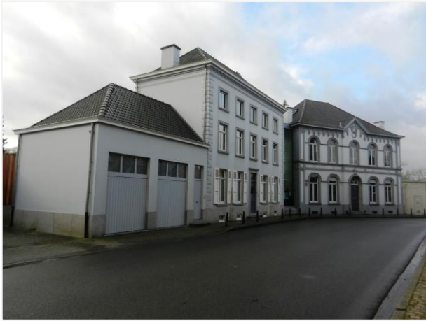
Foto 1: Plaats van de gesloopte woning met de winkelpui, nu een dubbele garage.