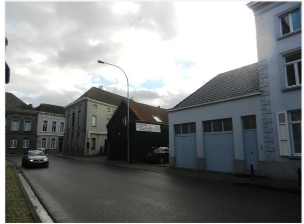
Foto 2: Plaats van de gesloopte woning met de winkelpui, nu een dubbele garage.