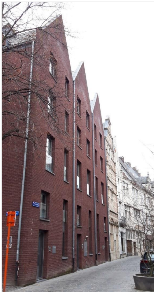
Foto 2: Nieuwbouwproject van het "Eerste Gebod" (beschermd als monument, wordt opgeheven), het "Tweede Gebod" en het "Derde Gebod" – rechts aansluitend de als monument beschermde nog oorspronkelijke panden van de "Tien Geboden". Het geheel is gevat in een beschermd stadsgezicht.