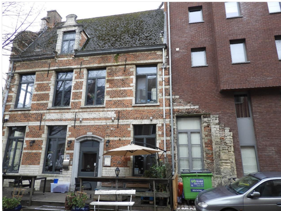
Foto 6: Het nieuwbouwproject van het "Eerste Gebod" (beschermd als monument, wordt opgeheven) – links aansluitend hoekhuis Onder de Toren (Halfmaartstraat 2) – de linker travee van de zijgevel van het "Eerste Gebod" is op de begane grond deels bewaard en geïntegreerd in het nieuwbouwproject.