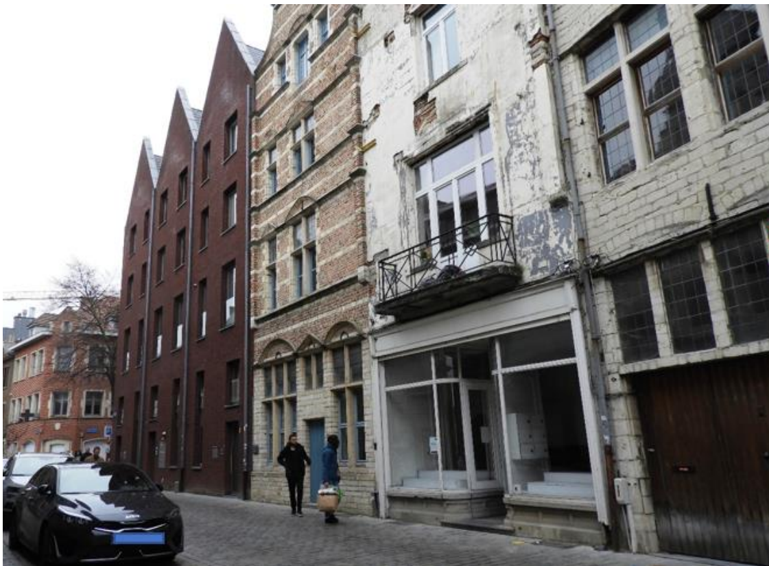
Foto 3: Het nieuwbouwproject van het "Eerste Gebod" (beschermd als monument, wordt opgeheven), het "Tweede Gebod" en het "Derde Gebod" – rechts aansluitend de als monument beschermde nog oorspronkelijke panden van de "Tien Geboden".