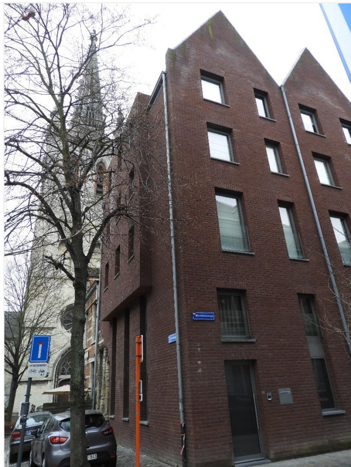
Foto 4: Het nieuwbouwproject van het "Eerste Gebod" (beschermd als monument, wordt opgeheven), op de hoek met de Halfmaartstraat – zicht op de toren van de Sint-Geertruikerkerk.