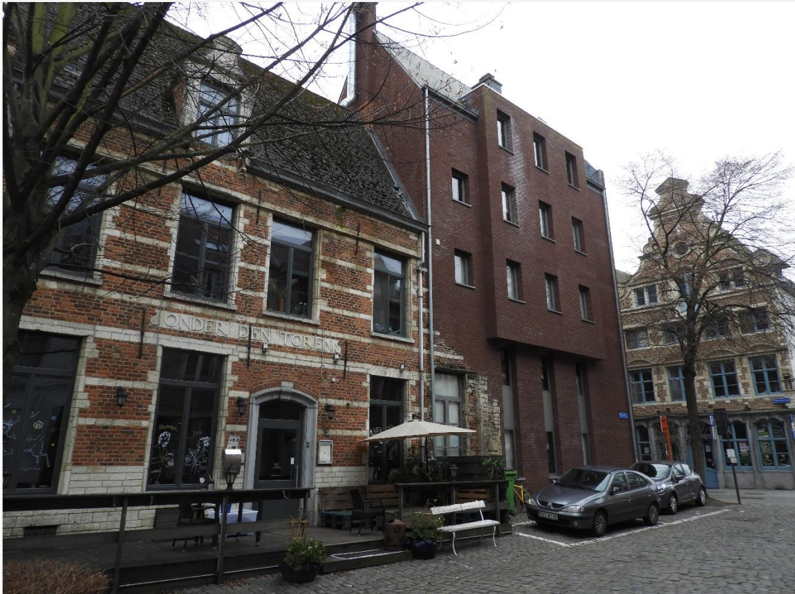
Foto 5: Het nieuwbouwproject van het "Eerste Gebod" (beschermd als monument, wordt opgeheven), op de hoek met de Halfmaartstraat – links aansluitend hoekhuis Onder de Toren (Halfmaartstraat 2, opgenomen in het stadsgezicht).