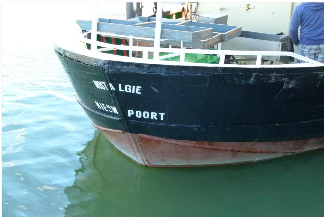
Foto 5: de achterplecht met de spitse ellipsvormige uitbouw boven roer en schroef (foto genomen op 25 september 2015)