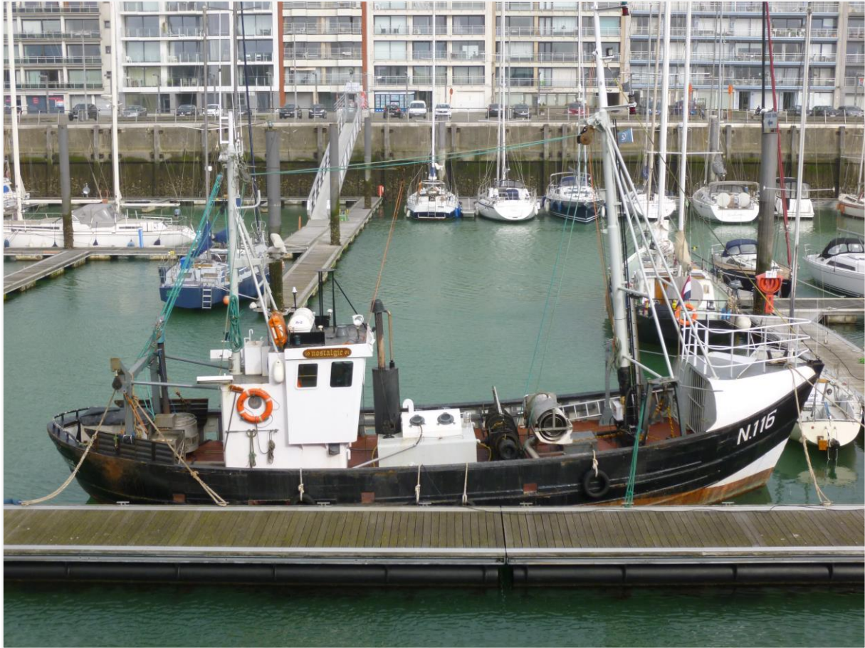
Foto 13: overzicht vanaf stuurboordzijde: voorschip met stormkap, voormast, midscheeps: lieren en uitbouw met bovenlichten machineruim, stuurhut met achtermast, achterschip met borden