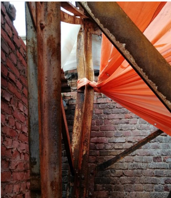
Foto 5: Vervormingen aan de het staalskelet (voet hoek oost-zuid, 29 oktober 2020)