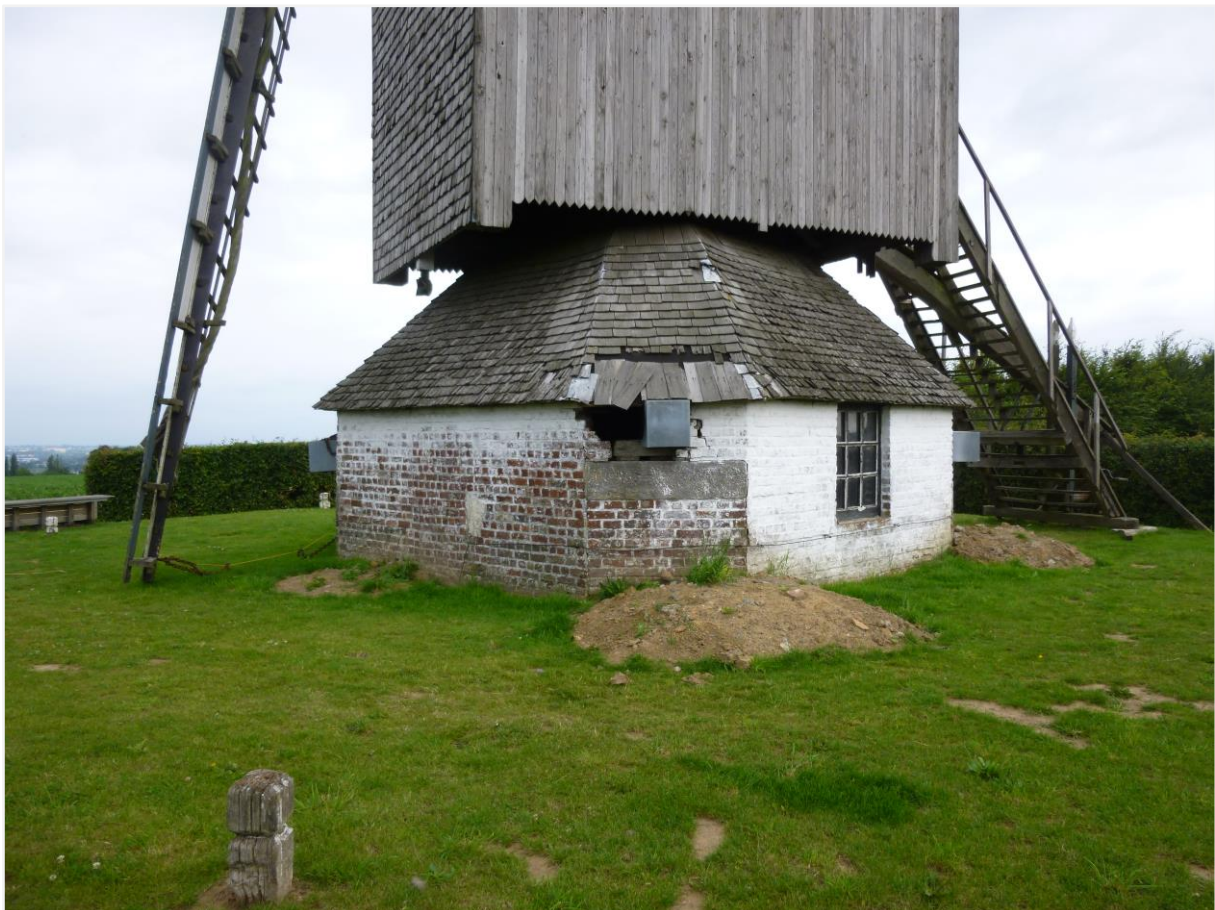
Foto 5: Gesloten molenvoet onder leien torendak. Schade aan leibedekking en het opgaand metselwerk.