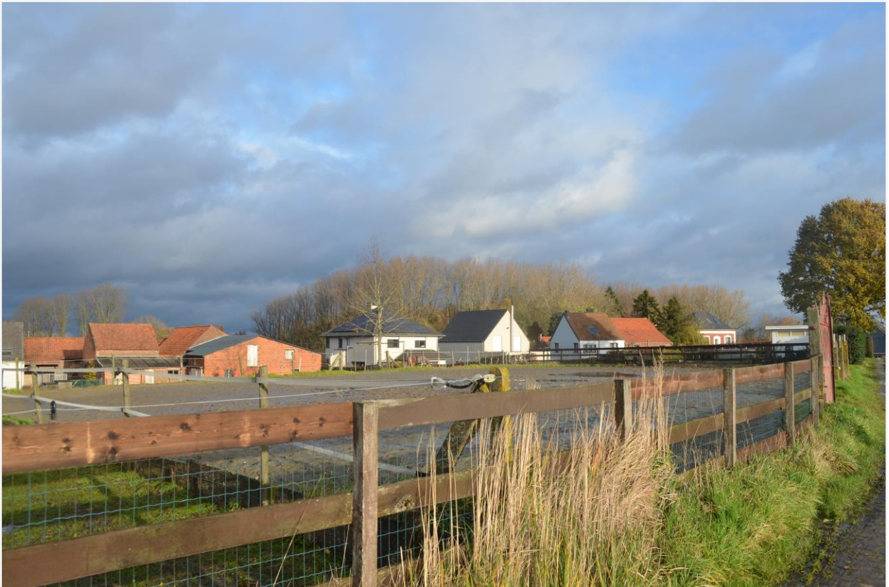
Foto 1: De oorspronkelijke locatie van de molen in Lede (datum opname 26 november 2019)