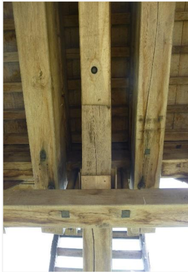
Foto 7: onderzijde molenkast met lange berriebalken, staartbalk, trap