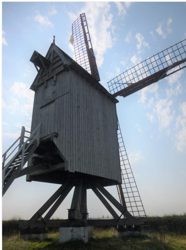
Foto 9: zicht op de voorweeg met kombuis en luikapje en rechterweeg