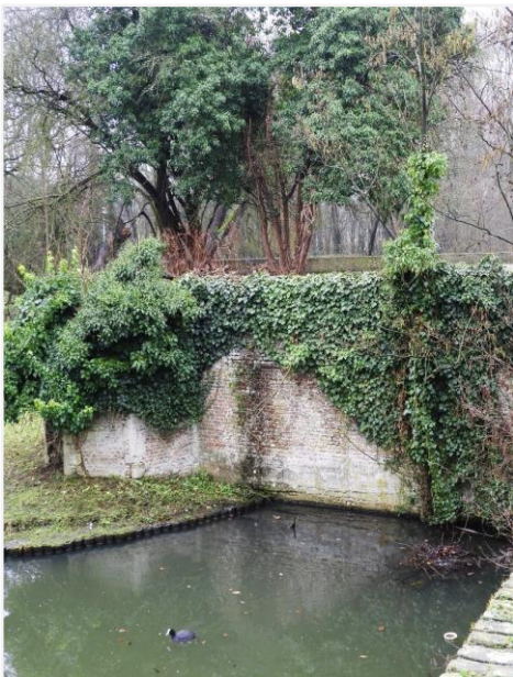
Foto 11: de keermuur aan de linkerzijde van de toegangsbrug. De veelhoekige uitbouw is het overblijfsel van een hoektoren.