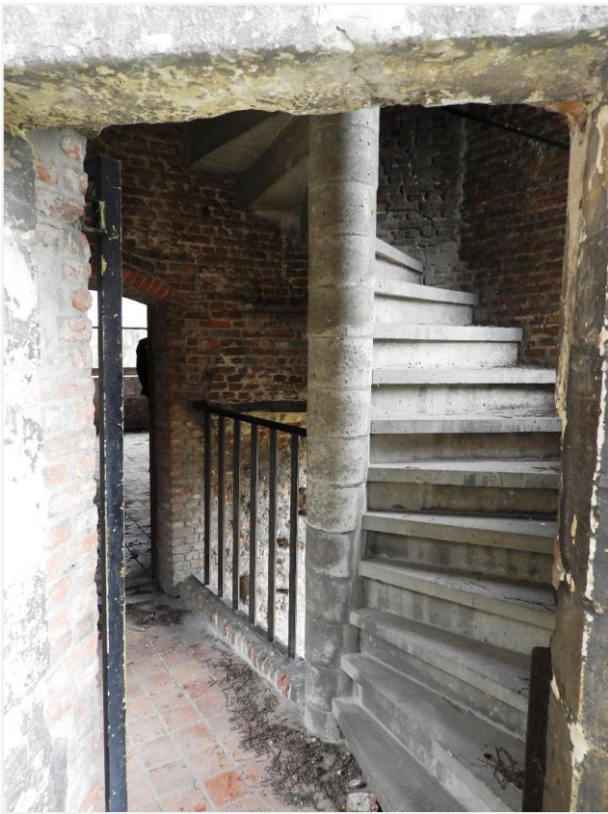
Foto 24: interieur van de traptoren. De betonnen wenteltrap werd toegevoegd tijdens de restauratie van 1981-1982.