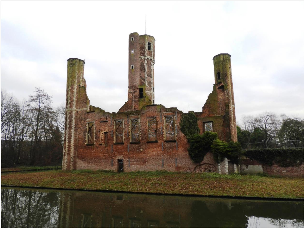
Foto 1: de kasteelruïne gezien vanuit het zuiden, met aanaarding langs de walgracht.