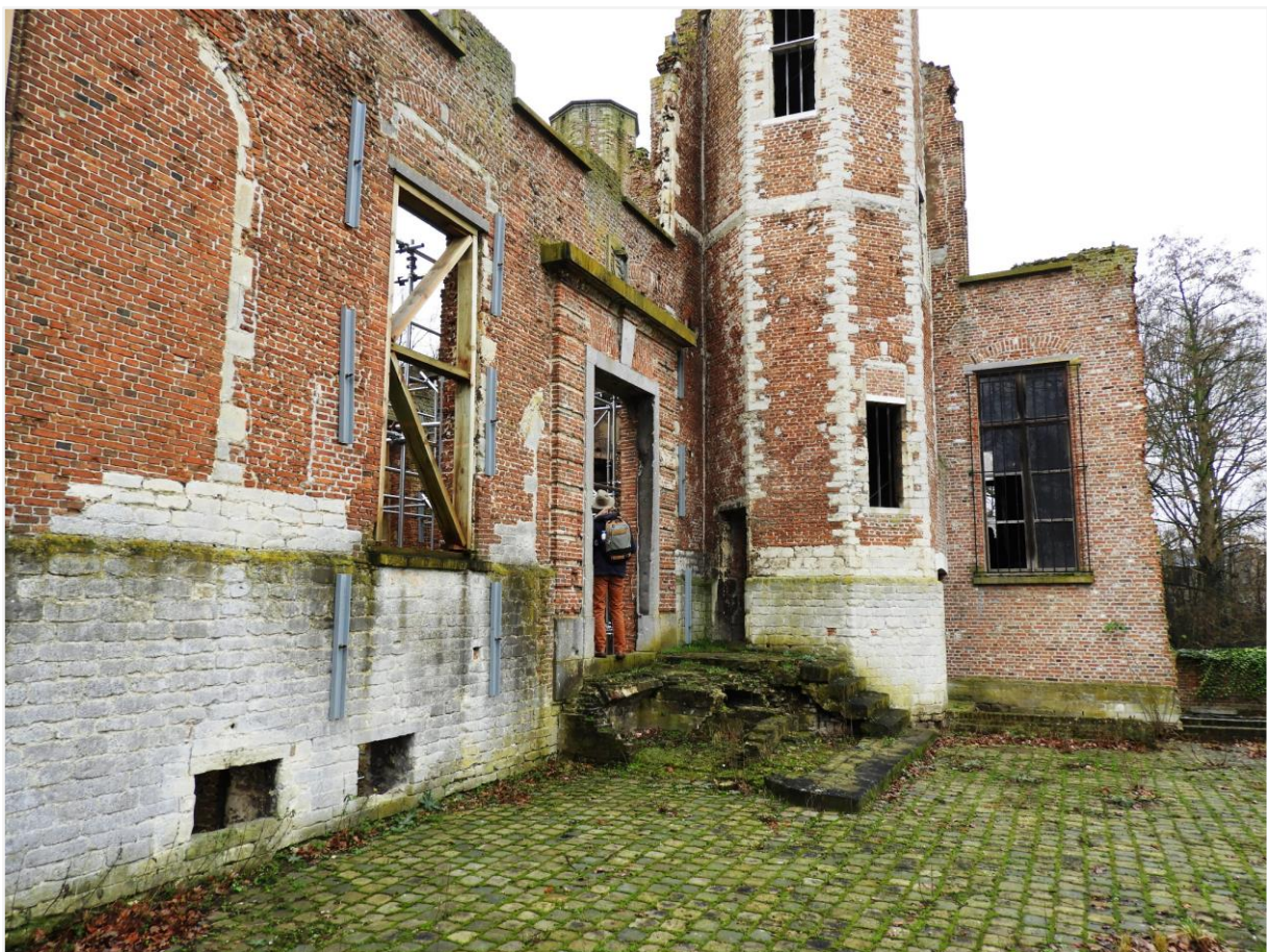
Foto 16: zicht op de voorgevel, de achthoekige traptoren en het overblijfsel van de westvleugel.