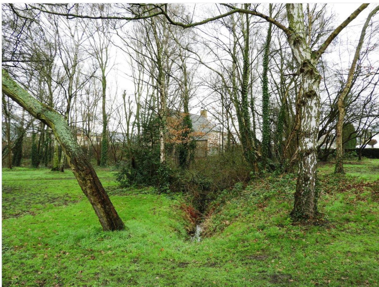
Foto 7: microreliëf op de plaats van het vroegere neerhof, ten noorden van de walgracht.