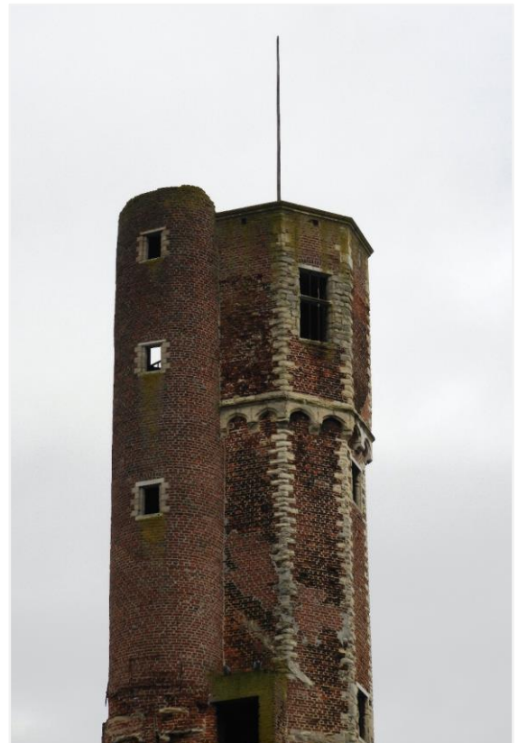
Foto 27: de bovenste geleding van de traptoren, gezien vanuit het zuiden.