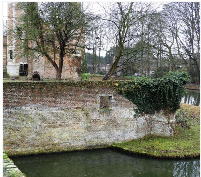
Foto 12: de keermuur aan de rechterzijde van de toegangsbrug, met bewaarde kelderopening en hoeksteunbeer.