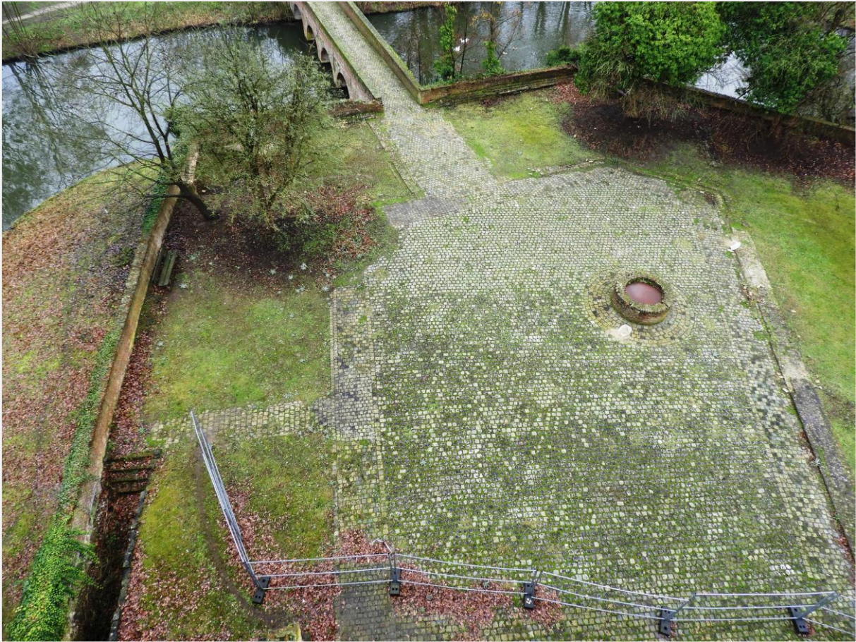
Foto 10: bovenaanzicht van het wooneiland van het kasteel. De onverharde oppervlakken duiden de plaats aan van de verdwenen gebouwen van het kasteel.