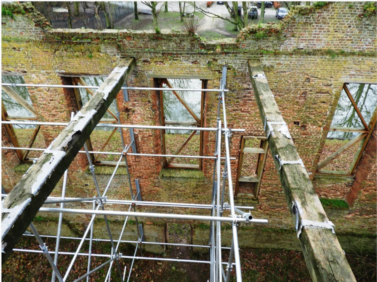
Foto 19: twee bewaarde moerbalken in de ruïne van de zuidvleugel.