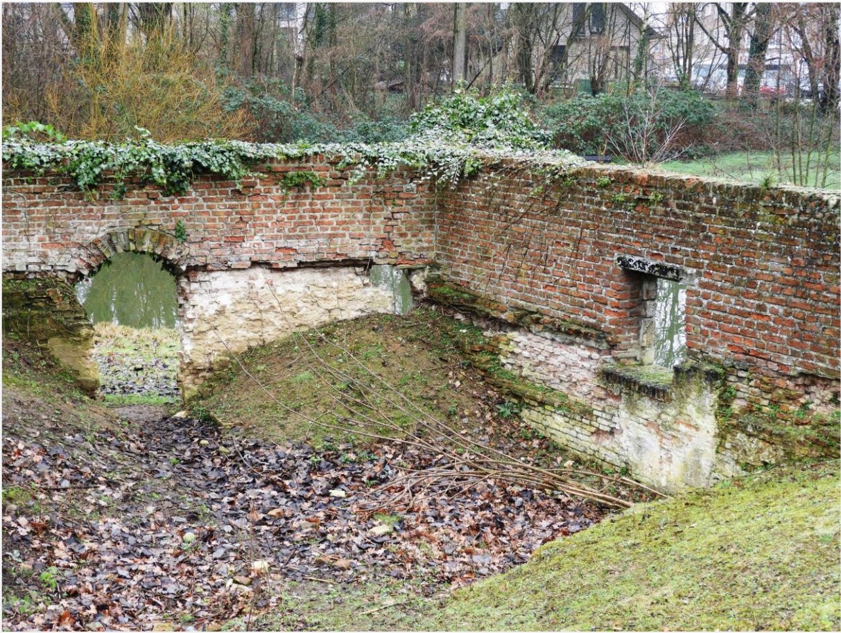
Foto 13: opgravingsput in de noordwestelijke hoek van het wooneiland.