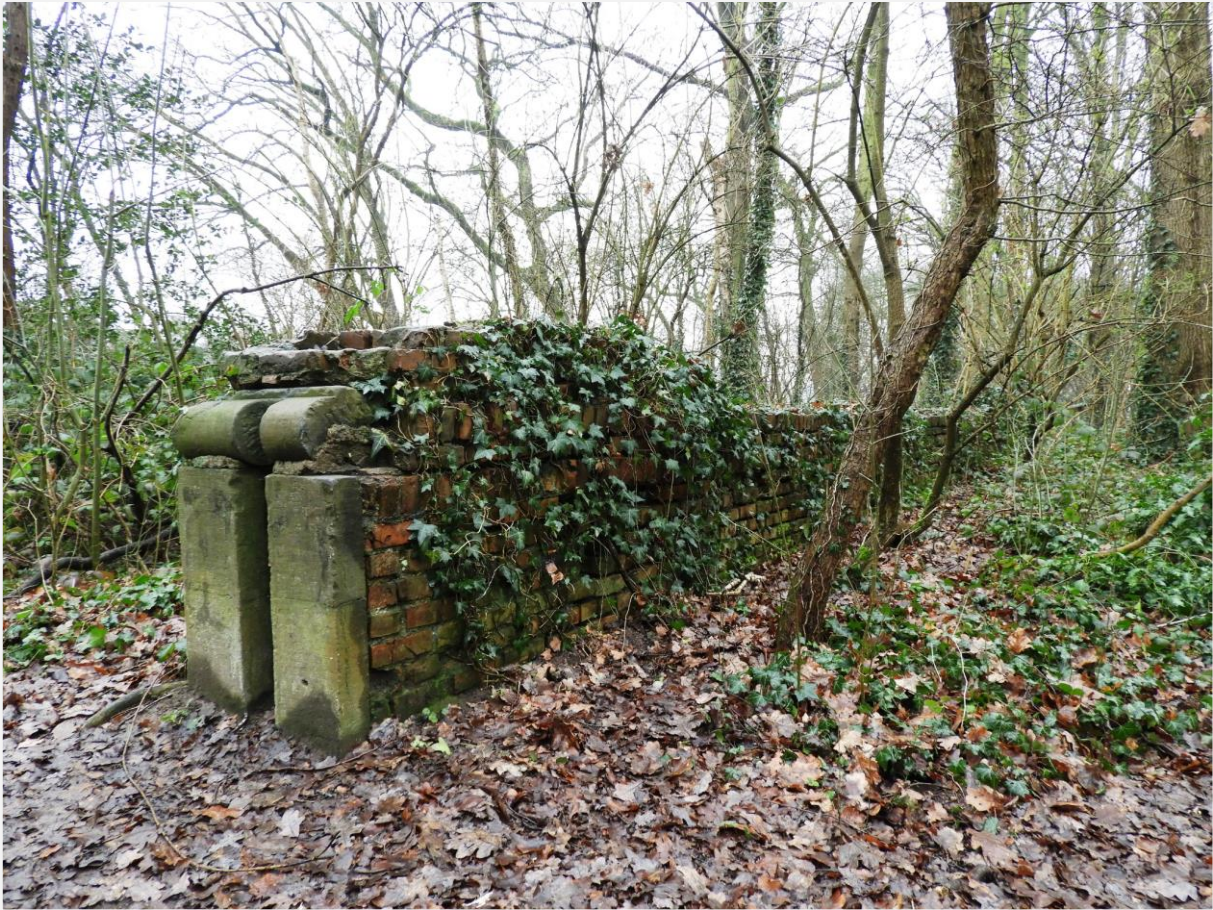
Foto 8: baksteenmuur met hardstenen dagkant, gelegen tussen de walgracht en de Netedijk.