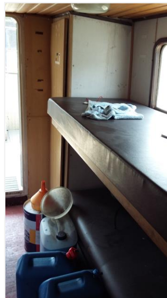
Foto 11: verblijf voor onderofficier tussen machinekamer en achterdek