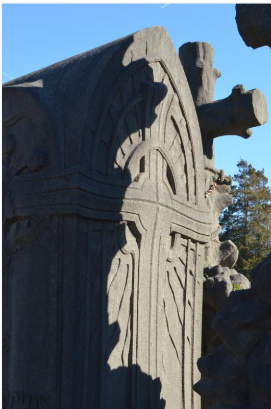
Foto 3: grafteken Huybrechts-Coppejans, rechter zijkant, bovenafwerking