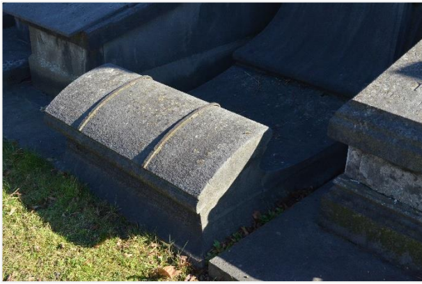
Foto 5: grafteken Huybrechts-Coppejans, zerk met kerend voetstuk en metalen structuren