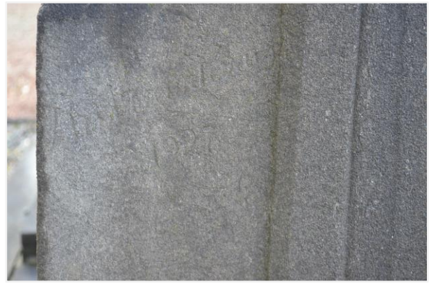
Foto 6: het grafteken Moreau-Deneve, signatuur beeldhouwer Antoon Van Parys